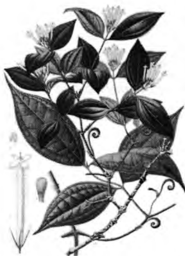
Curare – Strychnos toxifera 24

Descola assinala que a palavra curare na verdade é um termo genérico para diferentes venenos de caça utilizados na Amazônia. Estes cobrem uma série de preparações tóxicas diferentes, usualmente feitas da planta do gênero Strychnos . Os Achuar misturam a fruta da Strychnos jobertiana a outras substâncias para adquirir um veneno mais potente (1994: 225).