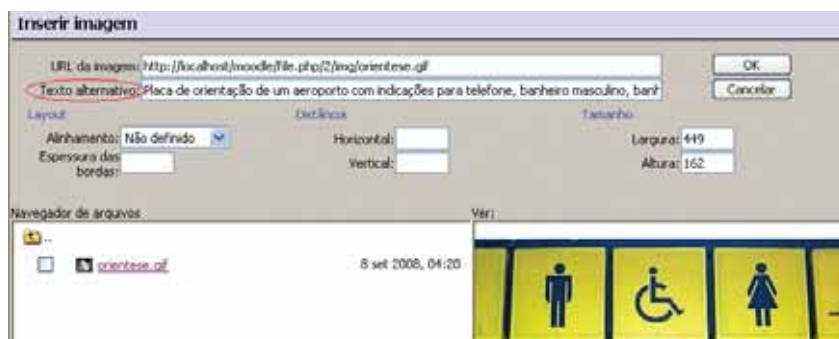
Figura 01: Figura da janela de importação de arquivo de imagem com destaque para o campo de preenchimento obrigatório “Texto alternativo”

vezes, impossibilidade da compreensão da imagem pelos usuários de softwares leitores de tela. Portanto, é de fundamental importância que esta descrição seja considerada pelo autor/a no momento de concepção da ação educacional para garantir, a todos, o pleno entendimento dos recursos gráficos utilizados.