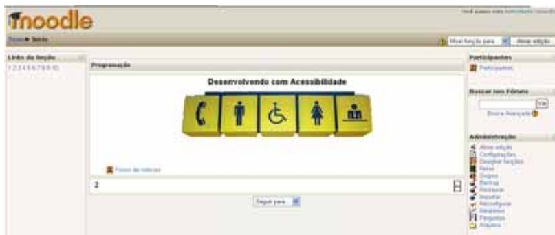
Figura 02: Figura do layout do Moodle apresentando o bloco “links de seção” localizado no canto superior esquerdo

de links que o usuário irá encontrar no canto superior esquerdo, a primeira linha que o leitor de tela encontra e que possibilita ao usuário escolher para onde ir. Os demais blocos foram organizados conforme necessidades específicas do curso.