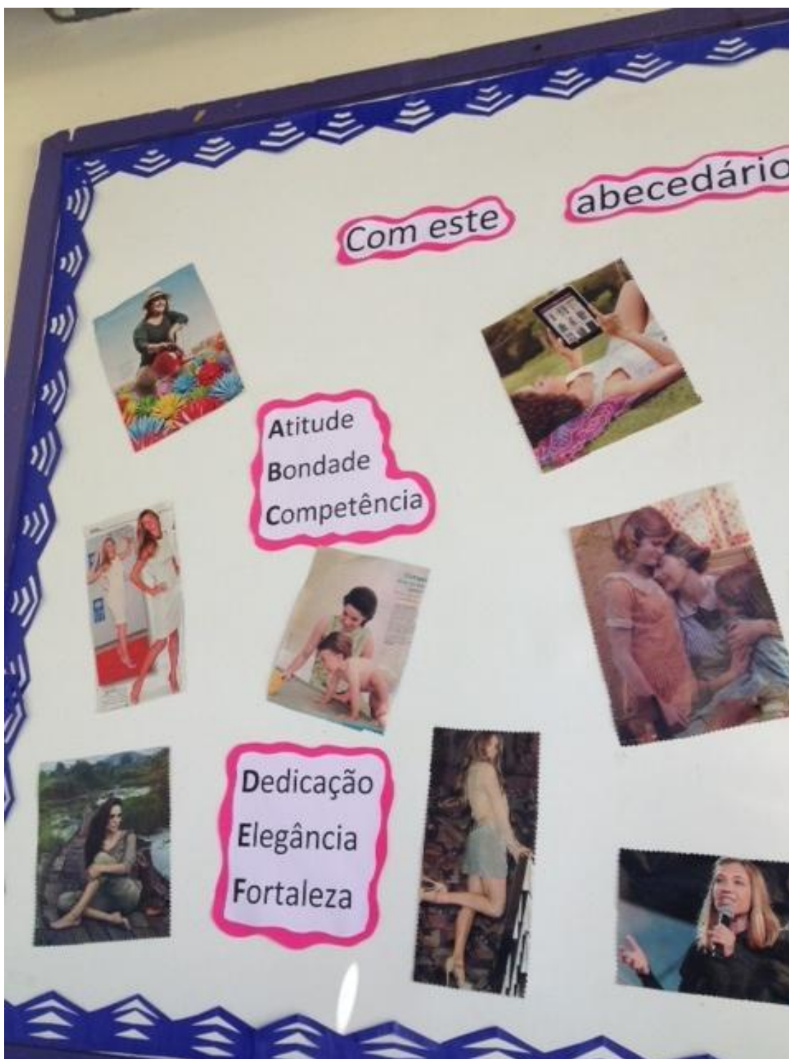
Figura 5: Mural da escola em comemoração ao dia Internacional da Mulher