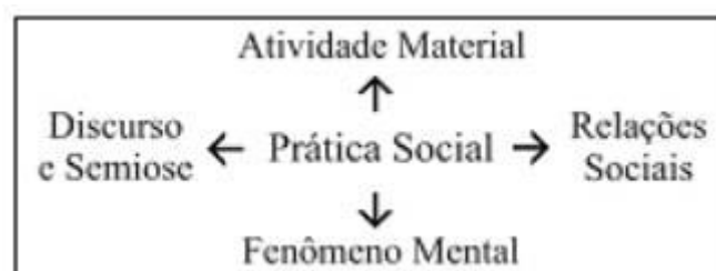
Figura 1: Momentos da Prática Social

Restabelece-se, por tanto, um novo conceito de práticas sociais, como “maneiras habituais, em tempos e espaços particulares, pelas quais as pessoas aplicam recursos – materiais ou simbólicos – para agirem juntas no mundo” (CHOULIARAKI e FAIRCLOUGH, 1999, p. 21). Para exemplificar o modelo proposto pela autora e pelo autor, Resende & Ramalho (2004) ilustram da seguinte forma: