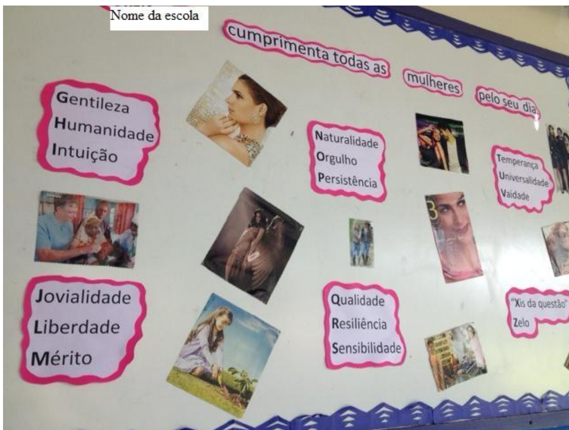
Figura 6: Mural da escola em comemoração ao dia Internacional da Mulher

Assim como a figura 1, as figuras 2, 3, 4 e 5 fazem menção ao dia 08 de março, dia internacional da mulher. A figura de número 2, no entanto, foi retirada da página oficial da escola em uma rede social e as figuras de 3 a 5 foram fotos feitas por mim ao longo da semana do dia 08 de março e são fotos que retratam os murais externos às salas de aula, em um corredor de entrada por onde passam todas as alunas e todos os alunos ao se dirigirem para as salas de aula.