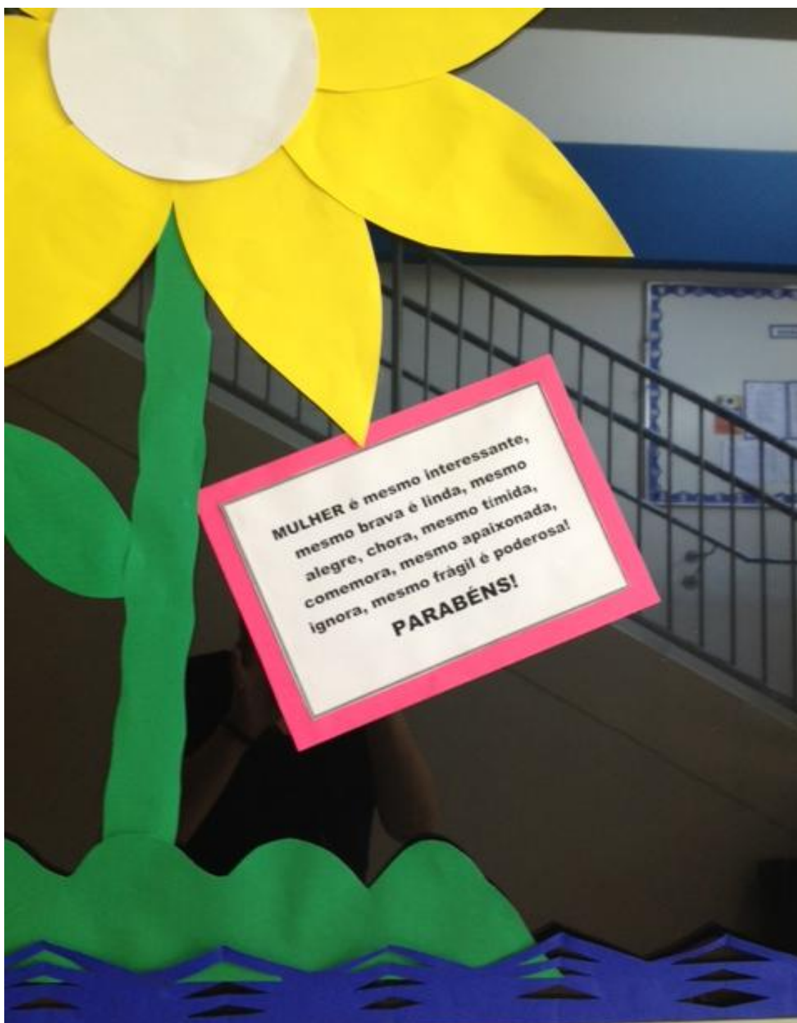
Figura 4: Mural da escola em comemoração ao dia Internacional da Mulher Fonte: Foto da autora, março/2013