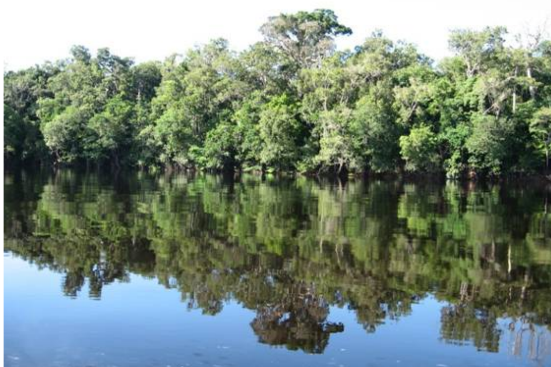
Figura 1. Amazonía Central. (A) Bosques inundados por los ríos de aguas blancas (várzea); (B) Bosques inundados por los ríos de aguas negras (igapó).

La inundación de los bosques de tierras bajas y los humedales se produce cada año y puede durar hasta siete meses consecutivos. Durante este período, la columna de agua aumenta su altura en un promedio de 10 m (Junk et al., 1989). Bajo tales condiciones, muchas plántulas y árboles quedan completamente sumergidos por un período prolongado. En las tierras bajas, las aguas que invaden las llanuras transportan cantidades apreciables de sedimentos en suspensión, que se depositan en la superficie de las tierras marginales. Este fenómeno promueve la renovación cíclica de estos suelos, lo que explicaría su alta fertilidad (Sioli, 1951; Irion et al., 1983).