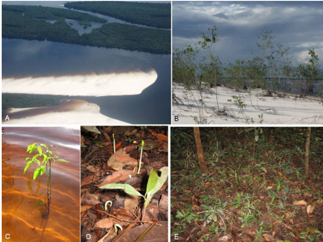
Figura 4. Bosques de igapó: vista aérea del bosque a lo largo del río Negro (A) durante el inicio de la fase terrestre, evidenciando la ausencia de herbáceas acuáticas; (B) suelo arenoso expuesto durante el período de aguas bajas, colonizado por arbustos tolerantes a la inundación; (C) Plántula germinada en el agua; (D) germinación del banco de semillas en el interior del bosque después del descenso de las aguas; (E) Vista de las plántulas en el proceso de establecimiento y crecimiento durante el período terrestre en un bosque de igapó bajo, aproximadamente un mes después del descenso de las aguas.