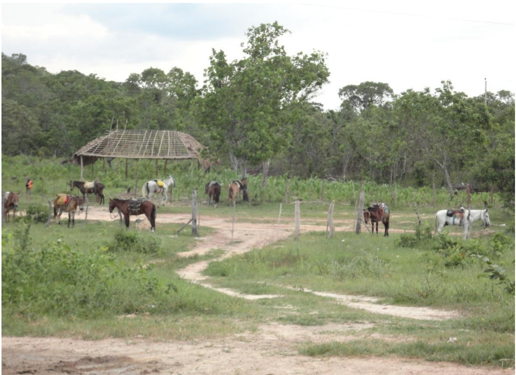
Imagem n. 41: Animais que levam os foliões a casa dos devotos Janeiro, 2013.