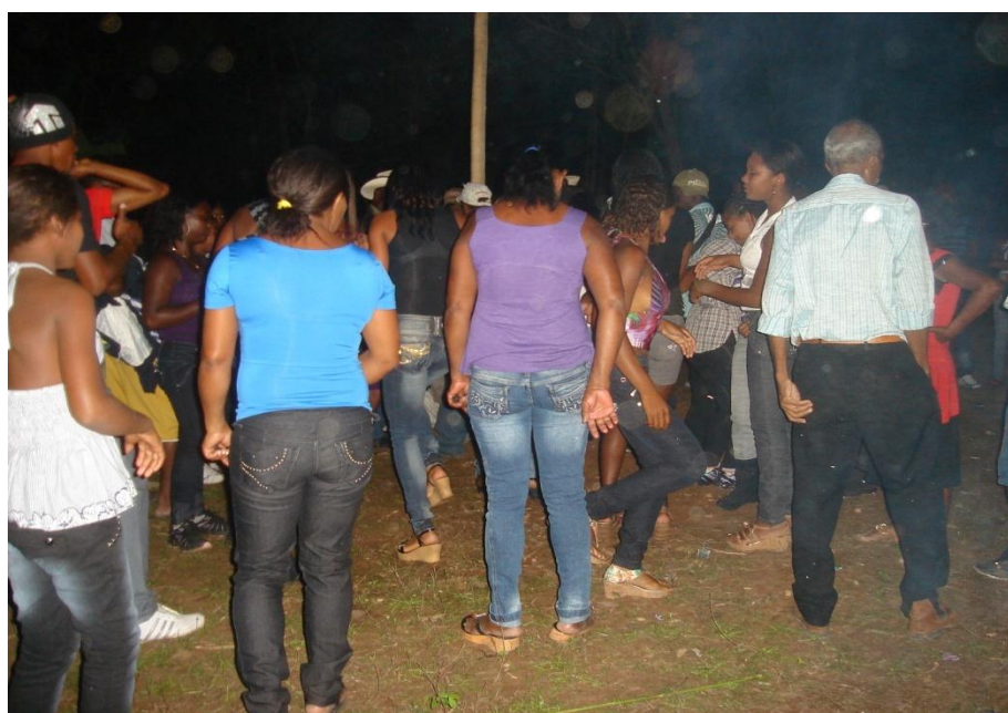
Imagem n. 17: Mulheres dançando a sussa Outubro, 2011.

Após erguerem o mastro, os homens cantaram e algumas mulheres dançaram a sussa. Foi oferecido vinho às pessoas. A respeito deste símbolo sagrado o mastro é uma referência para a comunidade porque significa o ponto fixo, a raiz daquela gente. Quanto à oferta de vinho, em seu artigo “Bebida alcóolica e sociedade colonial”, Scarano argumenta que esse “ocupa significativo papel dentre as bebidas alcólicas e seu uso e valorização vêm desde tempos imemoriais” (2001, p. 468). Desde maneira, o ato de oferta de bebidas em festas é um costume muito comum na sociedade.