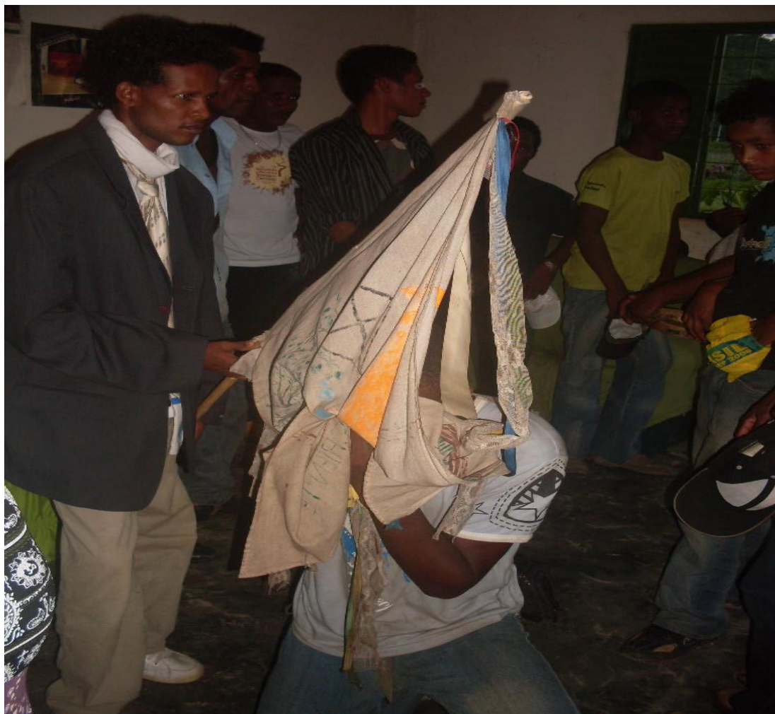
Imagem n. 22: Foliões beijando a bandeira Autoria: Rosirene Campêlo dos Santos. Janeiro, 2013