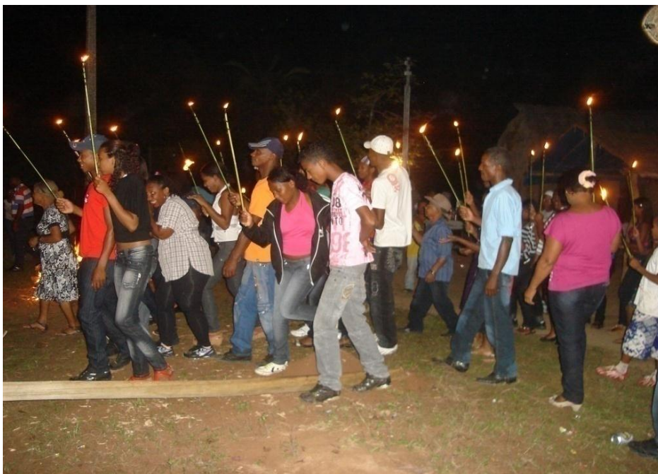
Imagem n. 15: Procissão ao redor do mastro Autoria: Rosirene Campêlo dos Santos. Outubro, 2011.

O folião, que toca a caixa, deu o ritmo da toada, que parecia mais um chamamento para que todos ficassem atentos ao que acontecia. Este momento é mágico e fascinante de se ver. Todos pararam e o sr. Balbino juntamente com os demais colocaram a bandeira/estandarte na ponta do mastro e este foi erguido. Neste momento soltaram-se muitos fogos.