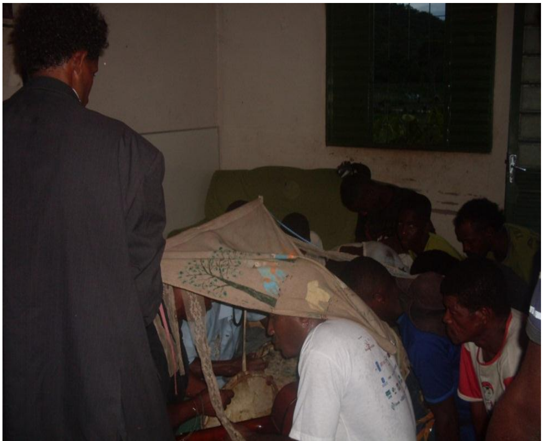
Imagem n. 21: Alferes abençoando os foliões com a bandeira da Folia de Santos Reis Janeiro, 2013.

Como acompanhei a Folia de Santos Reis por alguns dias, procurarei expor, a seguir, algumas imagens fotografadas no decorrer do processo ritual, que representem a importância da festa para a comunidade, bem como a fé e a devoção desta.