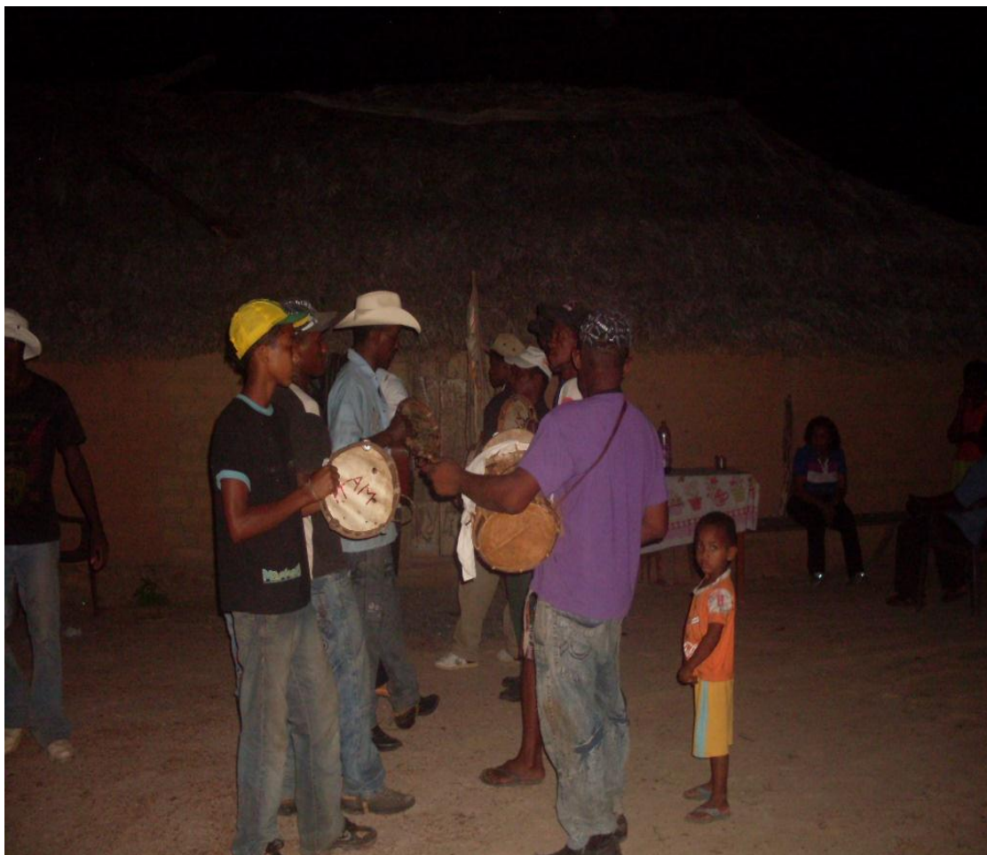
Imagem n. 25: Foliões cantando para serem recebidos por moradores Janeiro, 2013.