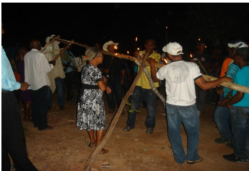
Imagem n.16: Comunidade erguendo o mastro com a bandeira de São Sebastião Outubro, 2011.