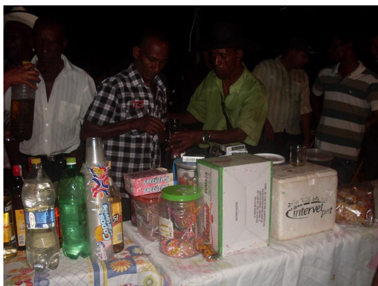
Imagem n. 20: Compra e venda de bebida na Festa de São Sebastião Autoria: Rosirene Campêlo dos Santos. Outubro, 2011.

Assim, creio que a ato de ingerir bebidas alcoólicas em festas é bastante antigo nessa sociedade, independente do motivo da comemoração, a justificativa estava relacionadas à homenagem aos santos de devoção.