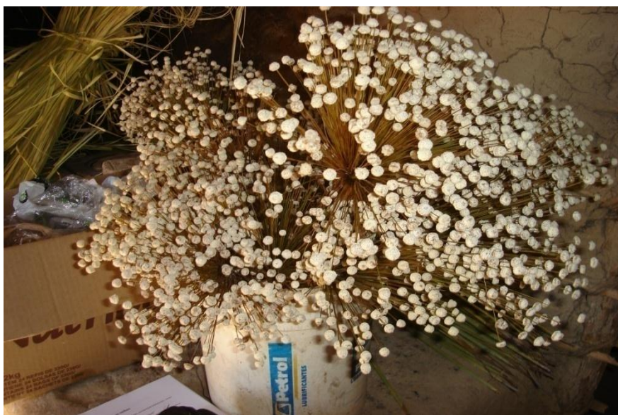
Imagem 4: Capim Dourado – material utilizado na produção do artesanato Autoria: Rosirene Campêlo dos Santos. Julho 2012.

Outra fonte de renda são os artesanatos, que algumas mulheres se dedicam atualmente. São feitos, em sua maioria, com materiais colhidos no cerrado como capim dourado, palhas de bananeiras, dentre outros. Tais artesanatos são vendidos na comunidade, e outros, em eventos, dos quais as mulheres da comunidade participam, o que constituem uma importante fonte de renda.