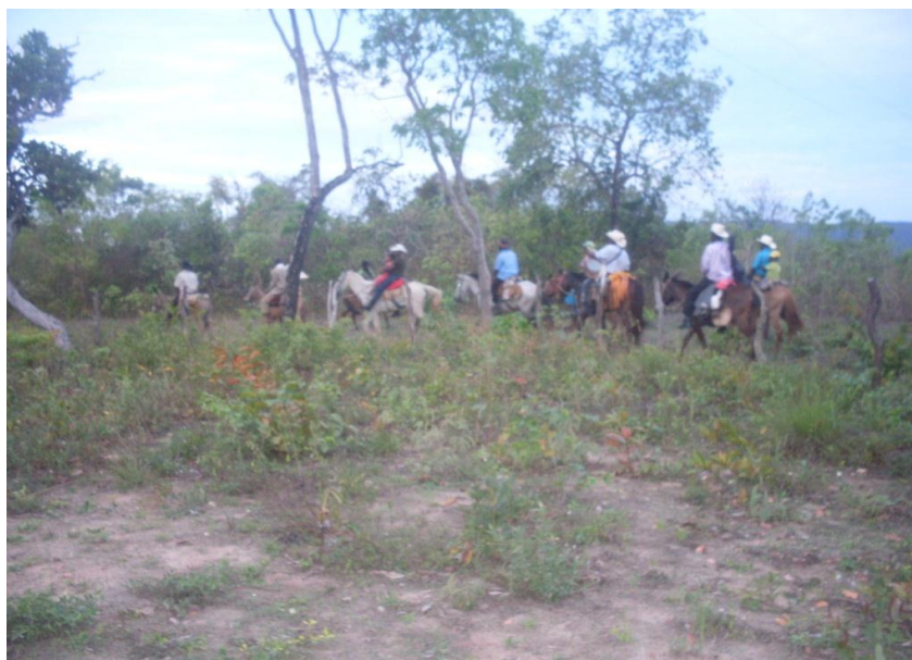
Imagem 8: Giro da Folia de São Sebastião Outubro, 2011.

única mulher, que, em certo momento, fez parte do ritual foi a dona da folia. O restante da comunidade observava tudo ao longe.