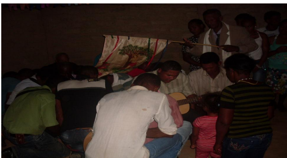
Imagem n. 11: Alferes abençoando os foliões com a bandeira de São Sebastião Outubro, 2011.