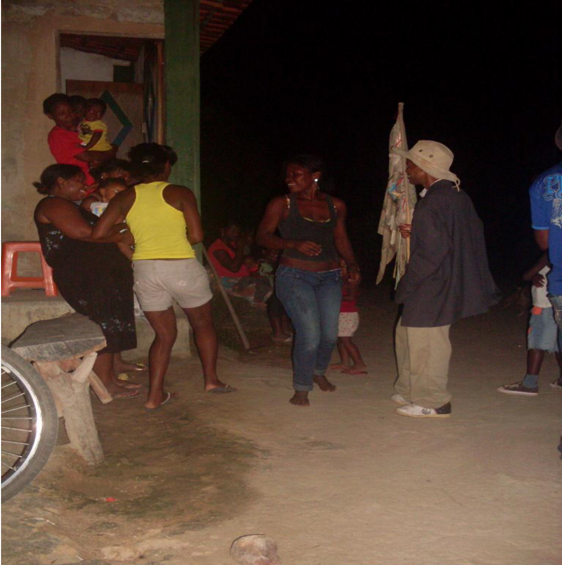
Imagem n. 37: Mulheres dançando a sussa no giro da Folia de Santos Reis Autoria: Rosirene Campêlo dos Santos. Janeiro, 2013.