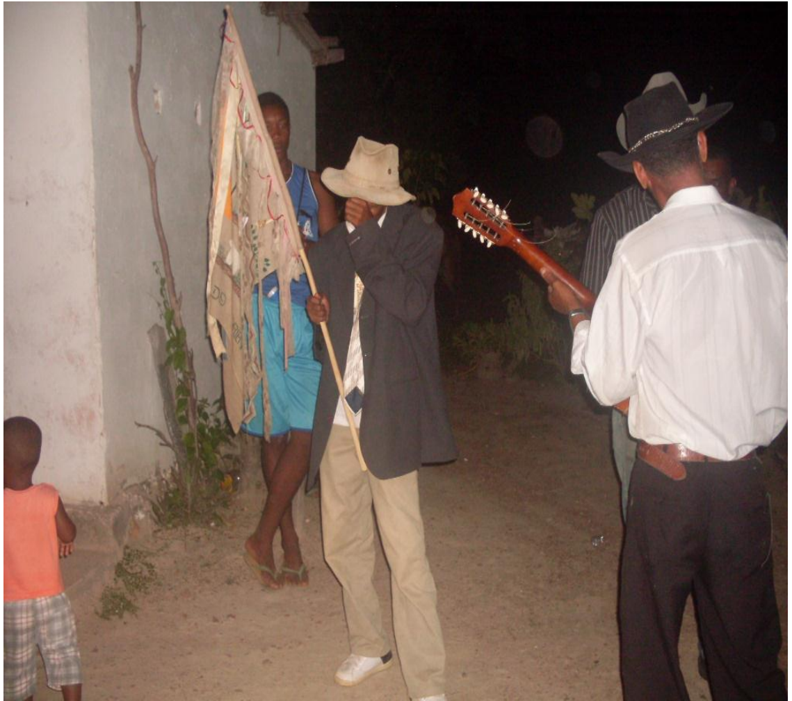
Imagem n. 24: Alferes conduzido a Folia Autoria: Rosirene Campêlo dos Santos. Janeiro, 2013.