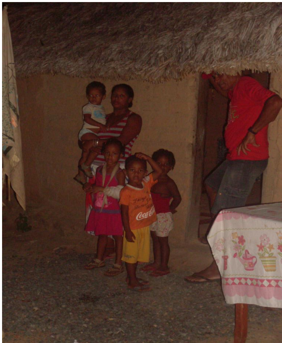
Imagem n. 27: Moradores com sua família Janeiro, 2013.