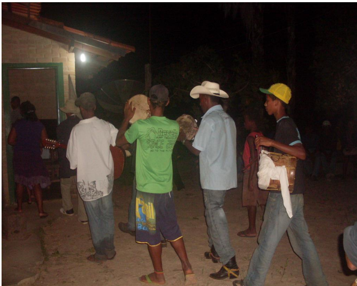
Imagem n. 41: Foliões chegando a última casa na noite do último dia do giro da folia Janeiro, 2013.