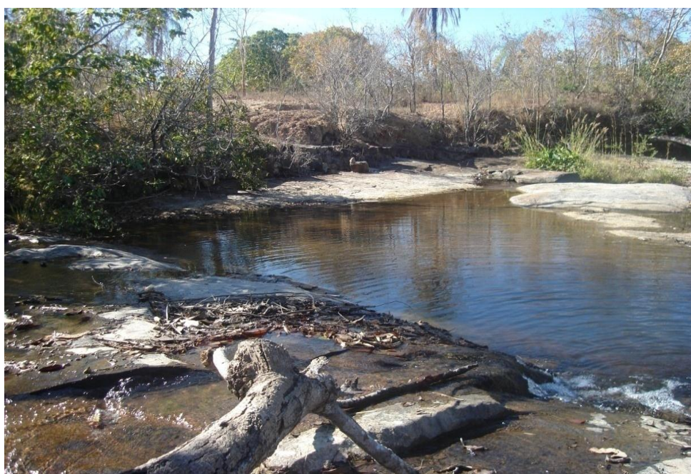
Imagem 3: Ribeirão situado no agrupamento de Limoeiro Autoria: Rosirene Campêlo dos Santos. Julho 2012.

As casas localizam-se ao longo das margens direita e esquerda da estrada, porém é possível dizer que há uma predominância de casas na margem direita, em razão do percurso do rio, um dos lugares preferidos das crianças. O rio também é o fornecedor de água para o desenvolvimento das atividades da comunidade, tais como: tomar banho, lavar roupas, dentre outras.