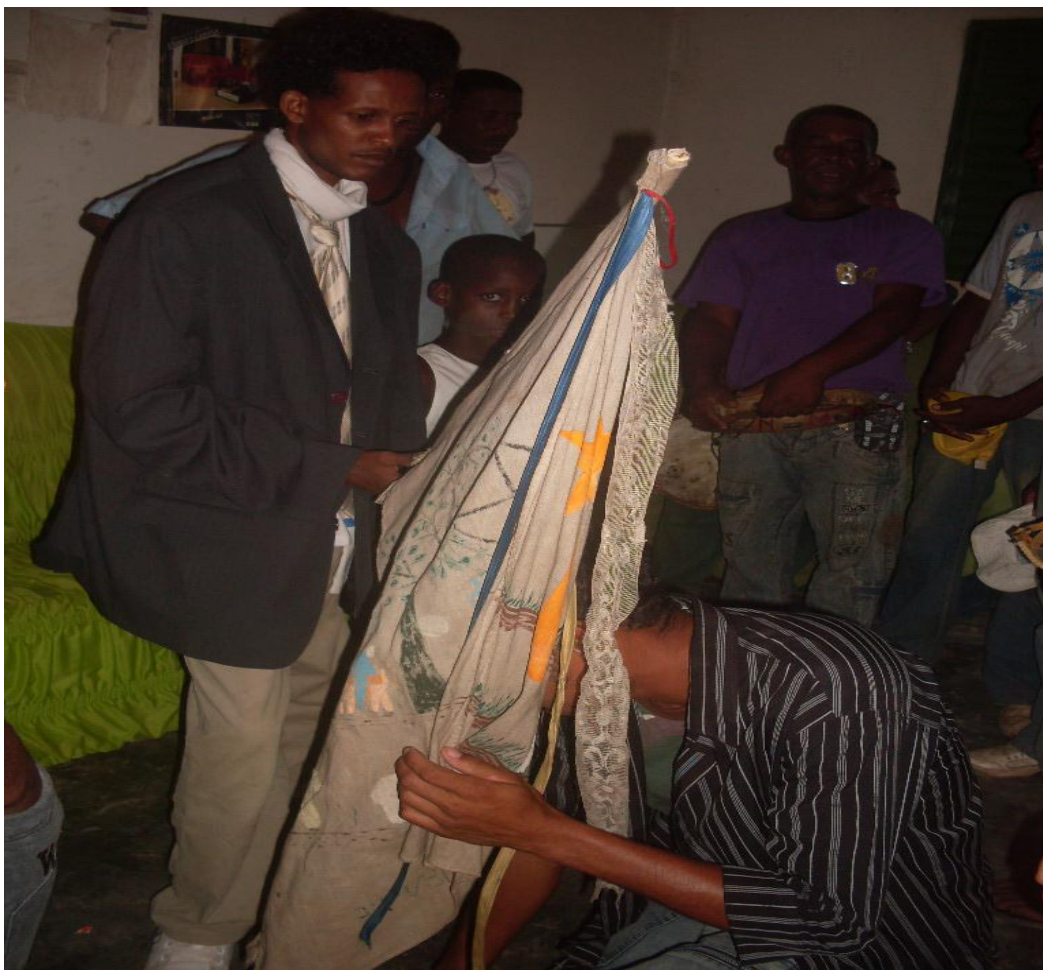
Imagem n. 23: Foliões adorando a bandeira da Folia de Santos Reis Janeiro, 2013.