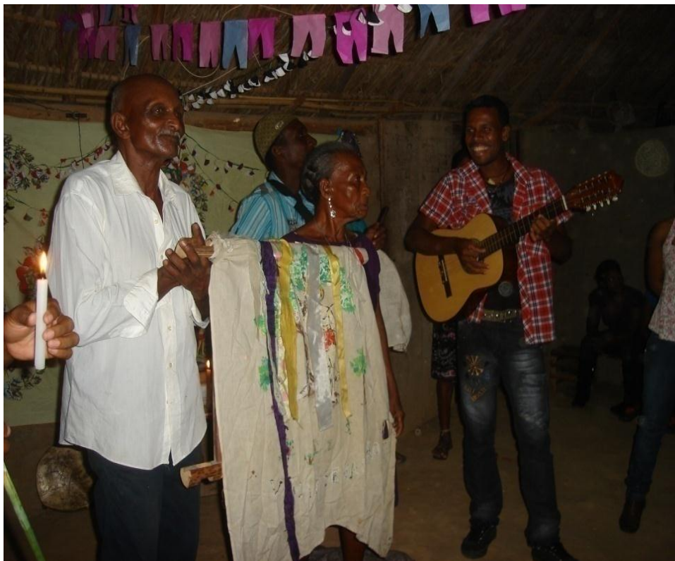
Imagem n. 14: Pessoas mais velhas conduzindo a bandeira para o mastro Autoria: Rosirene Campêlo dos Santos. Outubro, 2011.

O sr. Balbino e uma sra. foram à frente da procissão e levaram a bandeira/estandarte com a imagem do santo homenageado, adornada com fitas coloridas.