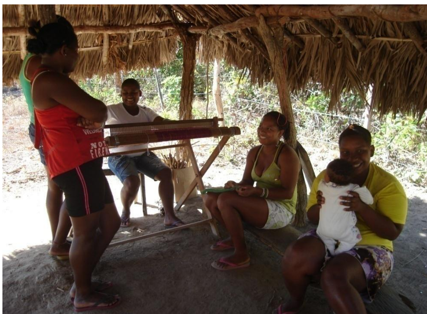
Imagem 5: Mulheres na execução dos trabalhos de artesanato Julho 2012.