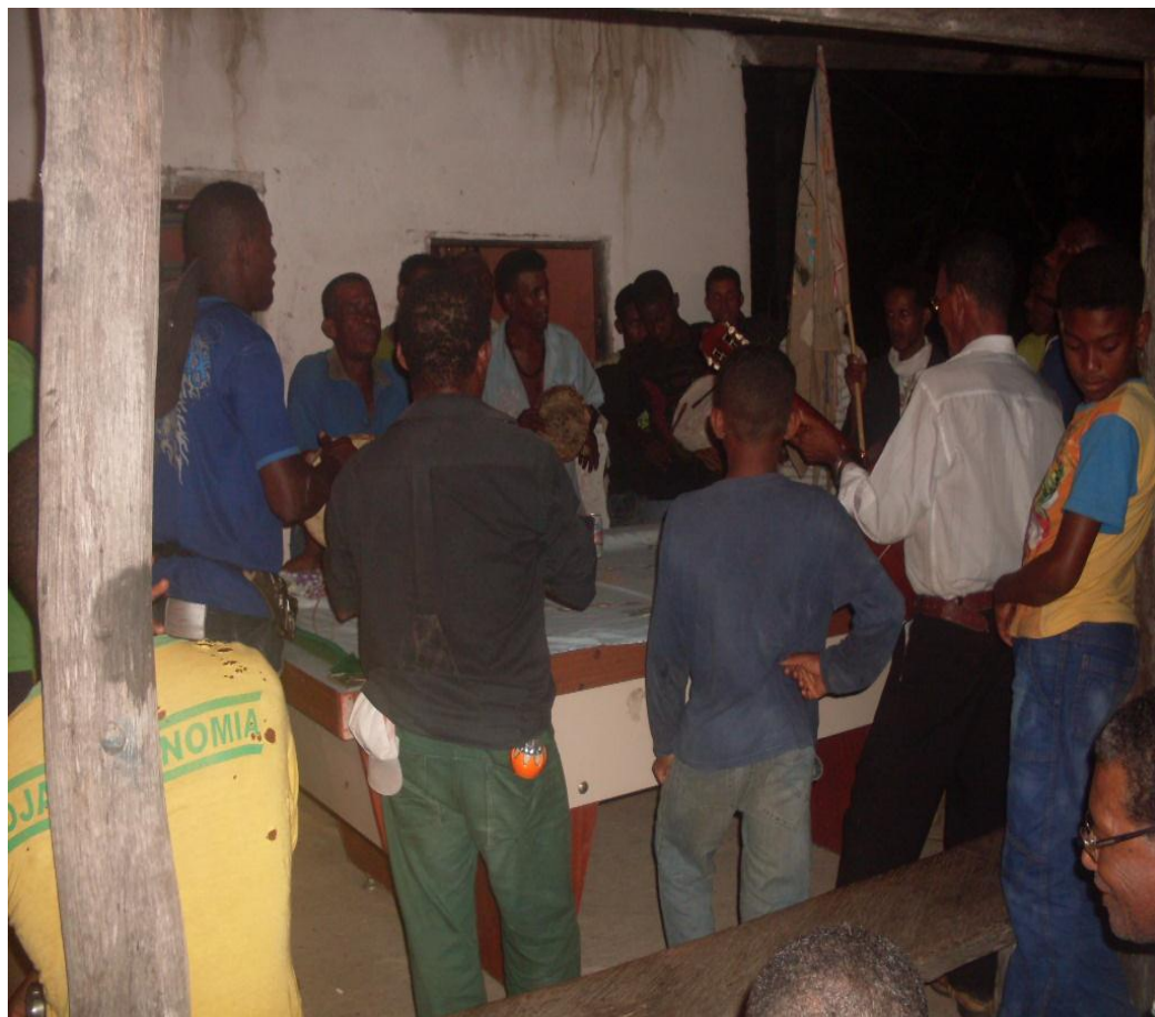
Imagem n. 34: Foliões cantando o bendito da mesa em homenagem aos Santos Reis Janeiro, 2013.