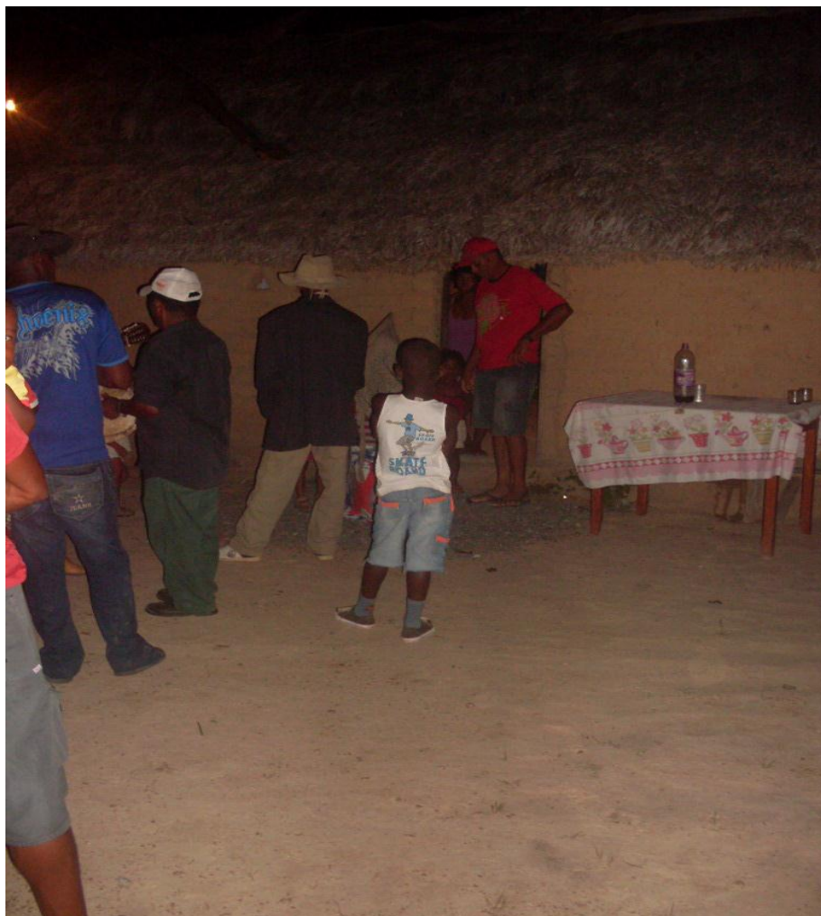
Imagem n. 26: Moradores recebem a Folia de Santos Reis Janeiro, 2013.