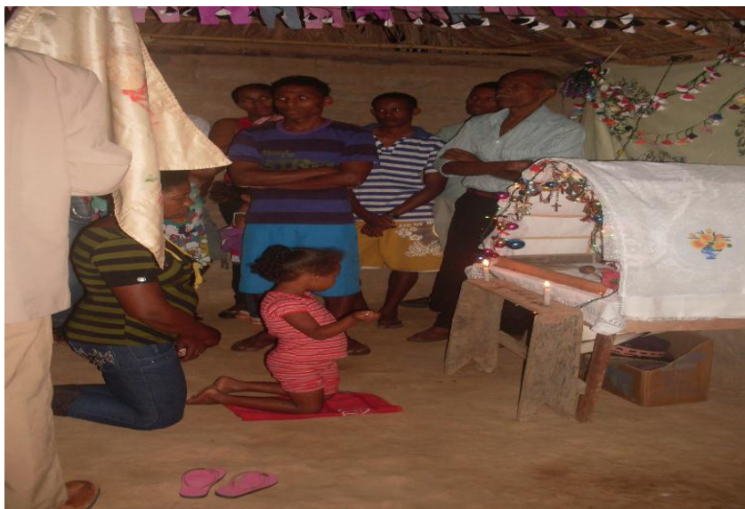
Imagem n. 10: Devota que recebeu a graça com a neta em frente ao altar de São Sebastião Outubro, 2011.

Como em toda folia o alferes vai à frente dos foliões e carrega a bandeira com a imagem de São Sebastião e os demais foliões seguem atrás. Ao entrarem na sala, dona Joana e a neta ajoelharam-se em frente do altar. Os foliões cantaram. Dona Joana levantou-se e recebeu a bandeira de São Sebastião. O alferes se aproximou, fez reverência e beijou a bandeira. E, em seguida, de posse da bandeira, ele passou-a sobre todos os foliões, que, nesse momento, estavam ajoelhados.