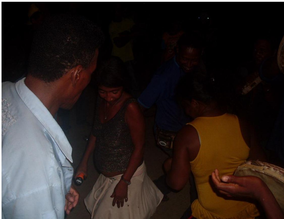
Imagem n. 36: Batucada após o jantar em que todos dançaram Janeiro, 2013.