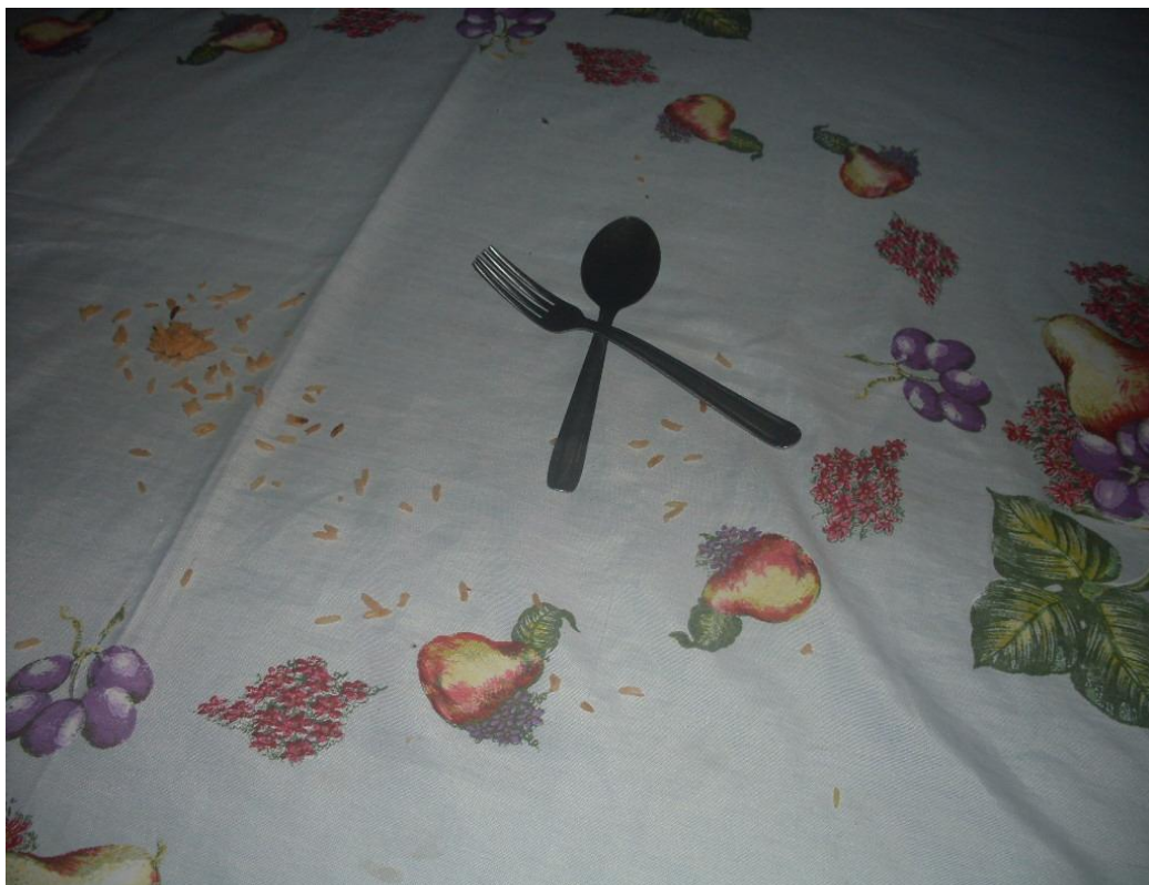
Imagem n. 33: Objetos simbólicos de agradecimento Janeiro, 2013.