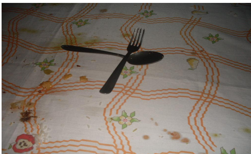
Imagem n. 13: Símbolo do Bendito da Mesa após o Jantar Outubro, 2011.