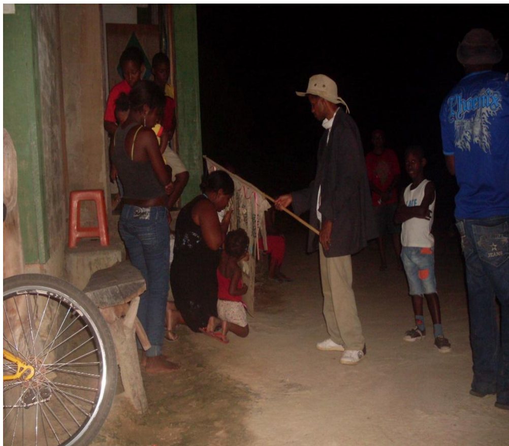
Imagem n. 31: Dona da casa com os filhos e netos recebendo os foliões Janeiro, 2013.