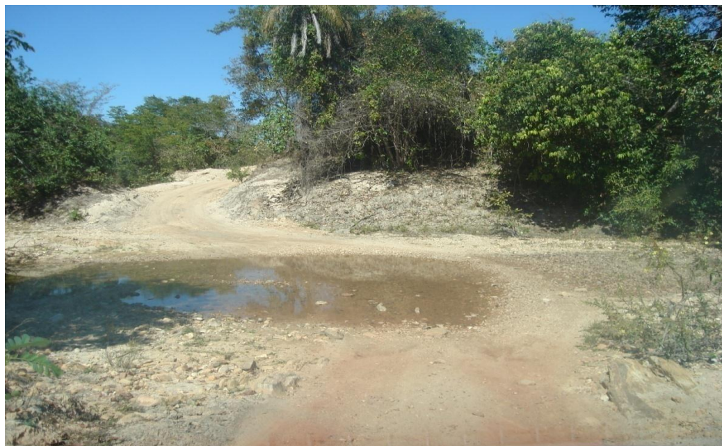
Imagem 2: Estrada entre o agrupamento de Ema e Ribeirão Autoria: Rosirene Campêlo dos Santos. Julho 2012.

Assim, faz-se importante ressaltar que a presente pesquisa foi realizada no município de Teresina de Goiás, a 583 km da cidade de Goiânia, capital do estado de Goiás, especificamente nos agrupamentos de Ema, Limoeiro e Ribeirão. A localização dos referidos agrupamentos encontra-se ao longo do caminho para o núcleo Vão de Almas, situado ao pé da serra. Foi neste caminho que realizei esta pesquisa, percorrendo as estradas de chão, aventurando-me ao passar na ponte que liga um agrupamento ao outro. Foi lá que encontrei um povo humilde, acolhedor, alguns contentes, outros desanimados, mas dispostos a conversar sobre suas festas, danças e cultura.