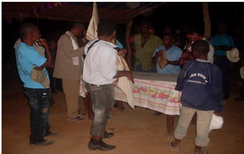
Imagem n. 12: Canto do bendito da mesa – Folia de São Sebastião Autoria: Rosirene Campêlo dos Santos. Outubro, 2011.