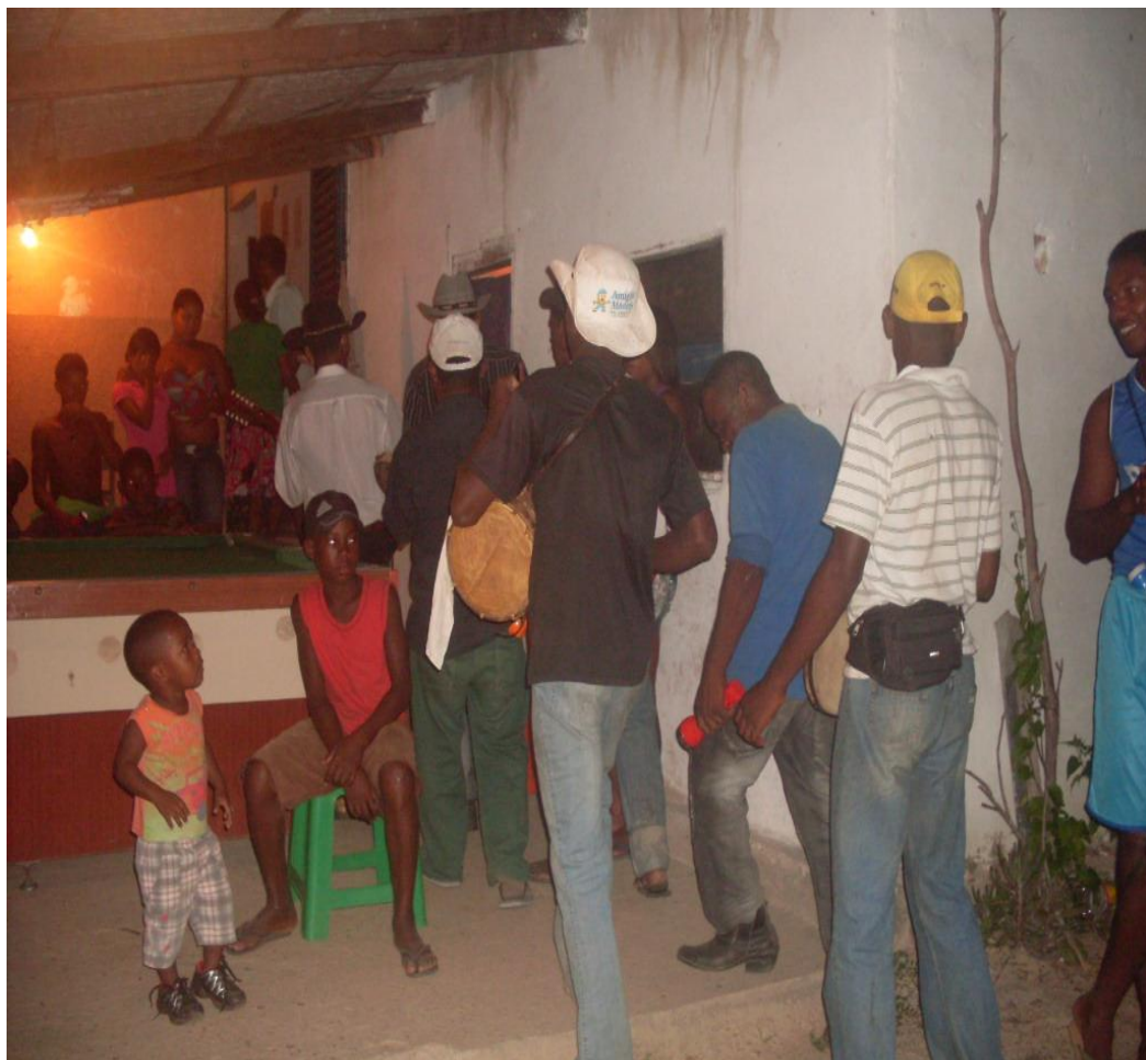
Imagem n. 29: Entrada dos Foliões na casa dos moradores Janeiro, 2013.