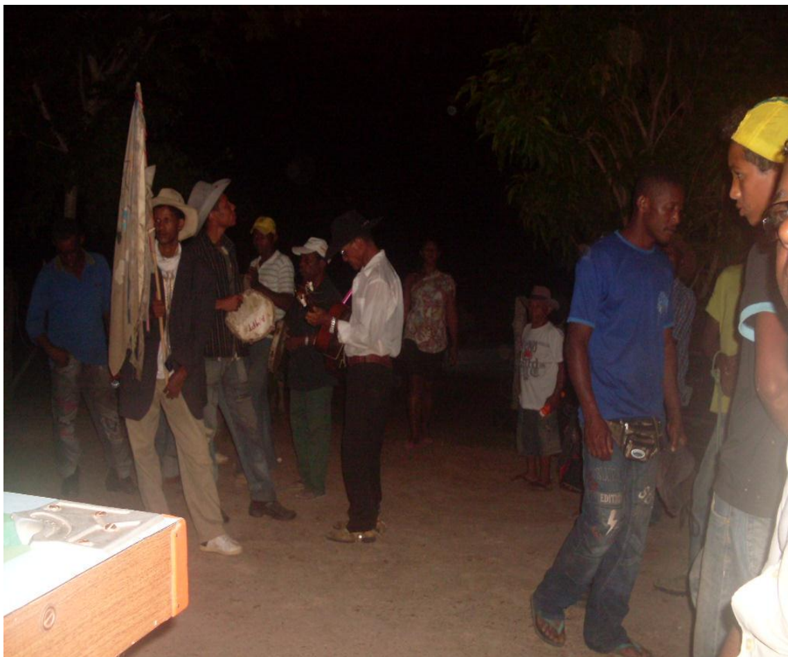
Imagem n. 28: Chegada dos foliões em mais uma noite de folia Janeiro, 2013.