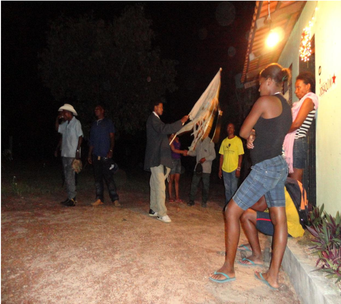
Imagem n. 40: Alferes abençoado a casa da moradora Janeiro, 2013.