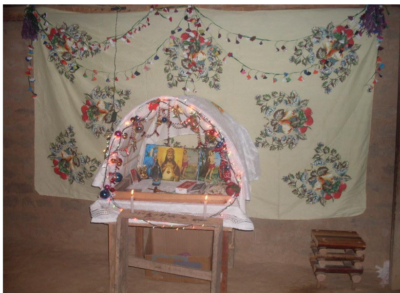
Imagem 9: Altar com imagens de São Sebastião e outros Santos Outubro, 2011.