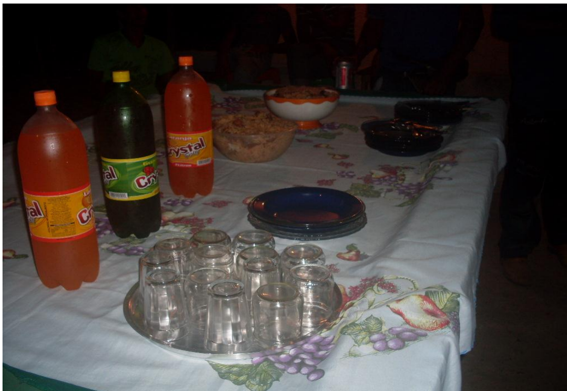
Imagem n. 32: Mesa preparada com as refeições para o jantar Janeiro, 2013.