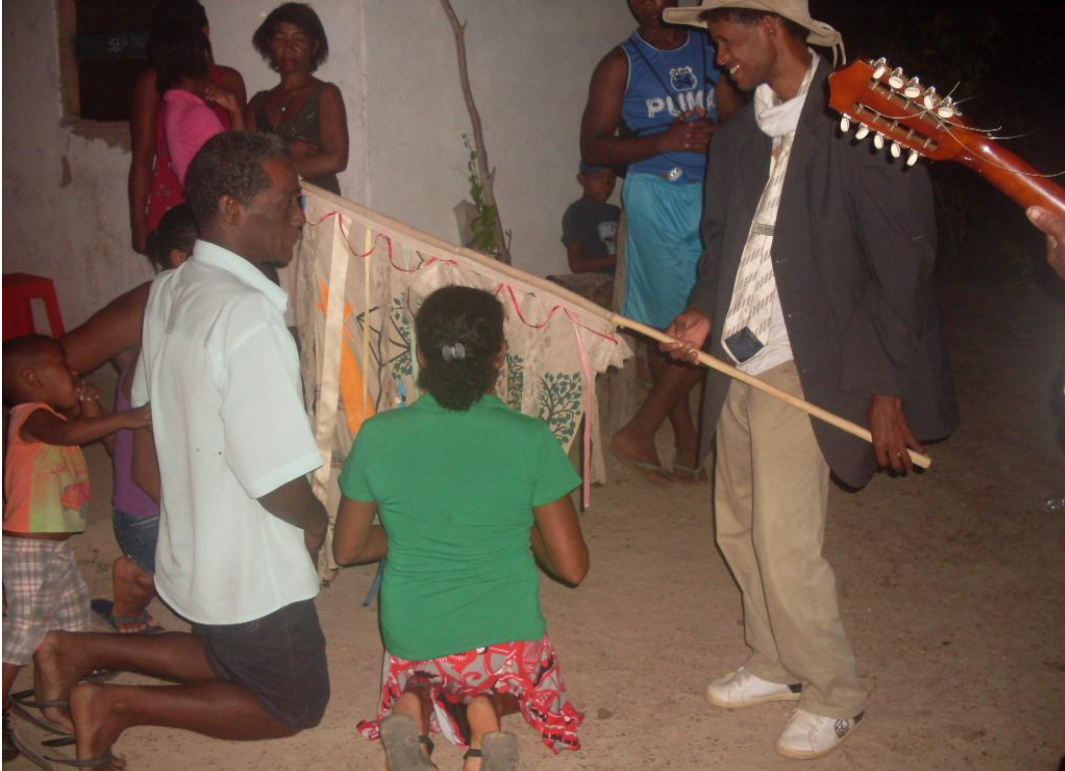
Imagem n. 30: Donos da casa recebendo os foliões Janeiro, 2013.