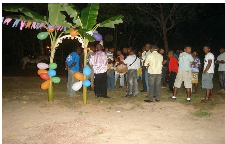
Imagem n. 19: Arco enfeitado na entrada da casa para receber os foliões Outubro, 2011.

O cruzeiro é um símbolo de devoção, já que se encontra no primeiro lugar onde os foliões param antes de adentrarem a casa. Neste local eles ficaram um período de tempo bastante prolongado e ali cantaram. É neste lugar que a pessoa que recebeu a graça se ajoelha em louvor e agradecimento a Deus pelo seu pedido ter sido alcançado.