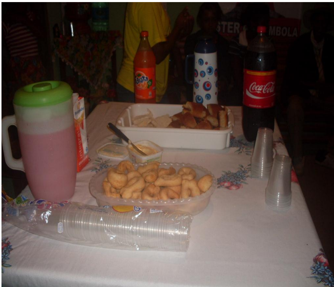
Imagem n. 38: Lanche para ofertar aos foliões e à comunidade Janeiro, 2013.