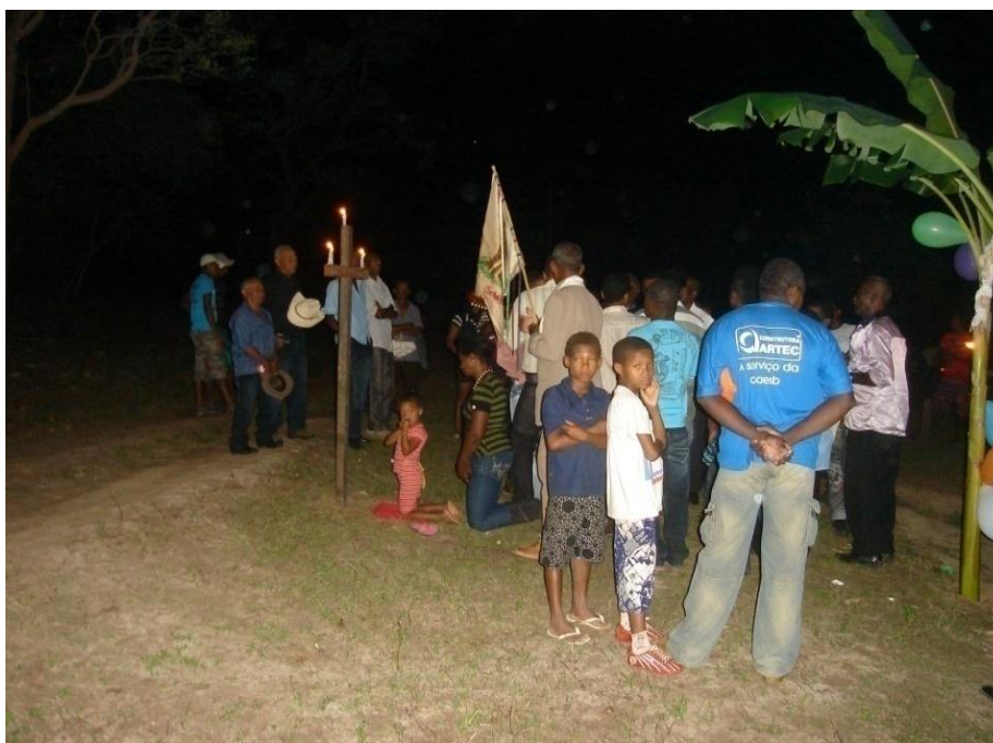
Imagem n. 18: Cruzeiro símbolo de devoção Autoria: Rosirene Campêlo dos Santos. Outubro, 2011.

O cruzeiro é um símbolo de devoção, já que se encontra no primeiro lugar onde os foliões param antes de adentrarem a casa. Neste local eles ficaram um período de tempo bastante prolongado e ali cantaram. É neste lugar que a pessoa que recebeu a graça se ajoelha em louvor e agradecimento a Deus pelo seu pedido ter sido alcançado.