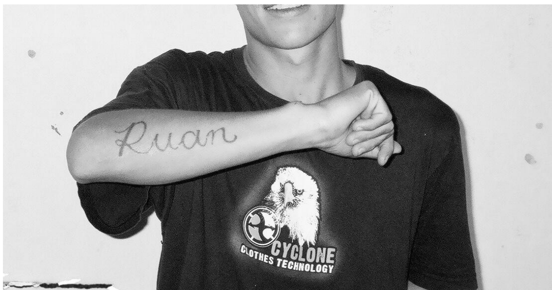
Adolescente com o nome do filho tatuado no braço