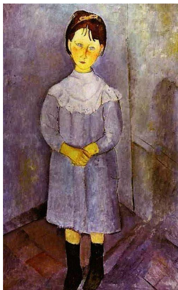
Figura 2 – Little girl in blue , paint by the Italian artist Amedeo Modigliani (1884-1920)