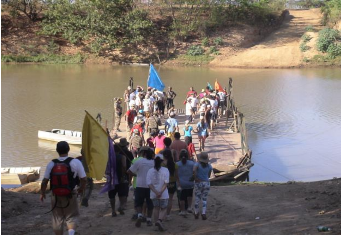
Figura 10: Caminhada – As bandeiras de cores diferentes representam a divisão dos alunos em equipes. Cada equipe é responsável por apresentar um relatório que contenha o registro da “memória” de cada dia da caminhada.