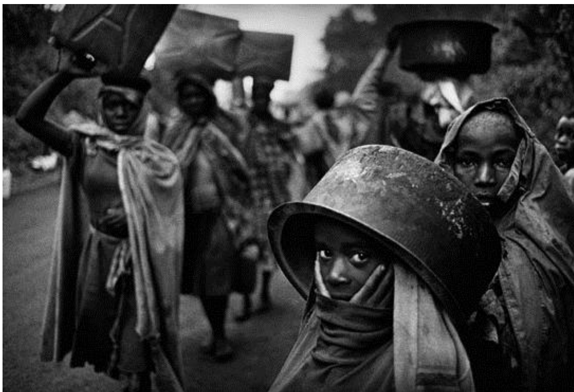
Figura 1: Fotografia de Sebastião Salgado exibida na exposição “Êxodos”. (Disponível em: http://www.amazonasimages.com/travaux-exodes )

A exposição era imensa, com fotos enormes expostas em muitas salas e que possuíam temáticas diversificadas relacionadas a êxodo, como: migração clandestina, guerras que provocavam o êxodo como as de Ruanda e Burundi e a guerra na Iugoslávia, travessias nas fronteiras dos Estados Unidos da América, entre outras.