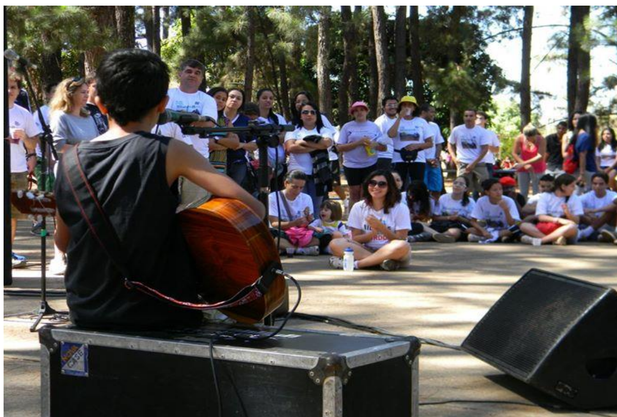
Figura 5: Sarau – Comemoração dos 11 anos do Projeto Re(vi)viendo Êxodos, 2012.