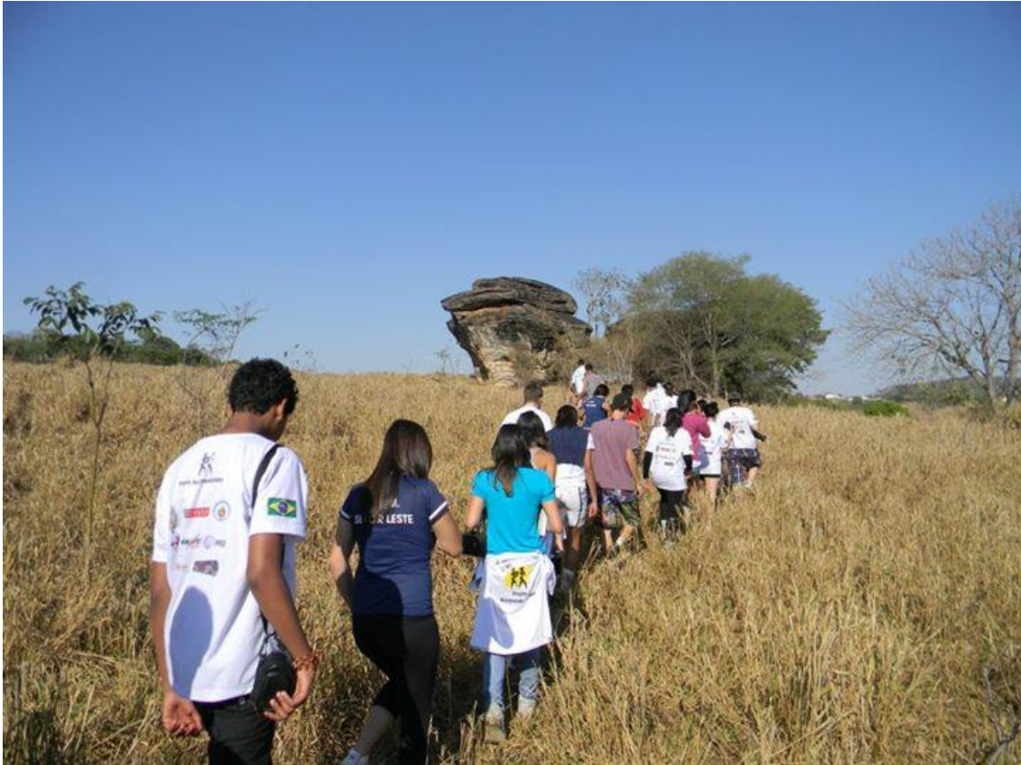
Figura 8: Pesquisa de campo à cidade de Santa Isabel (GO) – Fotografia tirada por monitores do Re(vi)vendo Êxodos, 2011.

Entende-se assim que, por ser flexível às mudanças necessárias, o Re(vi)vendo Êxodos é um projeto que está em constante amadurecimento.