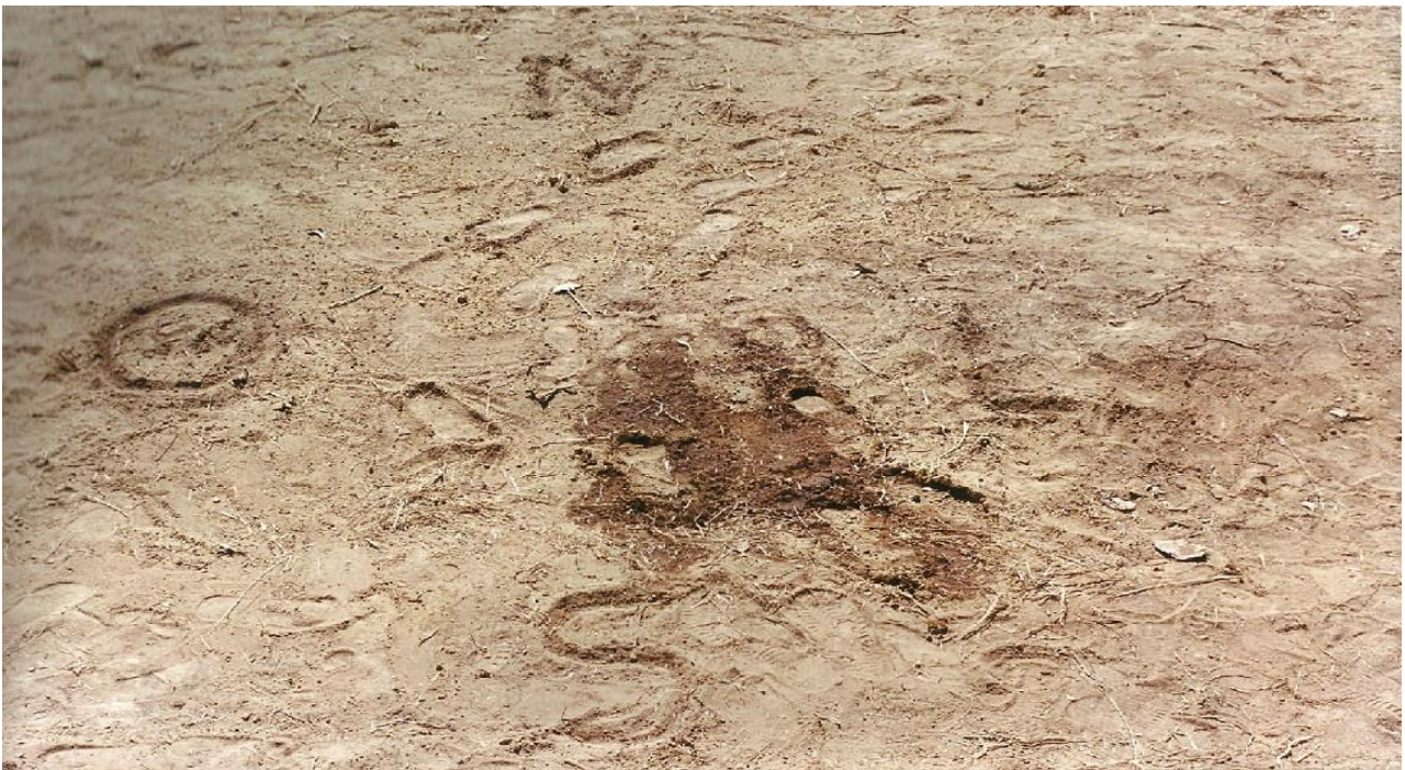
Figura 3: Imagem representativa dos pontos cardeais da Rosa dos Ventos. Capa do Cartaz de Divulgação e dos convites da primeira Exposição Re(vi)viendo Êxodos – Brasília 20 de junho de 2001.