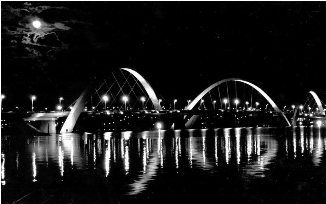
Figura 6: Vista noturna da Ponte JK – Lago Paranoá – Fotografia tirada por alunos do Re(vi)vendo Êxodos, 2013.