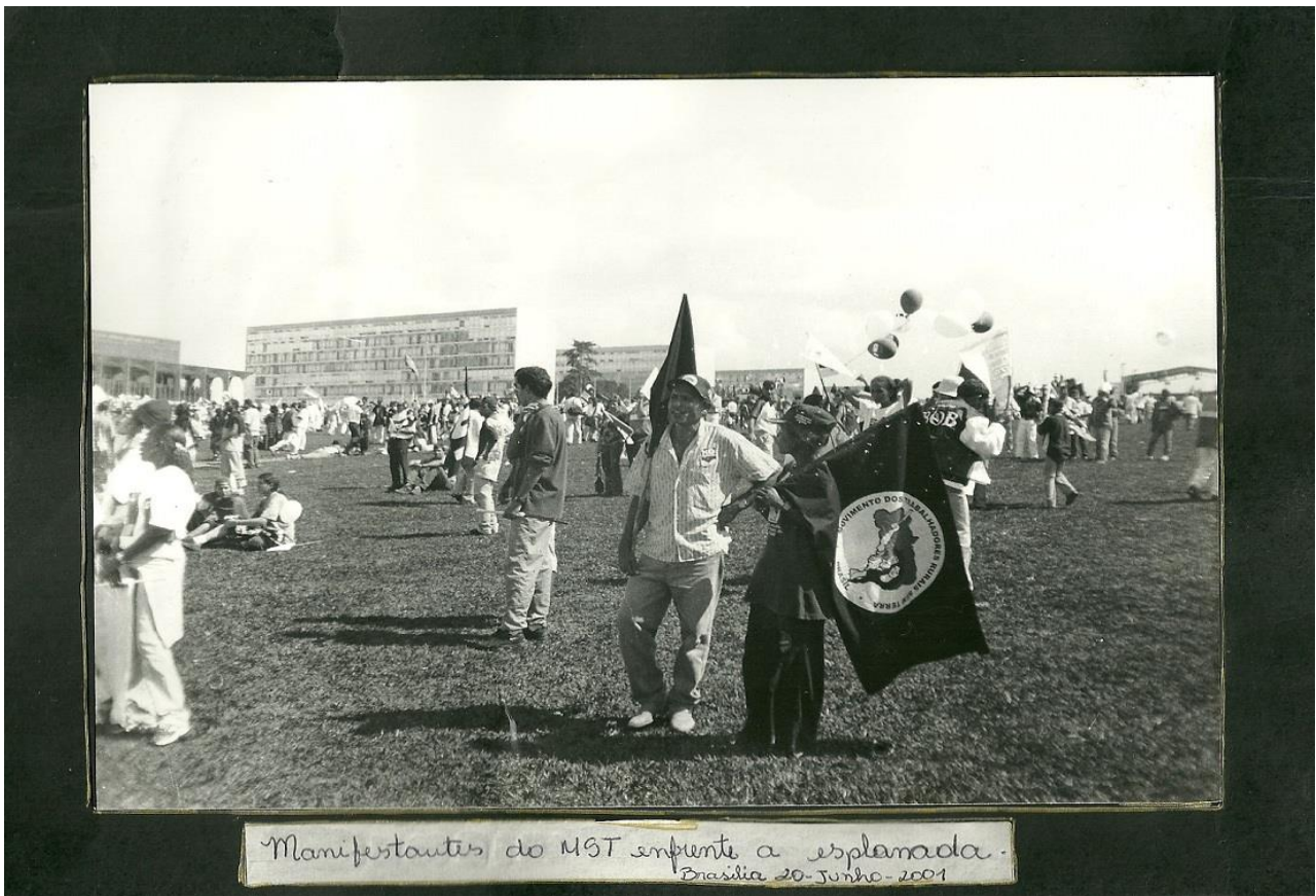
Figura 2: Manifestantes do MST (Movimento dos Sem Terra) em frente à Esplanada dos Ministérios – Brasília, 20 de junho de 2001.