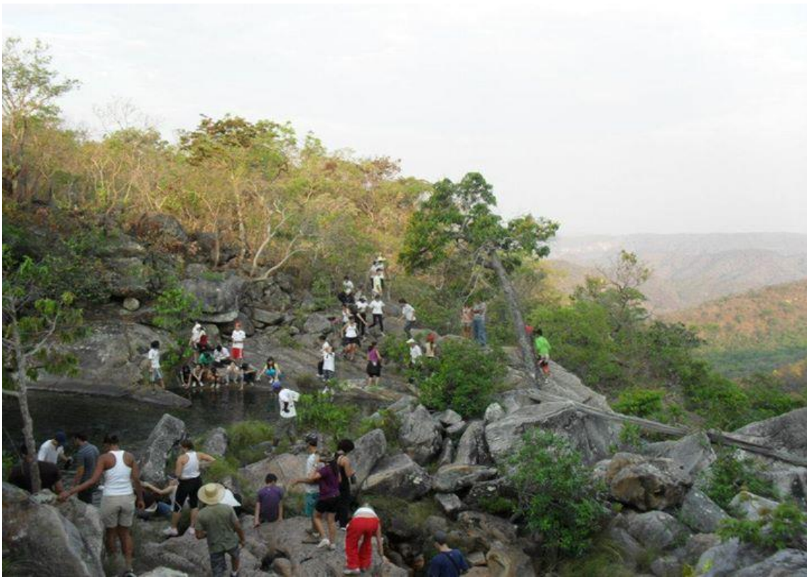
Figura 11: Caminhada 2010