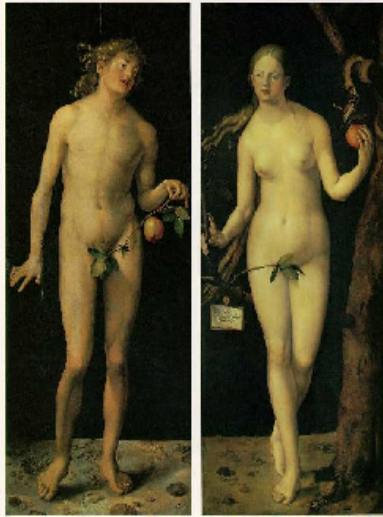
Figura 20: Adão e Eva