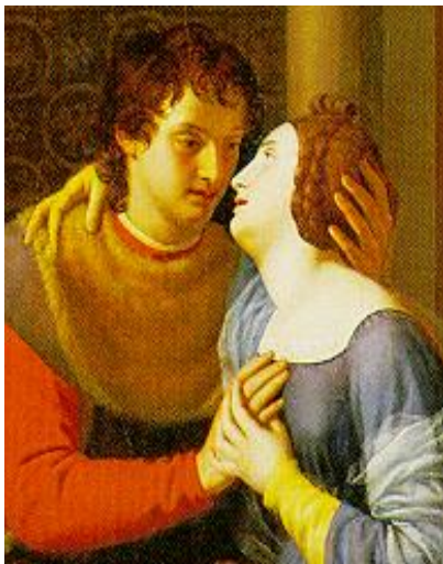
Figura 22: Abelardo e Heloisa