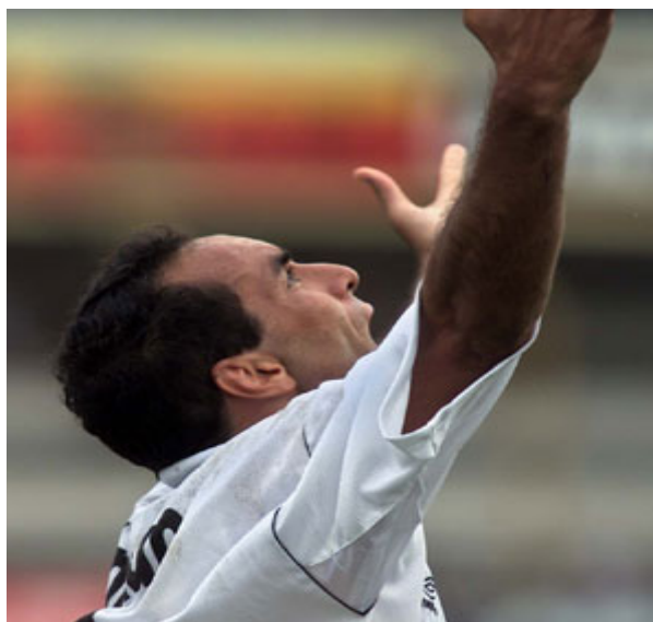
Figura 28: Jogador Edmundo