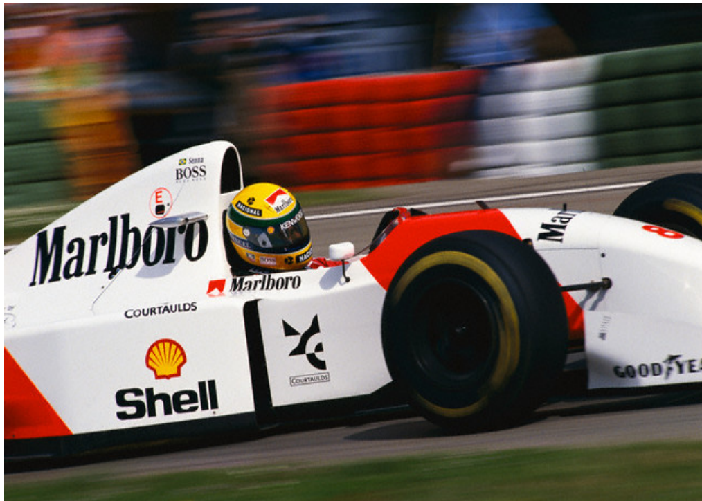
Figura 27 : Ayrton Senna