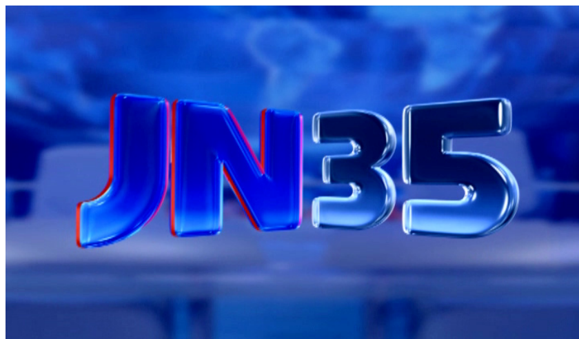
Figura 16 : Vinheta do JN

O propósito da vinheta de abertura do Jornal Nacional é convocar o público telespectador para sentar-se diante da televisão que o mundo vai entrar na sua sala a partir daquele momento.