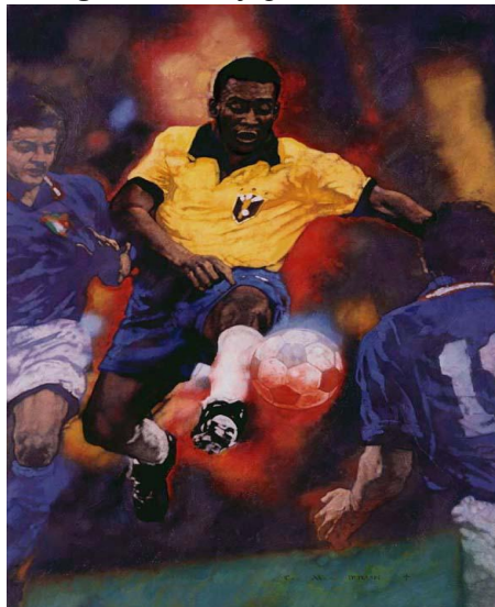
Figura 5: Pelé, jogador de futebol.