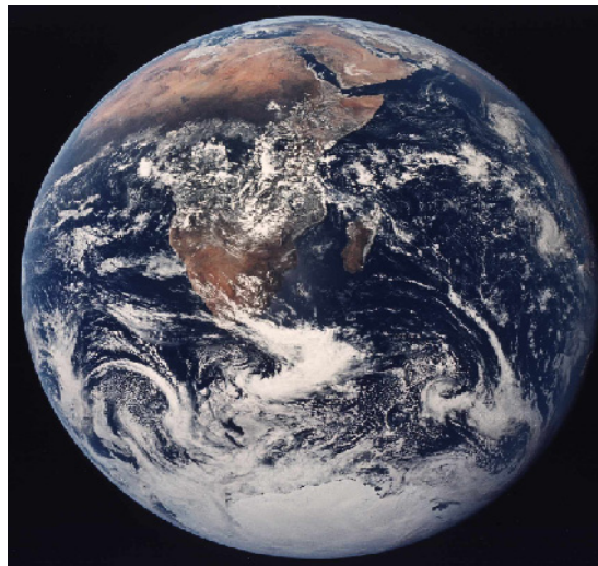
Figura 10: Globo terrestre