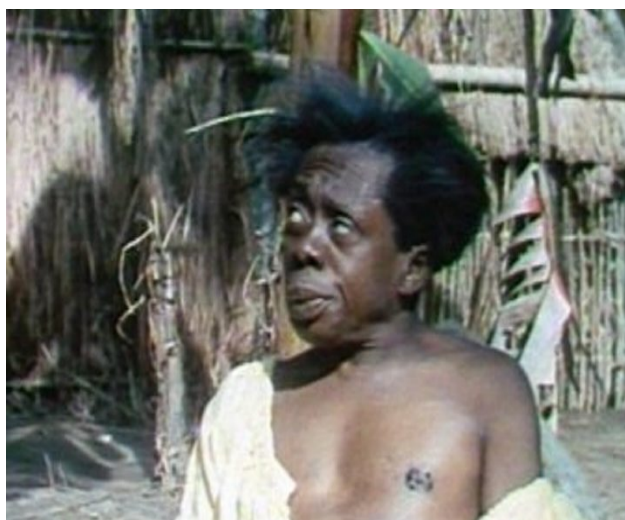
Figuras 31 – Macunaíma