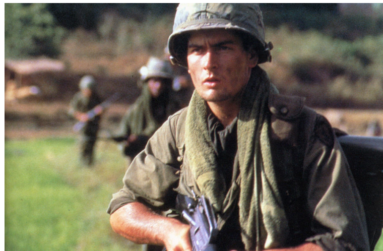
Figura 8: Charles Sheen Platoon

FONTE: www.gonemovies.com Acesso em 02 de dezembro de 2007.