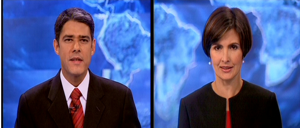
Figura 18: Apresentadores do JN