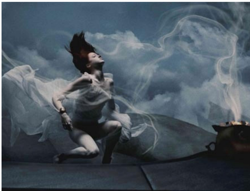
Figuras 32 – Oráculo do filme Trezentos