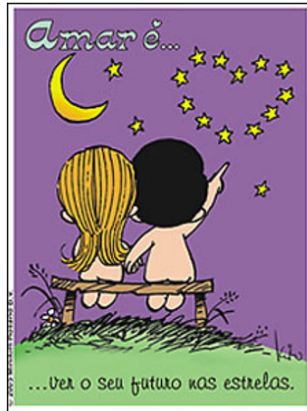
Figura 19 : Casal Amar é – álbum de figurinhas