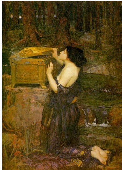
Figura 2 : Caixa de Pandora