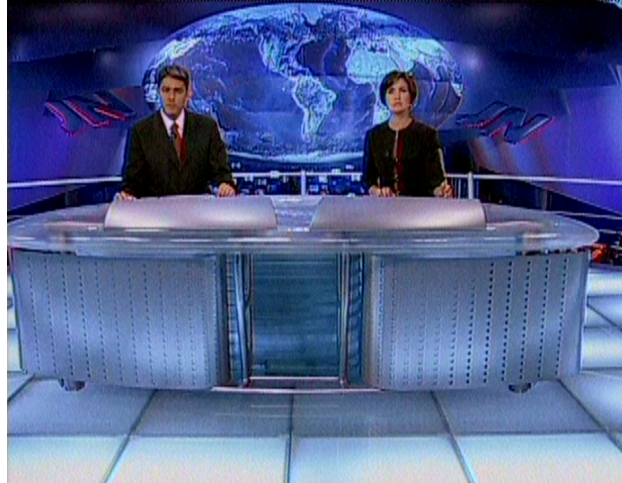
Figura 9: Apresentadores William Bonner e Fátima Bernardes