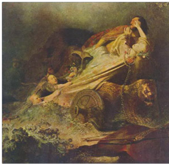
Figura 1: Em Linguagem e Mito, Ernst Cassirer

FONTE: monomito.wordpress.com. Acesso em 17 de dezembro de 2007.