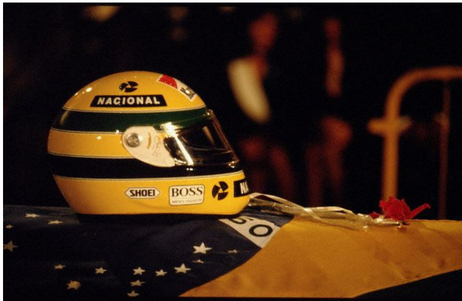
Figura 25: Velório Ayrton Senna