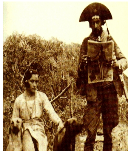
Figura 23: Lampião e Maria bonita