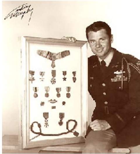
Figura 7: Audie Murphy