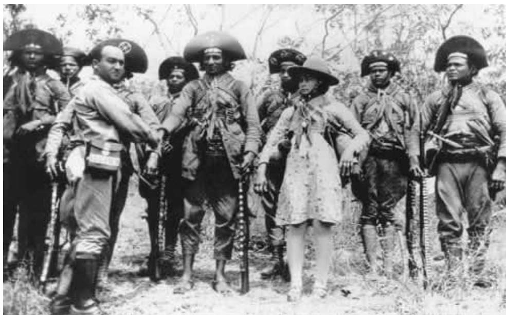
Figura 29 – Lampião, Maria Bonita e jagunços