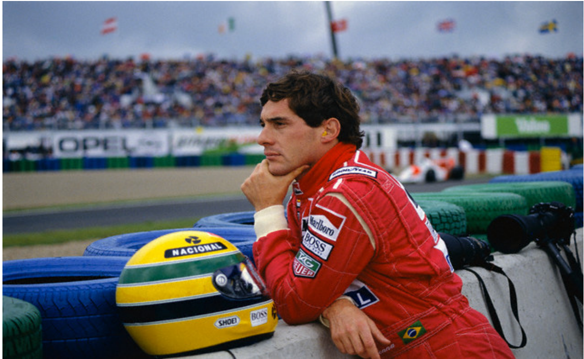
Figura 24: Ayrton Senna