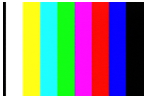
Figura 17 – Colorbar