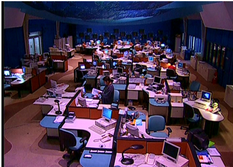
Figura 13: Redação do Jornal Nacional

Aqui podemos comparar a redação do jornal com a nave do filme Guerra nas Estrelas. Os tripulantes ajudam a comandar a nave, os jornalistas ajudam a colocar o jornal no ar; os comandantes são os apresentadores, o casal comanda a cabine. É uma guerra nas estrelas porque realmente é uma batalha travada pela audiência entre estrelas máximas do jornalismo na televisão.