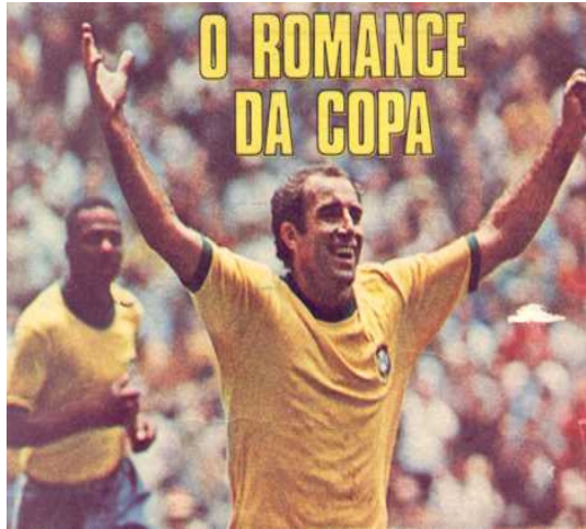
Figura 3: Gerson, jogador da seleção brasileira de 1970