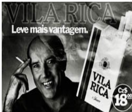
Figura 4: Gerson, propaganda de cigarros Vila Rica.