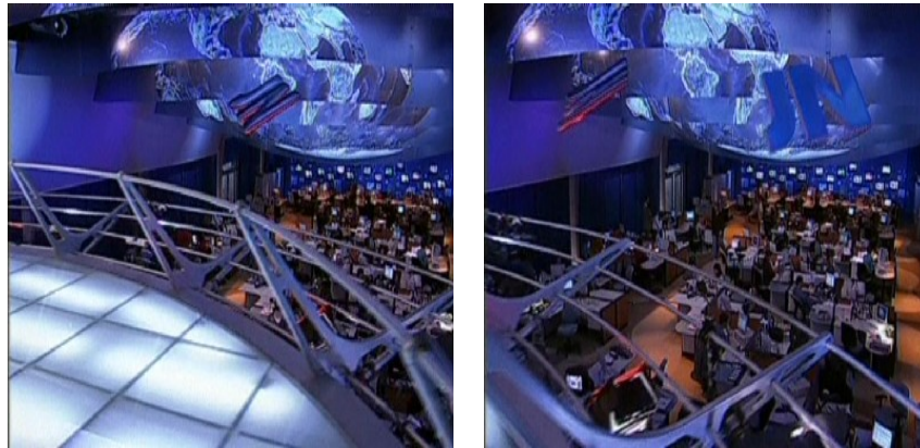
Figura 15: Imagens cenário, vinheta e redação