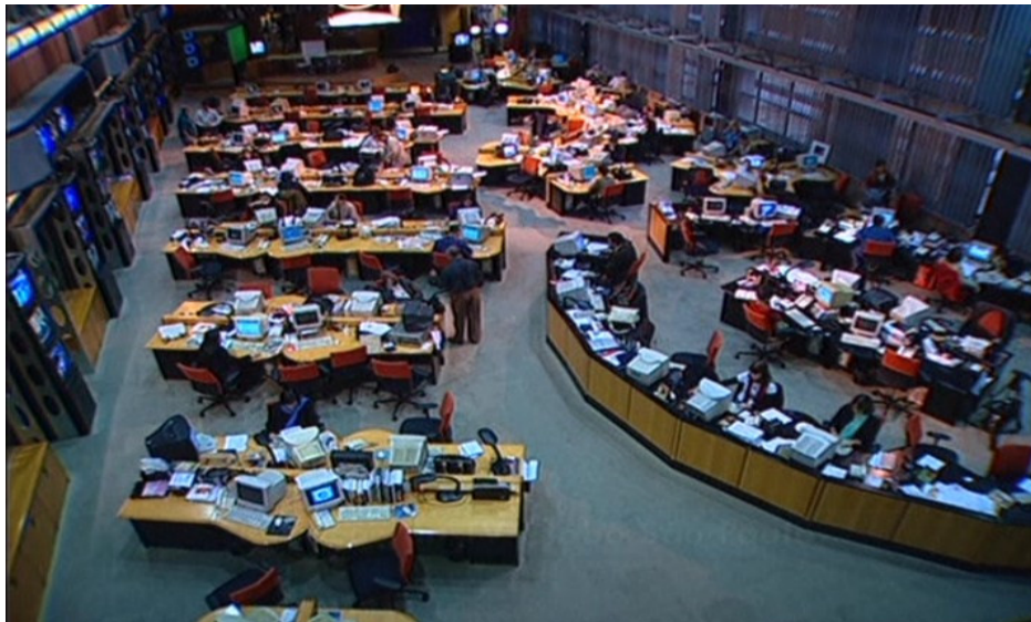
Figura 12 : Redação do Jornal Nacional

É espantoso observar em que grande medida o conforto do sentar-se desenvolveu-se inclusive entre grupos de homens em geral nada condescendentes. Fala-se aqui daqueles homens para os quais o dominar tornou-se uma segunda natureza e que, com freqüência, apreciam demonstrá-la de forma simbólica e abrandada.