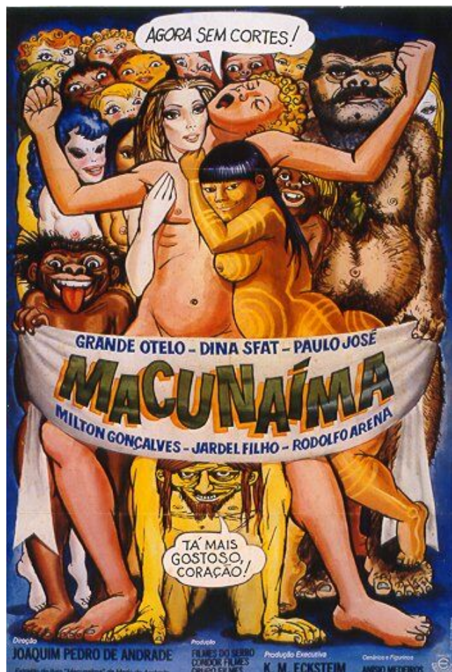
Figuras 30: Cartaz do filme Macunaíma

FONTE: www.adorocinemabrasileiro.com.br Acesso em 20 de dezembro de 2007.