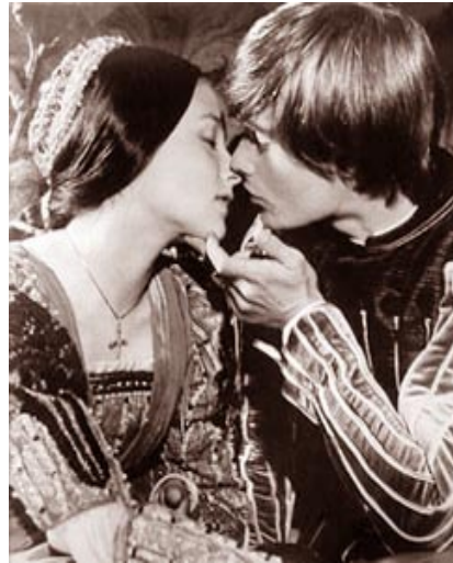
Figura 21: Romeu e Julieta