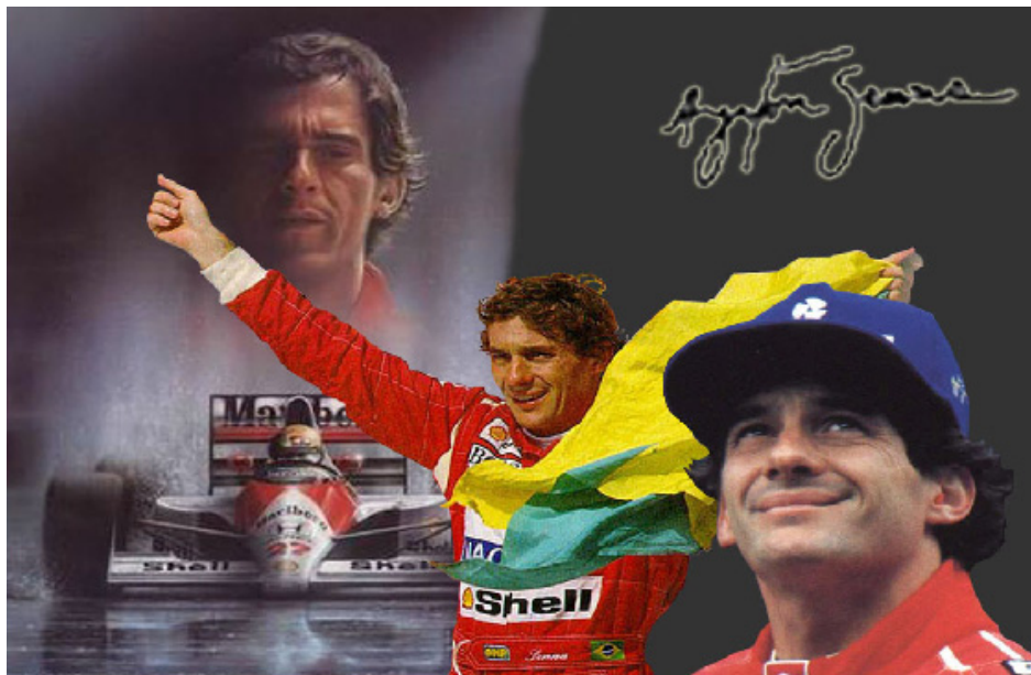
Figura 26: Ayrton Senna