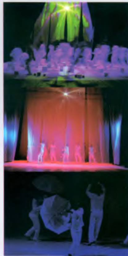
2 SACHS, Curt. História Universal de la Danza. Buenos Aires: Centurión, 1943, p. 72.

Muitos artistas da dança revolucionaram a percepção e a utilização dos espaços tradicionais nessa arte buscando uma unidade cênica, integrando o elemento Homem com o elemento Ambiente, numa síntese movente. Desde Isadora Duncan, a grande precursora da dança de origem teatral, e suas experimentações de novos espaços, e Rudolf Laban em sua análise do movimento na era industrial e Noverre 4 , o qual tendo criado o ballet d'action, solicitava aos seus discípulos que observassem nas ruas, nos mercados os