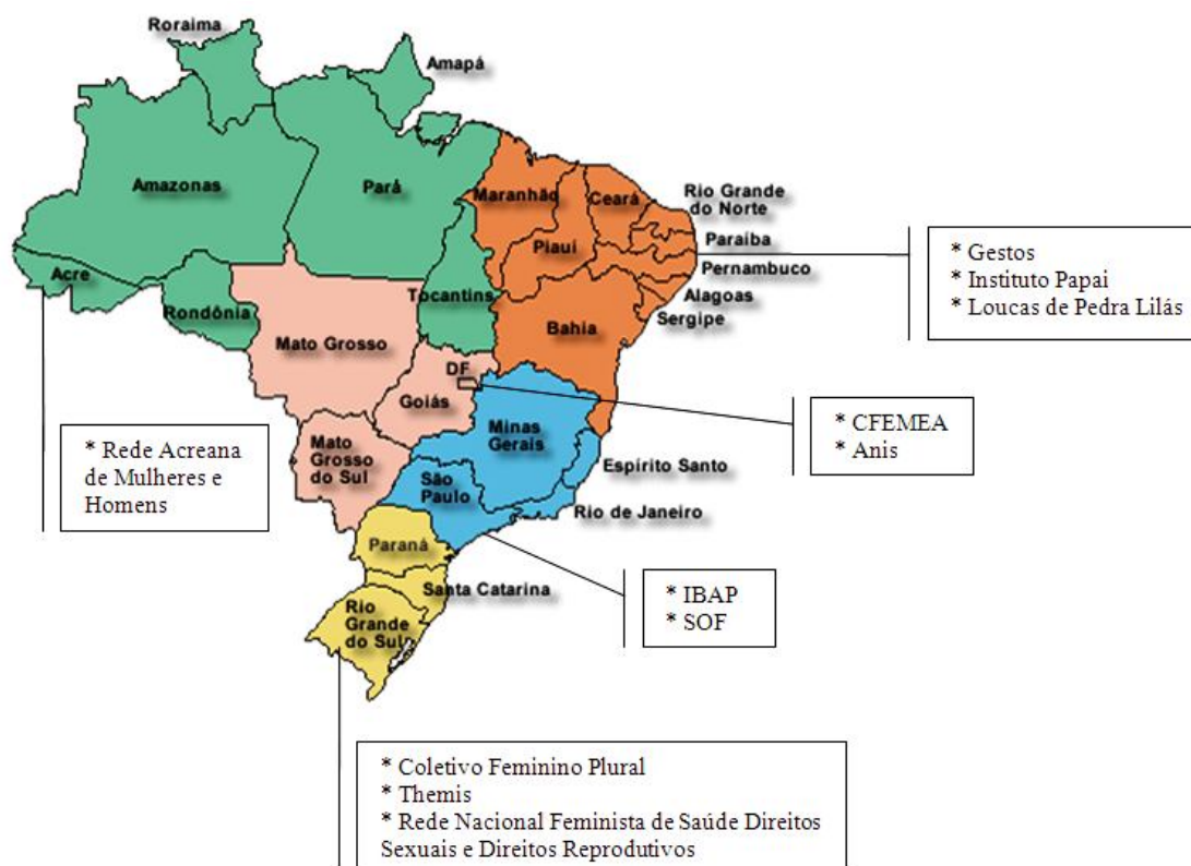
Figura 01 – ONGs entrevistadas

A distribuição das ONGs analisadas pode ser visualizada também na ilustração abaixo: