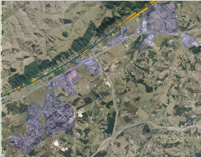
Figura 1: Simulação de Traçado Desviando de Manchas Urbanas (“Avoid Zones”)

comprimento do traçado ou então aumentar o custo por meio da solução em túnel que é uma obra de engenharia cara e complexa.