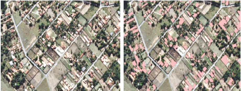
Figura 3: Exemplos de Polígonos de Área Construída.

Para o número de edificações atingidas foram determinados pontos sobre os telhados. Percebe-se que desta forma, o cálculo das áreas construídas, do número de edificações atingidas e das áreas de terra nua serão fornecidos automaticamente quando o sistema detectar a interceptação da faixa de domínio da ferrovia com os referidos polígonos, este fato facilita sobremaneira eventuais ajustes do traçado.