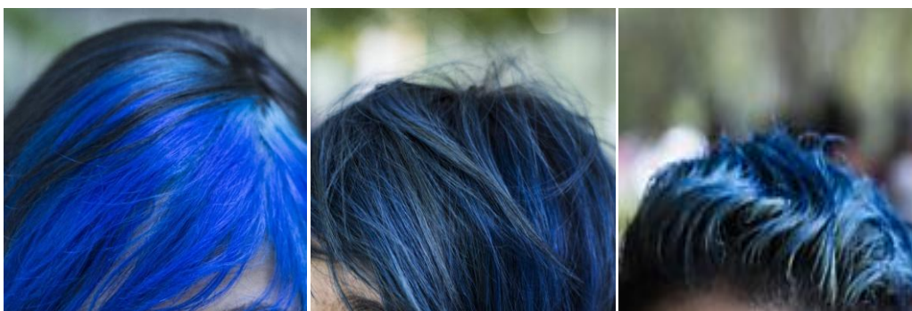
Meninas com cabelo inspirado na personagem Emma

É comum, ainda hoje, três anos depois que o filme foi lançado, encontrar adolescentes em escolas de ensino médio, universidades e outros ambientes, com os cabelos tingidos de azul. Várias delas ainda justificam suas escolhas embasadas na identificação com a personagem.