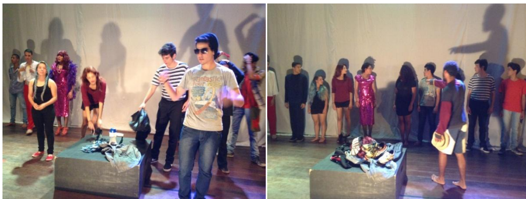
Espectáculo Dispa-se . Momento de transição das personagens para os atores