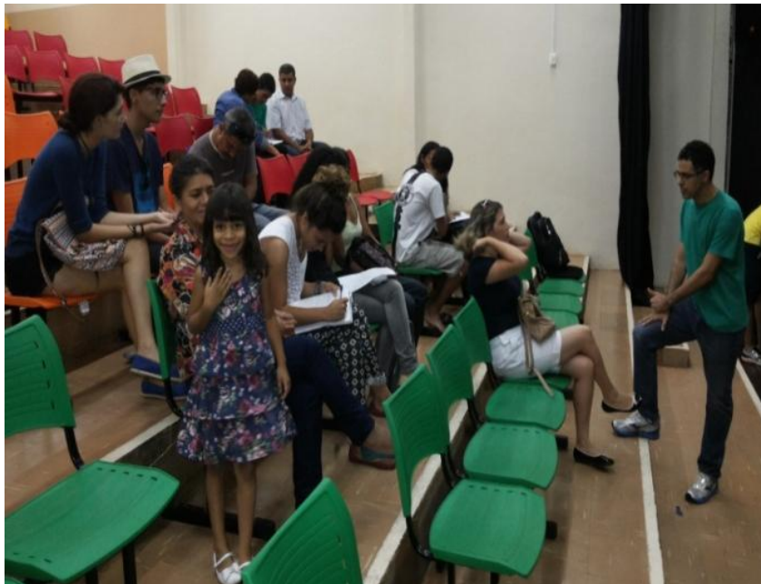
Reunião com os alunos e os seus responsáveis

Era visível o interesse de cada adolescente em fazer parte do projeto. Durante a reunião, eles se mostraram entusiasmados, cheios de desejos e ansiosos pelo início da etapa seguinte. Embora ainda não existisse uma relação mais íntima e próxima entre eles, pois eram alunos de anos e turmas diferentes nas escolas de origem, havia algo na Prévia que os colocava no mesmo lugar e que os caracterizava como grupo. Penso que era o desejo de integrar a oficina e de ter acesso ao ensino do teatro sem os moldes que estavam acostumados em suas escolas.