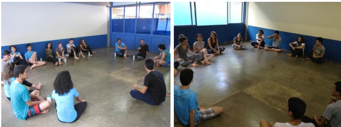
Rodas de conversa

As rodas de conversa, em conformidade com Warschauer (2004) e os autores que utilizo para embasar a pesquisa-ação, garantiram a participação ativa dos adolescentes e foram ao encontro do pensamento de Toledo & Jacobi (2013), que asseguram que esse tipo de pesquisa proporciona uma inter-relação entre as intervenções dos sujeitos e a produção de conhecimento. Esses autores, assim como Franco, destacam que há, nessa metodologia, uma relação imbricada entre pesquisa e ação e que, ao investigar e agir, os estudiosos e os grupos sociais desenvolvem um processo de aprendizagem coletiva, já que os resultados encontrados durante a pesquisa oferecem novos ensinamentos a todos.