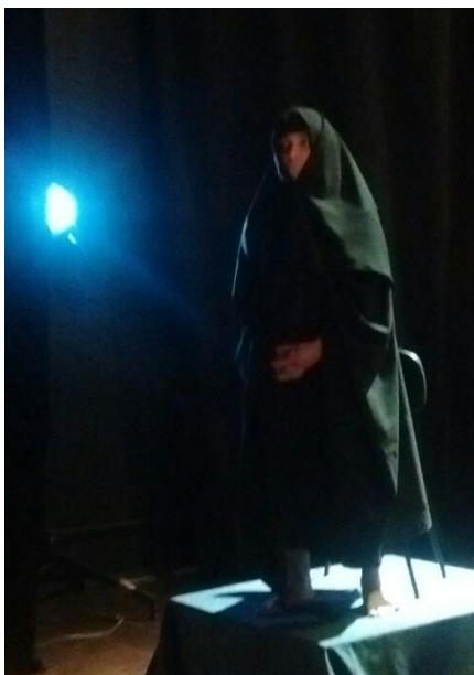
Narrador – Cena do espetáculo Dispa-se

Quando a personagem foi estruturada para ganhar vida no espetáculo final, ela se tornou o elo entre as cenas dos colegas ao assumir a função de narrador. Aliás, este foi o nome dado a ela. Como o adolescente estava um pouco tenso com a ideia de se colocar diante uma plateia, mas não queria ficar sem entrar em cena, a composição estética da personagem Narrador foi pensada de forma que o figurino usado por ela quase a cobrisse completamente. Apenas alguns pedaços do seu corpo ficavam visíveis.