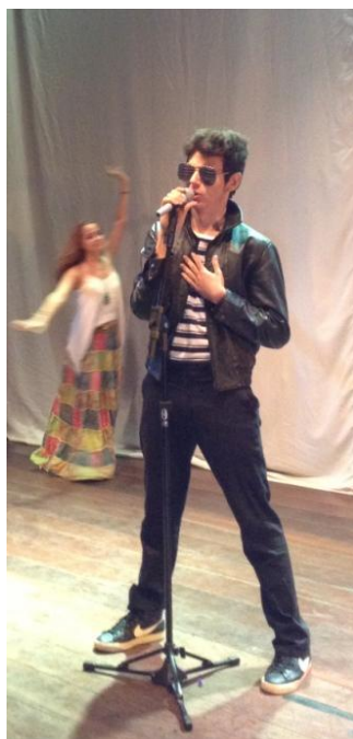
Ensaio do espetáculo Dispa-se . Personagem Hugo Presley

→ Hugo Presley : A personagem Hugo Presley foi inspirada no músico e ator norte-americano Elvis Presley . Ela surgiu como uma possibilidade de abordar o quanto as pessoas se permitem serem moldadas por pessoas famosas, sobretudo, quando estas são seus ídolos. Além disso, a personagem evidencia a quantidade de falas e atitudes que são reproduzidas como sendo verdadeiras e necessárias às pessoas quando são pronunciadas por indivíduos públicos. Fã assumido e cover do cantor Michael Jackson , o aluno que compôs a personagem agregou nela elementos da sua história pessoal.