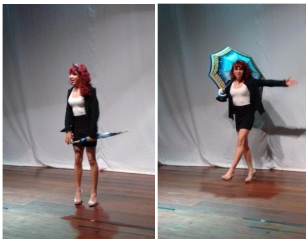
Segunda apresentação da cena individual quem sou eu? (Aluno AA).

Ao término dessa apresentação, esse aluno disse que a oficina de teatro, embora estivesse no início, estava dando a ele a oportunidade de se mostrar por inteiro e da forma como se sentia confortável, e que isso o deixava feliz. Ao reapresentar a cena, o aluno criou uma pequena história para uma personagem masculina que se travestia de mulher. Ali, ele a mostrou como uma cantora, uma diva no universo LGBTT (lésbicas, gays, bissexuais, travestis e transexuais), o que para ele simbolizava algo bom. Mas ao mesmo tempo, sua personagem falava de preconceitos, de agressões físicas e verbais e de uma sociedade que tende a reprimir aqueles que não se enquadram num padrão ideal.