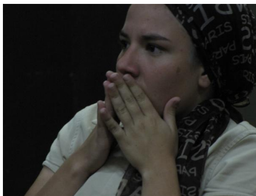
Personagem Mãe – Fotografia: Ricardo Cruccioli

A cena criada por eles se completa com a personagem Mãe , que foi pensada e materializada com base nas personalidades das genitoras dos colegas. Essa personagem é um exemplo de como uma pessoa contribui com a formação das identidades sociais de outras. No texto final, a personagem Mãe , aparentemente não intencional, interfere, de certa forma, segundo os alunos, negativamente na identidade adolescente dos dois filhos.