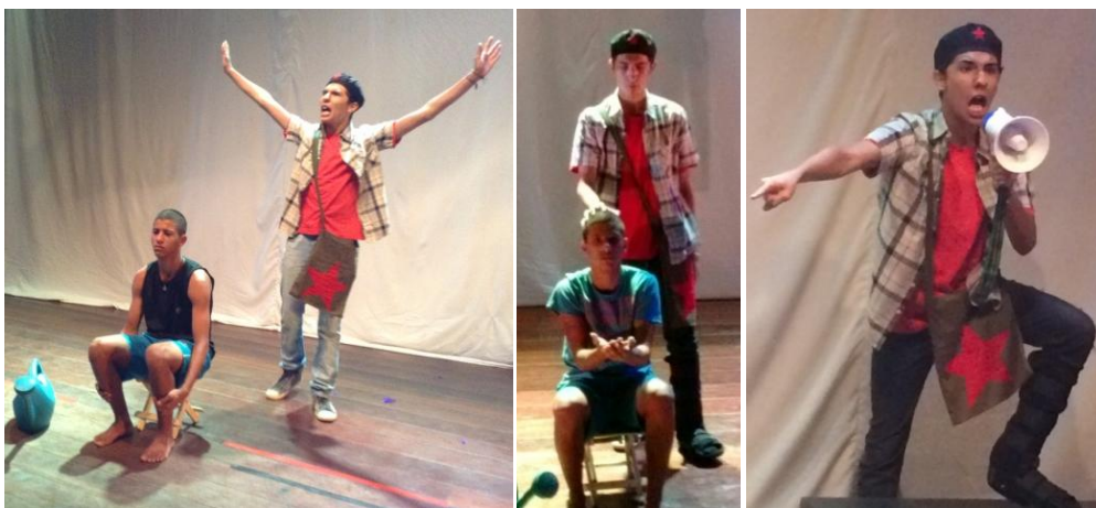
Personagens Menino e Militante em ensaios do espetáculo Dispa-se

Já o Militante traça um figurino que faz referência, de forma estereotipada, aos “revolucionários”, aqueles que lutam e discursam em prol da coletividade. Essa personagem representa o herói do adolescente que agrega em si a coragem de dizer o que pensa mesmo quando é reprimido. A opção dos discentes por juntar as duas personagens numa cena se deu por eles defenderem que uma depende da outra.