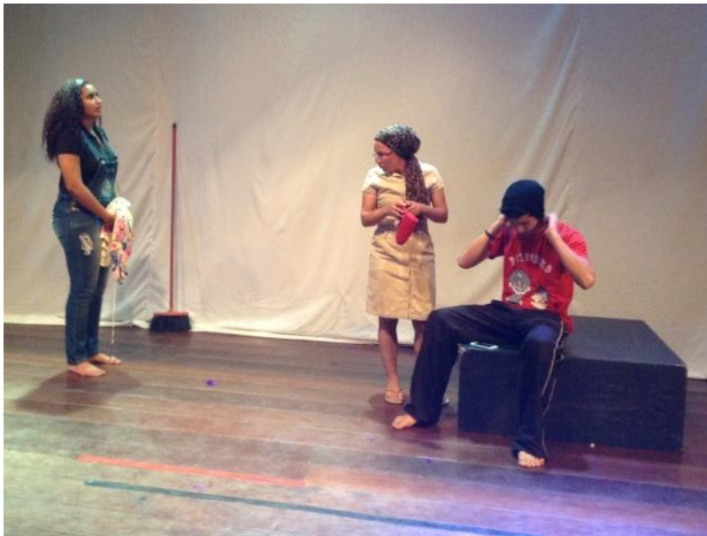
Personagens Nina , Mãe e Gustavo em ensaio do espetáculo Dispa-se

Já o aluno que deu vida à personagem Gustavo apresentou uma situação semelhante, mas destacou o quanto se aproveitava do seu gênero para ter tudo o que quisesse dentro de casa: de um copo d'água à cama arrumada. Ele frisou que foi educado, junto à irmã, de forma machista por sua mãe, que sempre reforçou a ideia de que existem tarefas domésticas que são exclusivamente femininas. Para esse aluno, isso contribuía para que ele tivesse mais liberdade que a irmã para ir a festas, sair com amigos e namorar.