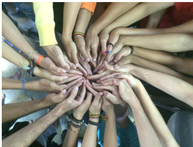
Cumprimento coletivo

O 4º momento, Durante a aula/2ª parte , era a ocasião em que fazíamos nossas rodas de conversa e o nosso ritual de encerramento das atividades diárias. Esse ritual consistia na formação de um círculo, com os presentes posicionados de frente um para o outro, com as mãos direitas apontadas em direção ao centro da roda, tendo as pontas dos dedos grudadas nos dedos dos colegas. Depois disso, dobrávamos a mão para a direita, formando uma espécie de conchinha, criando assim, um cumprimento coletivo.