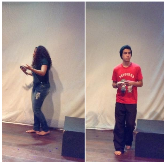
Personagens Nina e Gustavo em ensaio do espetáculo Dispa-se

tratamento diferenciado dado a moças que, cotidianamente, são castradas do direito de irem e virem, de verbalizarem seus pensamentos e de terem algumas atitudes por serem mulheres. Já o Gustavo , é um rapaz que se mostra preguiçoso, mimado e que investe o seu tempo em jogos e festas. As duas personagens vestem figurinos que retratam quaisquer adolescentes.