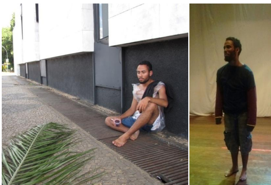
Personagem Mendigo na rua e em cena no espetáculo Dispa-se