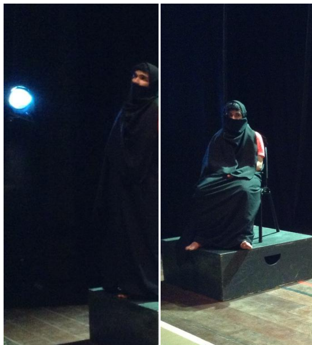
Personagem Narrador

→ Narrador: Esteticamente, ela traja uma espécie de burca, vestimenta que cobre todo o corpo. A leitura que se faz dessa personagem e do seu figurino e que não está associada de fato à burca usada por mulheres afegãs, é que ali há um ser ainda não definido, mas que possui uma história e referências que, certamente, serão somadas a outras na (re) construção das suas identidades. Essa personagem pode ser vista como a representação do adolescente, que, nesse período entre a infância e a vida adulta, cobre o seu corpo, nem sempre de forma literal, enquanto se “alimenta” do que lhe chega das suas alteridades até que compreenda as suas identidades, para, então, poder despir-se das “vestimentas” que não sejam necessárias.