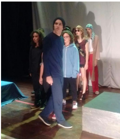
Personagem Homem , à frente. Apresentação do espetáculo Dispa-se