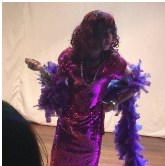
Drag Queen – Cena do espetáculo Dispa-se

para outra pessoa ou que criássemos uma nova personagem, mas não fui atendido. O estudante afirmou que ela representava parte dele e que não gostaria que um colega vivenciasse aquilo, que era importante para ele naquele instante. Depois de muitas conversas com esse estudante e de me colocar à disposição para dialogar com os seus responsáveis, optamos por convidá-los à apresentação do espetáculo. A cena, durante o processo de escrita dramaturgica, foi adaptada pelo adolescente e seus colegas para que a personagem se mostrasse à plateia como uma Drag Queen .