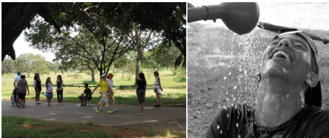
Exercício cênico realizado no Parque da Cidade - Fotografias: Hugo de Freitas

Ao executar o exercício no Parque da Cidade, o aluno recebeu uma sucessão de nãos de pessoas que se exercitavam e/ou simplesmente passeavam por lá. Em determinado momento, quando uma senhora se recusou a regá-lo, a colega que o acompanhava a questionou, perguntando se ela sabia o porquê de ele (o aluno) não crescer. Ao receber não como resposta, ela afirmou: “ porque ninguém joga água nele. Porque as pessoas fingem que ele não existe. Não doam um tempo para regá-lo. Ele quer crescer, sabia? ”. Ao escutar isso, a senhora, aparentemente constrangida, mas encantada com o que havia acontecido, segurou o regador e derramou água sobre o aluno.