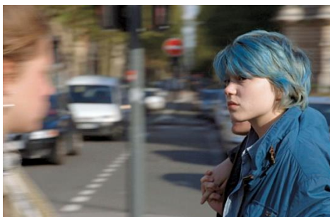
Emma – Azul é a cor mais quente

A personagem Emma, do filme Azul é a cor mais quente (2013), do diretor franco-tunisino, Abdellatif Kechiche, é um exemplo disso. Moças de diferentes lugares do planeta pintaram seus cabelos de azul, desde que o filme foi lançado, por conta da identificação com a personagem em questão. O jornal Folha de São Paulo , de 11/05/2014, publicou uma matéria intitulada Inspiradas em filme, meninas pintam cabelo de azul para achar parceiras para falar sobre o assunto.