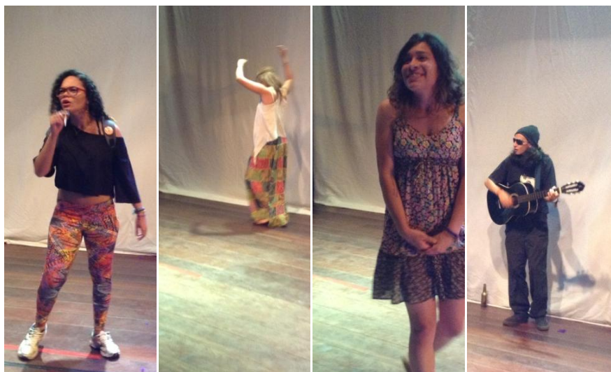
Personagens Val, Lu, Mari e Pepê em cena no espetáculo Dispa-se

→ Val, Lu, Mari e Pepê: Essas quatro personagens surgiram de pesquisas sobre o universo adolescente e de cenas elaboradas e apresentadas a partir do questionamento O que te modela? Lu, Val, Mari e Pedro são personagens adolescentes que abordam sobre família, sexo, drogas, ídolos, modismos, amizades e sobre a própria adolescência. São personagens com personalidades, vestimentas e atitudes diferentes, mas que possuem em comum a identidade adolescente.