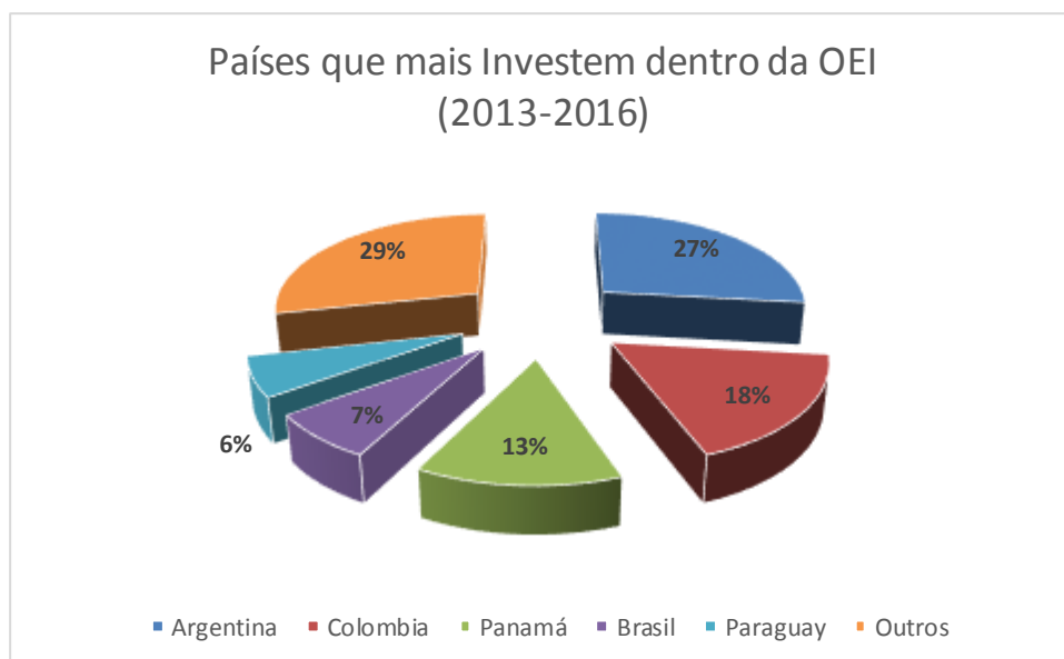
Gráfico 02 - Participação (%) no volume investido com programas de cooperação na OEI.

O Brasil representa uma fatia de 7% do montante de recursos realizados através de programas de cooperação técnica dentro da OEI dentre os anos de 2013 a 2016.