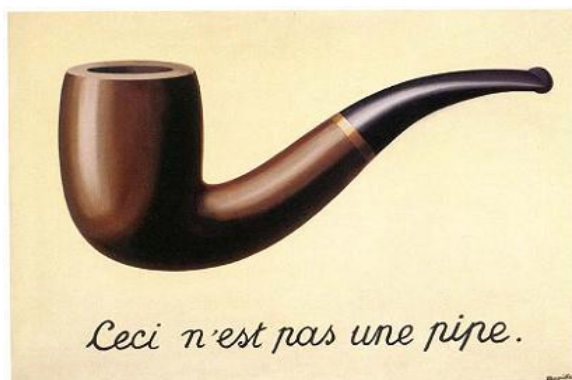
Diagrama 1. Isso não é um cachimbo por Magritte

dados. Ele não funciona para representar um mundo pré-existente, mas para produzir uma análise e interpretação provisória sobre fatos e objetos de pesquisa. Passa a ser mais uma possibilidade de produção do que de reprodução. Trata-se de um desenho gráfico que descreve, ou ainda explica, mais do que representa relações estratégicas entre objetos ou pessoas. Assim, são construções inéditas sobre um determinado campo problemático investigado, tal como aparece na obra de Magritte “Isso não é um cachimbo”, abaixo: