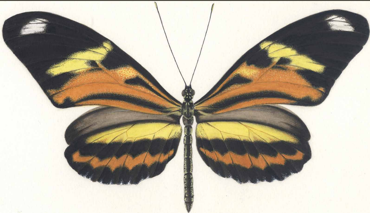
Heliconius ethilla Godart 1819

Esta borboleta da família Nymphalidae é encontrada do Pananá ao sul do Brasil. Seu hábitat são as margens de florestas. Tem cerca de 60 a 70 mm de envergadura de asa. Suas larvas alimentam-se de espécies de Passiflora. Os adultos apresentam vôo lento, normalmente perto do solo, e alimentam-se em plantas herbáceas, especialmente as com flores avermelhadas como o Cambará.