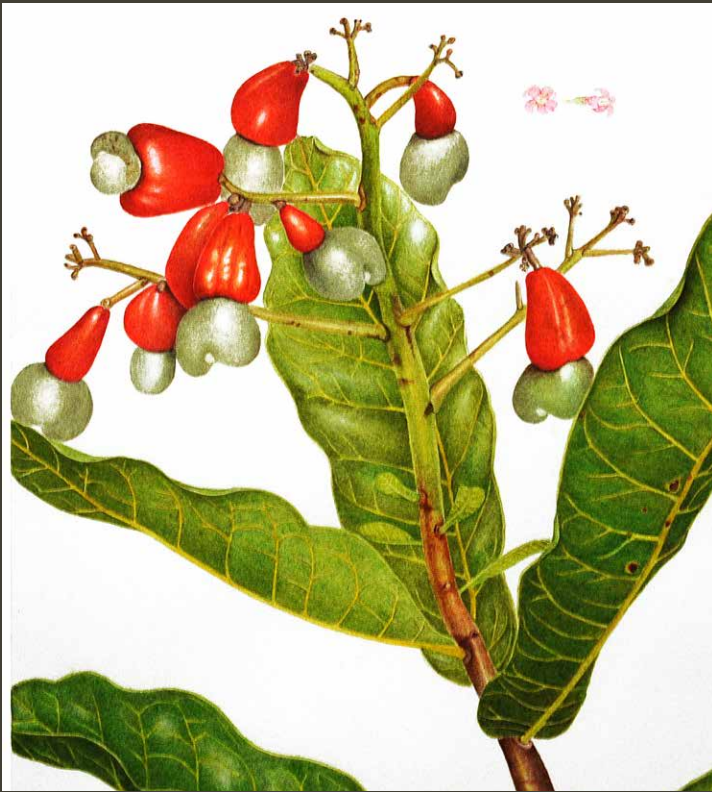
Anacardium humile A.St.-Hil. 1831

O cajuzinho-do-cerrado é uma arbustiva, nativa do Brasil, com ocorrência comum em todo o Bioma Cerrado. Pode atingir 80 cm. O fruto verdadeiro (castanha) e o pseudo fruto (cajuzinho) podem ser consumidos e são muito utilizados na confecção de doces e compotas