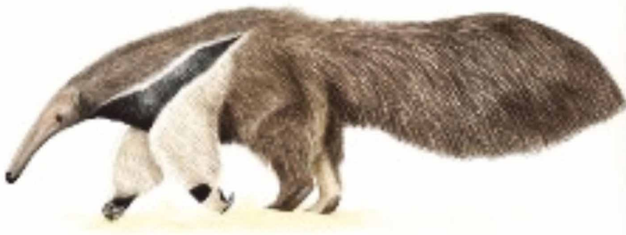
Myrmecophaga tridactyla Linnaeus 1758

O tamanduá bandeira é um mamífero terrestre, encontrado desde a América Central até o do Brasil. Pode chegar a 2,1 metros de comprimento e 41 kg. Seu hábitat varia das savanas às florestas. É característico o aparelho bucal, o qual é adaptado a sua dieta especializada em formigas e cupins. É uma espécie considerada como “vulnerável” pela União Internacional para a Conservação da Natureza e dos Recursos Naturais (IUCN).