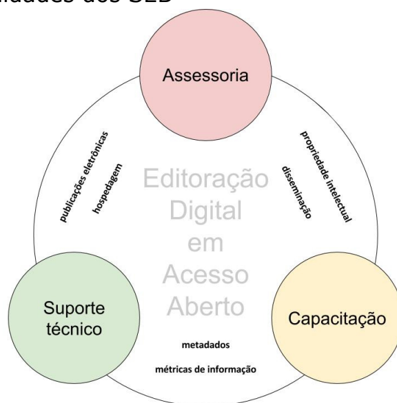
Figura 1 - Modalidades dos SEB