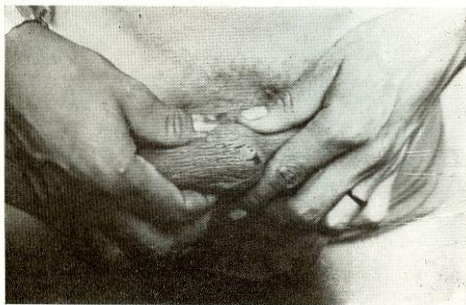
Fig. 1 — Furunculose no escroto e dedo na mão direita. Grupo Suruí, janeiro/1980

sões em diferentes locais do corpo simultaneamente (Fig. 1). Em todos os pacientes observados, os furúnculos apresentavam-se de for-