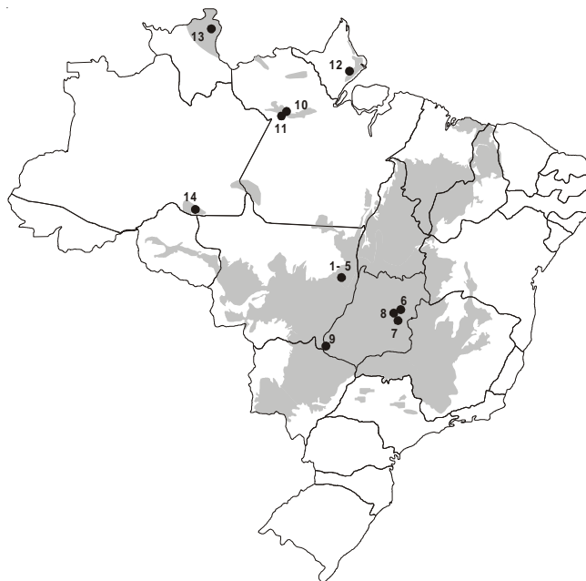
Figura 1. Áreas utilizadas no presente estudo. Cerrado sensu stricto do Brasil Central: 1-5. Nova Xavantina/Cachimbo (MT-1 a MT-5); 6. Estação Ecológica de Águas Emendadas (EEAE/DF); 7. Área de Proteção Ambiental Gama-Cabeça do Veado (APA/DF); 8. Parque Nacional de Brasília (PNB/DF) e 9. Parque Nacional de Emas (EMAS /GO). Savanas amazônicas: 10. Alter do Chão 1; 11. Alter do Chão 2; 12. Amapá; 13. Roraima e 14. Humaitá. Em cinza: distribuição do Bioma Cerrado.

As síndromes de dispersão seguiram a classificação de van der Pijl (1982). Este autor classificou as espécies em três grandes categorias: zoocórica – espécie dispersa por animais; anemocórica – espécie dispersa pelo vento;