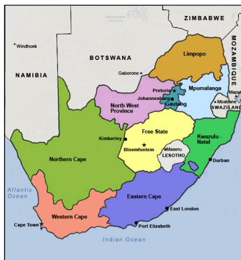
Mapa 2 – Divisão política da África do Sul após 1994