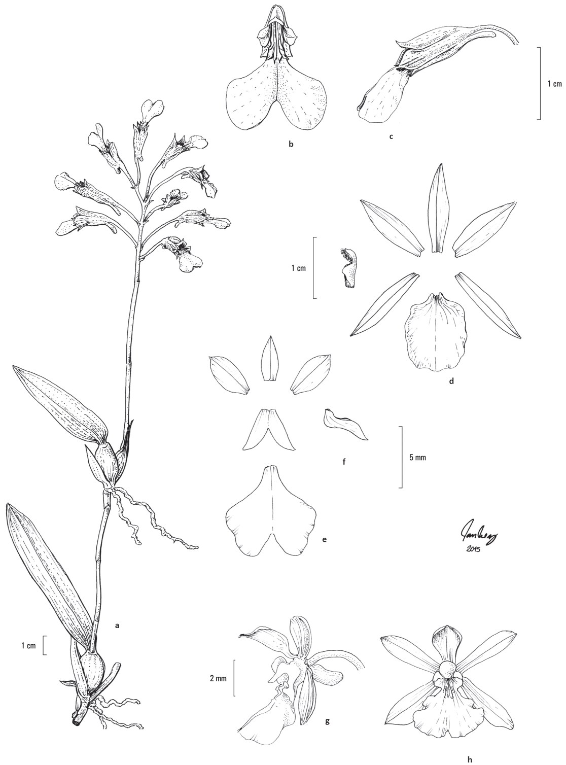
Figura 3. a-c. Rodriguezia decora . a. Hábito. b. Flor, frontal. c. Flor, lateral, sépalos formando um mento. d. Trichopilia brasiliensis . Flor aberta e coluna. e-f. Ionopsis utricularioides . e. Flor aberta. f. Sépalos laterais, formando pequeno mento (vista lateral). g-h. Trichocentrum albococcineum . g. Flor vista lateral, presença do esporão. h. Flor. (a-c. Bianchetti 853; Santos 1769; e-f. Walter 4235; g-h. Lima 55).