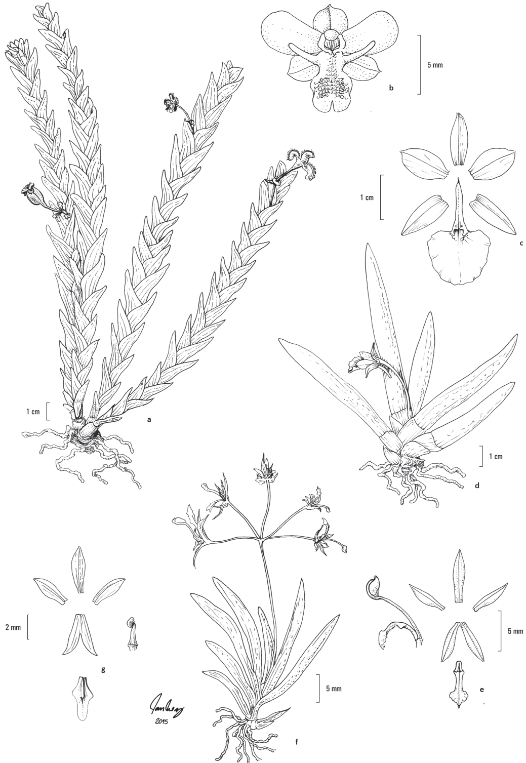
Figura 2. a-b. Lockhartia goyazensis . a. Hábito. b. Flor. c-d. Plectrophora edwallii . c. Flor aberta. d. Hábito. e-f. Macroclinium wulschlaegelianum . e. Flor aberta e coluna. f. Hábito. g. Notylia lyrata . Flor aberta e coluna. (a-b. Pereira 2271; c-d. Batista 95; e-f. Batista 878; g. Pereira-Silva 7575).