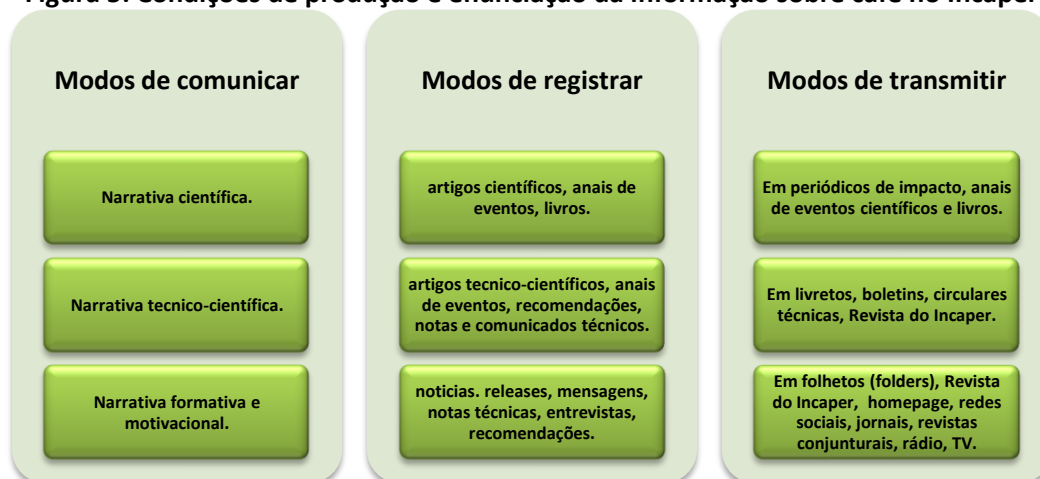
Figura 5: Condições de produção e enunciação da informação sobre café no Incaper