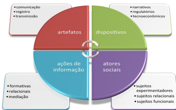
Figura 1: O ambiente de informação sob um regime de informação