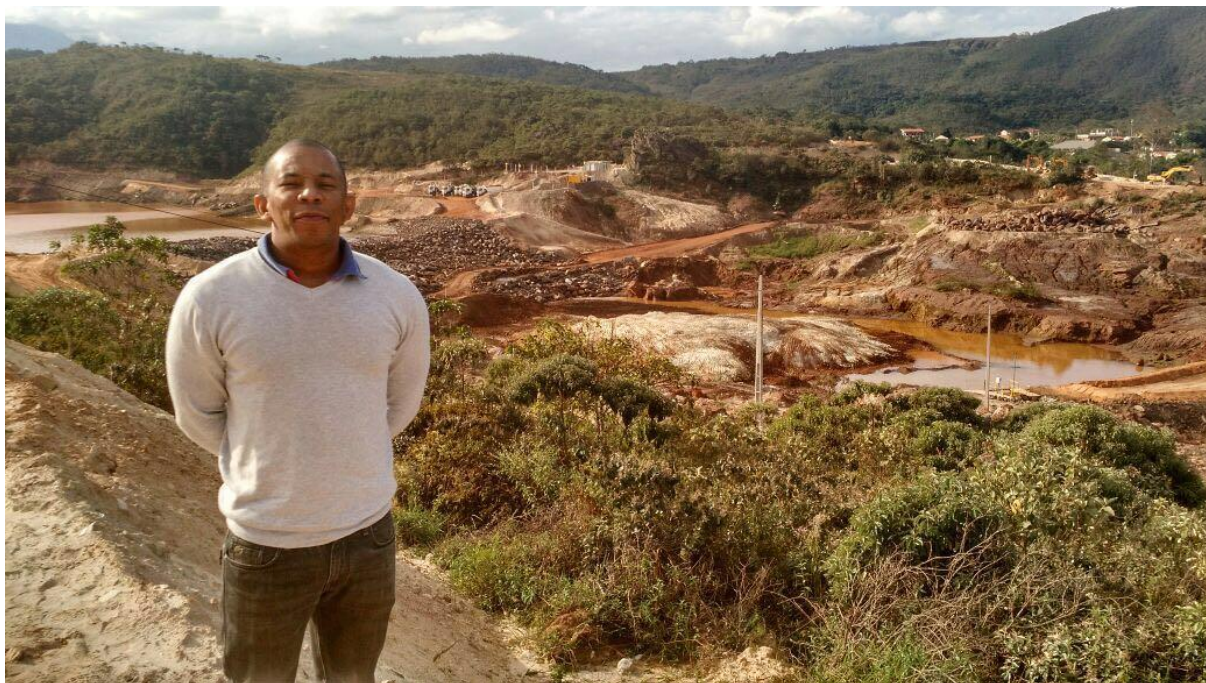
Figura 2 - Primeira visita exploratória ao campo.

de destruição (vide imagem abaixo). Isso mesmo. Não há outra palavra mais apropriada do que esta: destruição (figura 2).