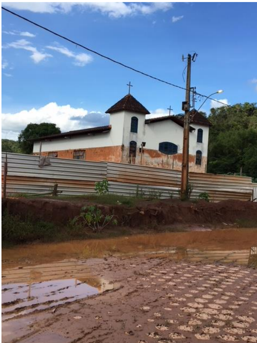
Figura 4 - Antiga Igreja de Paracatu de Baixo, registrando o nível de água nas paredes do templo.