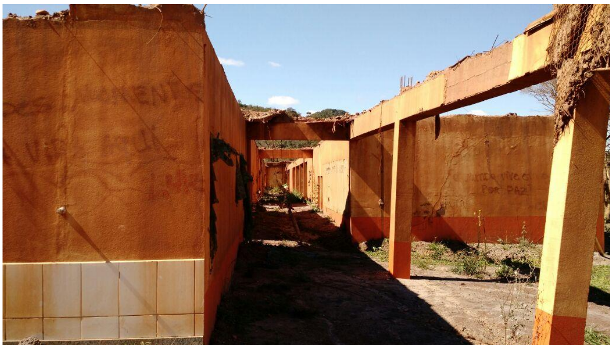
Figura 8 - Estrutura da antiga escola municipal de Bento Rodrigues

O futuro está logo ali, no amanhã, que para os moradores de Bento Rodrigues e de Paracatu de Baixo é tão difícil de distinguir no decurso do tempo. Presente e passado se confundem em tom de saudade, medo, incerteza, mas no fundo, eles sabem que sonhar não custa nada.