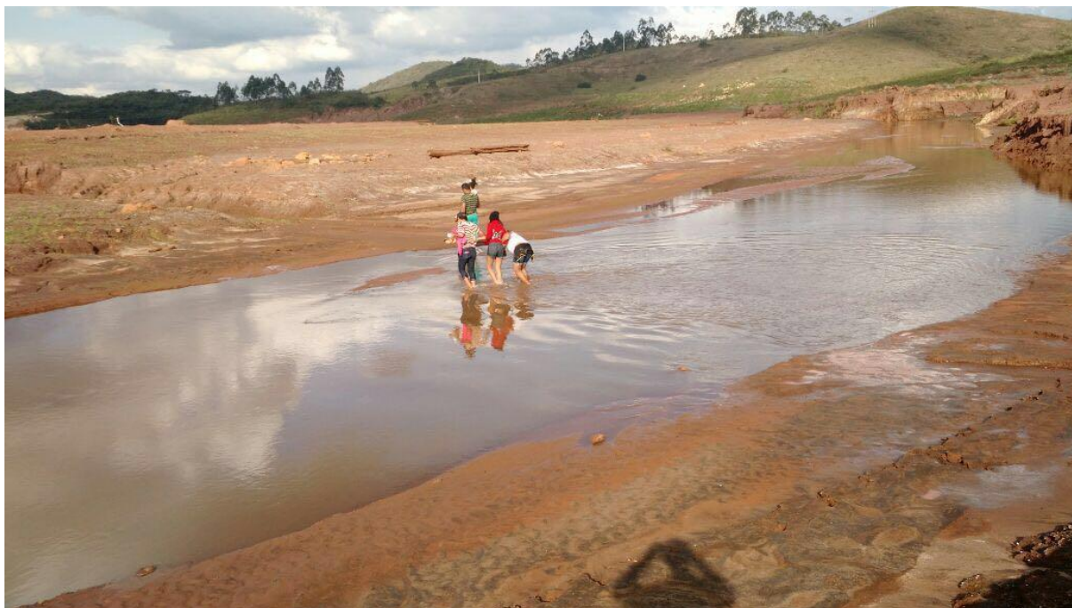
Figura 7 - Visita semanal das famílias atingidas ao local da tragédia