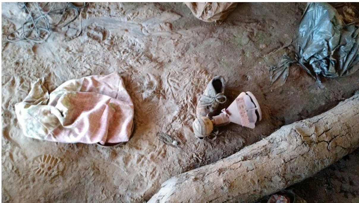
Figura 3 - A boneca despedaçada