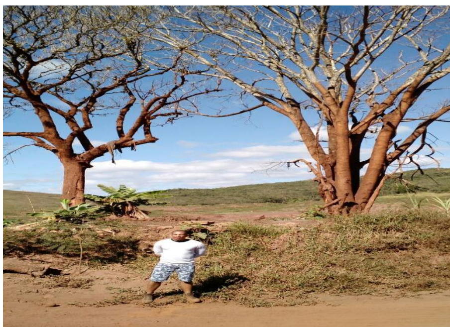
Figura 6 - Comparação entre o nível da lama nas árvores e a altura do pesquisador

A paisagem seguinte foi uma das primeiras fotografadas por mim, na qual se percebe o topo das árvores atingidas pela lama no dia do rompimento. Compare-se a minha altura (1,70 metro), com a altura das árvores atingidas. Esta imagem fica defronte à igreja totalmente destruída, construída no século XVIII (figura 6).