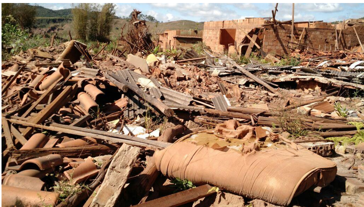
Figura 1 - Telhado de uma escola: o futuro em pedaços.

A imagem abaixo, feita por mim, remete ao cenário visto em julho de 2016 em Bento Rodrigues (figura 1).