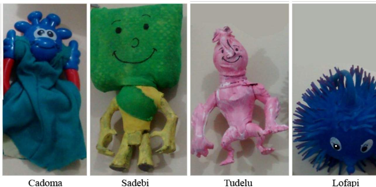
Figura 1. Estímulos antropomórficos e seus respectivos pseudo-nomes utilizados nos pré e pós-testes.