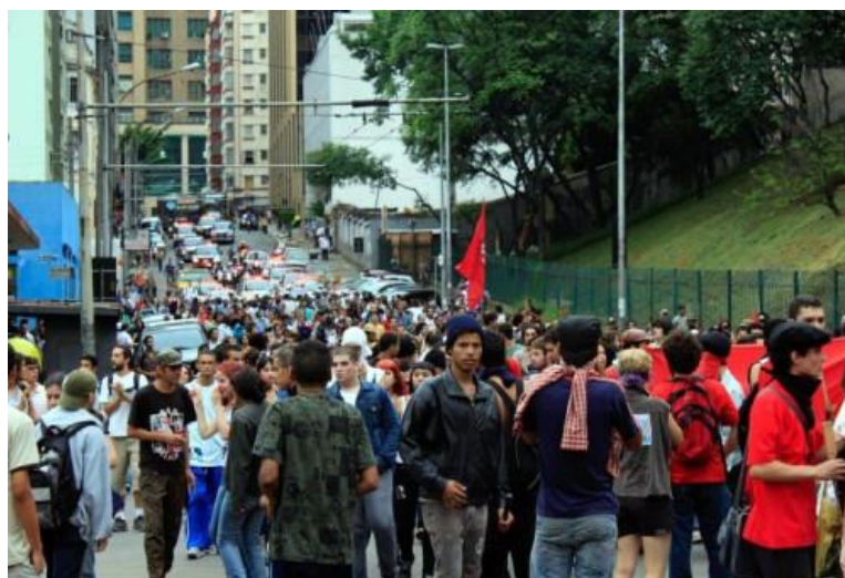
Figura 2 - 1ª Manifestação Contra o Aumento das Passagens em 2010.

Também é verdade que a variedade de atividades que o MPL-SP organiza vai ao encontro do conflito aberto ou do conflito moderado: bloqueio de avenidas; “escrachos”, isto é, atividades de desagravo contra uma pessoa; “catracaços”; colagens e pichações; etc. Tais ações são feitas pelas mesmas pessoas que debatem em audiências públicas, se reúnem com representantes do governo e do judiciário, dão entrevistas para os meios de comunicação, publicam artigos de opinião, e fazem pesquisas sobre o sistema de transporte.