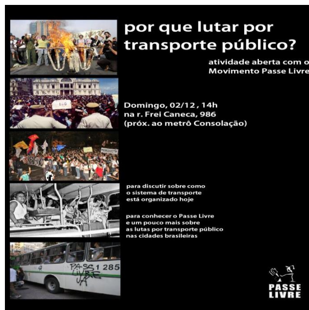
Figura 4 - Cartaz – Aula Pública “Por que lutar pelo transporte público?” 02/12/2012.