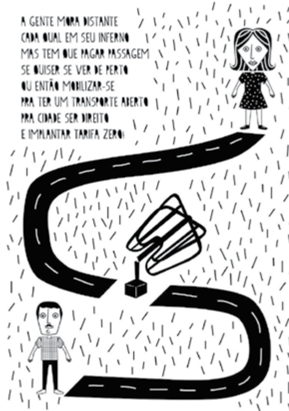
Figura 5 - Poema

seguinte poema acompanhado de uma imagem, adotado na 5ª Edição do jornal Passe, é expressão explícita da representação que compreende o transporte como determinante da sociedade: