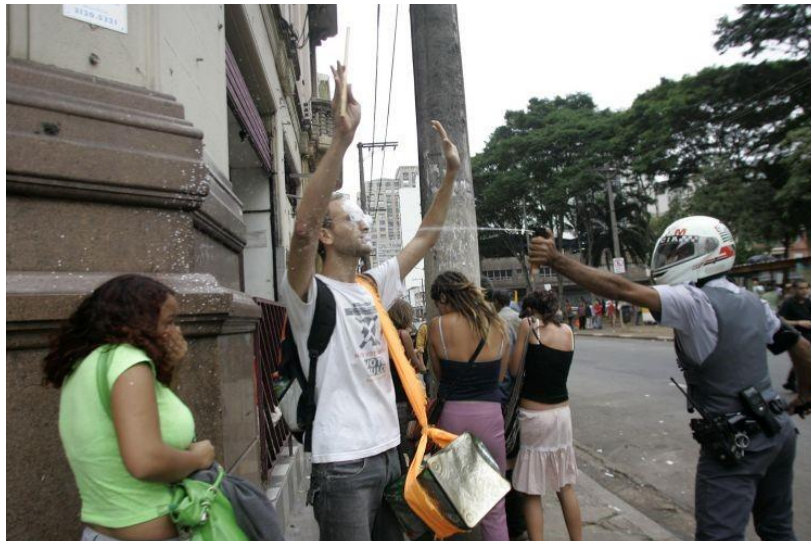
Figura 3 1ª Manifestação Contra o Aumento das Passagens em 2010.