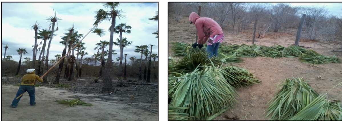
Figura 03 – extração da palha de carnaúba Figura 04 – Feixes de palha de carnaúba