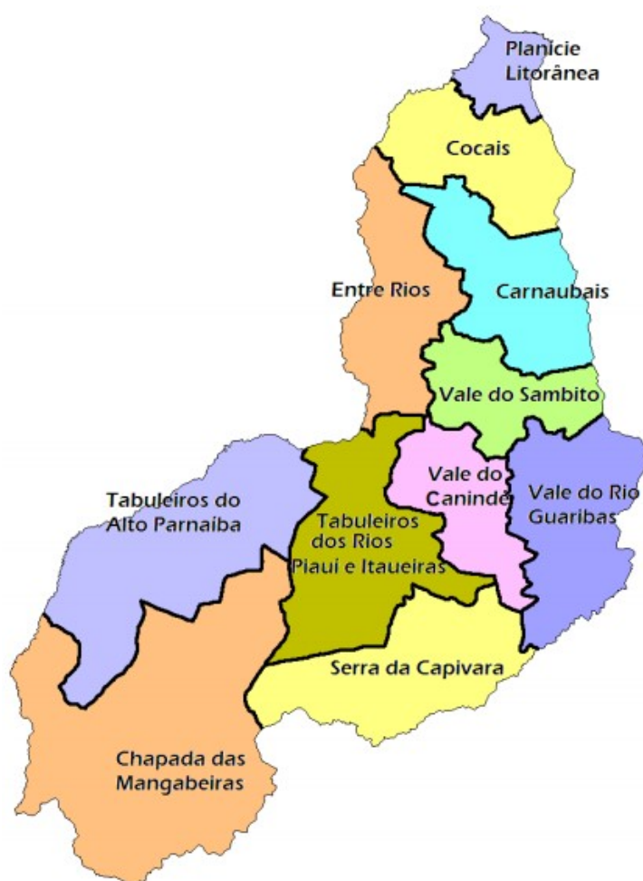
Figura 02 – Territórios de Desenvolvimento do Piauí

Esse município está situado na Macrorregião do Semiárido e é um dos 39 municípios piauienses que compõem o Vale do Rio Guaribas. Além dessa cidade, temos, ainda, nessa composição: Acauã, Alagoinha do Piauí, Alegrete do Piauí, Aroeiras do Itaim, Belém do Piauí, Betânia do Piauí, Bocaina, Caldeirão Grande do Piauí, Campo Grande do Piauí, Caridade do Piauí, Cural Novo do Piauí, Dom Expedito Lopes, Francisco Macedo, Francisco Santos, Fronteiras, Geminiano, Itainópolis, Jacobina do Piauí, Jaicós, Marcolândia, Monsenhor Hipólito, Padre Marcos, Paquetá, Patos do Piauí, Paulistana, Picos, Pio IX, Queimada Nova, Santana do Piauí, Santo Antônio de Lisboa, São João da Canabrava, São José do Piauí, São Julião, São Luis do Piauí, Simões, Sussuapara, Vera Mendes e Vila Nova do Piauí. Dentre esses municípios, grande parte deles pertencia, há alguns anos, a Picos, do qual eram povoados ou comunidades rurais, conforme Pinheiro (2017).