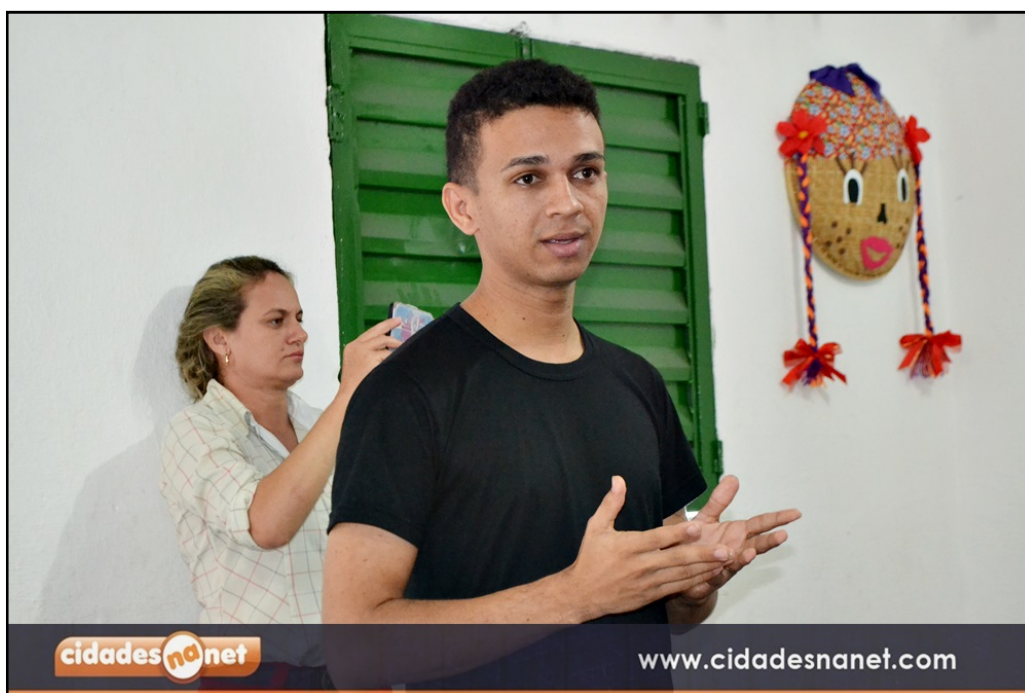
Figura 05 – Apresentação do projeto de incentivo à leitura e à escrita