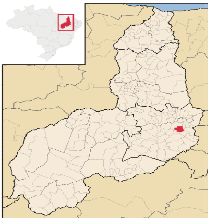
Figura 01 – Localização de Massapê do Piauí

Massapê do Piauí, desmembrado do município de Jaicós, foi criado por força da Lei Estadual nº 4.810, de 14/02/1994 9 , e instalado, oficialmente, no dia 1 de janeiro de 1997.