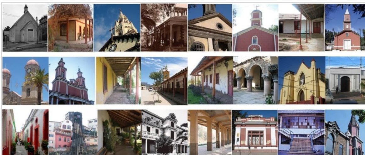
Figura 1. Edificaciones patrimoniales casos de estudio. Investigación FONDART 2017 (Muñoz, 2017).