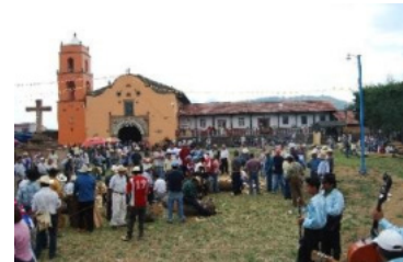
Fiesta del Corpus Christi en Sevina