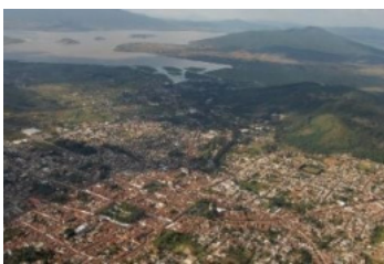
Cuenca lacustre de Pátzcuaro.

Los principales aportes del trabajo radican en la identificación y entendimiento de la interdependencia entre las dimensiones socio-culturales, ambientales y patrimoniales de la cultura purépecha. Al no comprender al patrimonio con esta visión integral, las políticas de patrimonialización en el área Purépecha en México, han privilegiado a la protección de algunas muestras del patrimonio material y de lo inmaterial de manera parcial. La falta de protección legal aunada a los problemas económicos que promueven la migración de los habitantes y con ello la invasión de modelos culturales distintos a lo local, asimismo la inseguridad, han propiciado en las últimas décadas, la imposición de nuevos paisajes, nuevos hábitos de vida en los cuales cada vez es mayor el alejamiento a la naturaleza. Hace falta una gestión sostenible que adopte una actitud de transversalidad en la lectura de este territorio cultural.