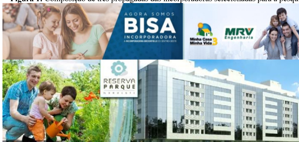
Figura 1: Composição de três propagandas das incorporadoras selecionadas para a pesquisa