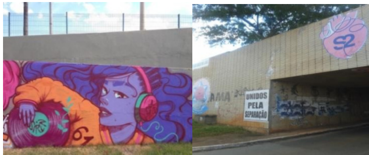
Foto 1 - Grafite da artista de rua Siren em Brasília, foto de Siren. Foto 2 - Passagem pela Esplanada dos Ministérios Brasília. Foto de Nayara Marinho, 2019.

Sendo expressão dessa totalidade, as intervenções urbanas surgem como forma de manifestação artística e perpassam a relação íntima construída entre a objetividade do mundo material e do espaço construído patrimonializado e a subjetividade na construção de símbolos e do imaginário cotidiano, como expressão do direito que se têm à cidade e “de mudar a si mesmos por mudar a cidade”, como afirmado por Harvey (2008).