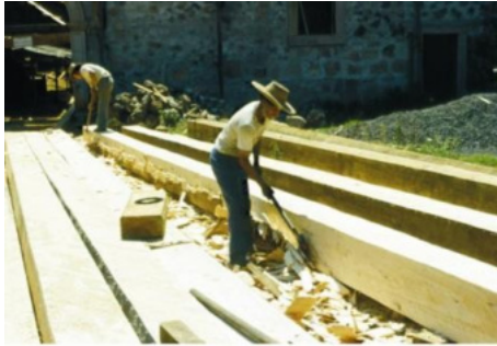
Figuras 1 y 2: Destrezas en la elección de los materiales y su procesamiento para la construcción.

México, haciendo levantamientos, tomas fotográficas, entrevistas y conviviendo con las comunidades para entender su forma de vida y organización en diversas tareas. Han sido fundamentales algunas actividades en las cuales los artesanos han estado desarrollando sus procesos de preparación de los materiales, observando los tiempos ocupados en ello y las habilidades en la elección de cada uno de ellos, la definición de los componentes y el uso de las herramientas. (Figuras 1 y 2).