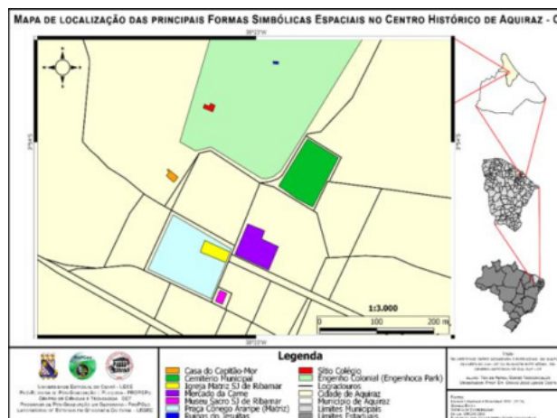
Figura 1 – Mapa de localização das principais formas simbólicas espaciais no Centro Histórico de Aquiraz.