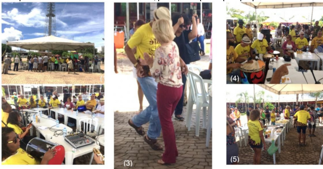
Figura (1): Praça de alimentação da Feira de Artesanato da Torre de TV: local de realização da roda de samba “Café com Samba”. Figuras (2) e (4): Integrantes e convidados da roda de samba “Café com Samba”. Figura (3): Participantes da roda de samba pesquisada. Figura (5): Mesa do café da manhã coletivo disponível para todos os participantes.

A roda de samba “Café com Samba”, portanto, revela uma concretização da dádiva no território, a partir dos fenômenos dar, receber e retribuir, contribuindo para uma visão social de especificidades relacionais ao território, promovido para e pela própria comunidade.