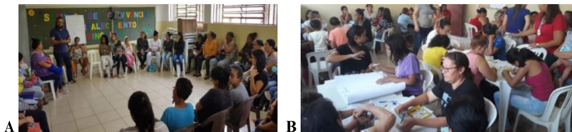
Figura 01: Em A, atividade formativa com discussão acerca dos problemas socioambientais da periferia de São Roque. Em B, a comunidade cartografa seus territórios, categorizando experiências e relações identitárias.

Desta pesquisa-ação, que implica ainda em significativas melhorias da qualidade do ensino, observa-se como resultado, um incipiente, mas estratégico fortalecimento dos laços de cooperação institucional e interfederativa, bem como entre as instituições e a população local. Neste sentido, utilizando de ciclos formativos junto ao grupo focal, verifica-se significativos avanços no empoderamento e autoafirmação dos envolvidos, a construção do patrimônio a partir das distintas experiências e relações, além da realização de um diagnóstico das condições socioambientais do bairro enquanto estratégia de planejamento e gestão democrática dos territórios da periferia de São Roque.