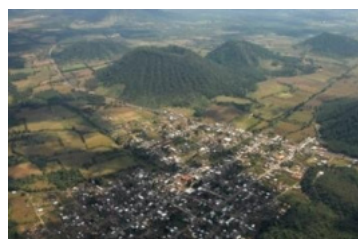
San Lorenzo, Sierra Purépecha