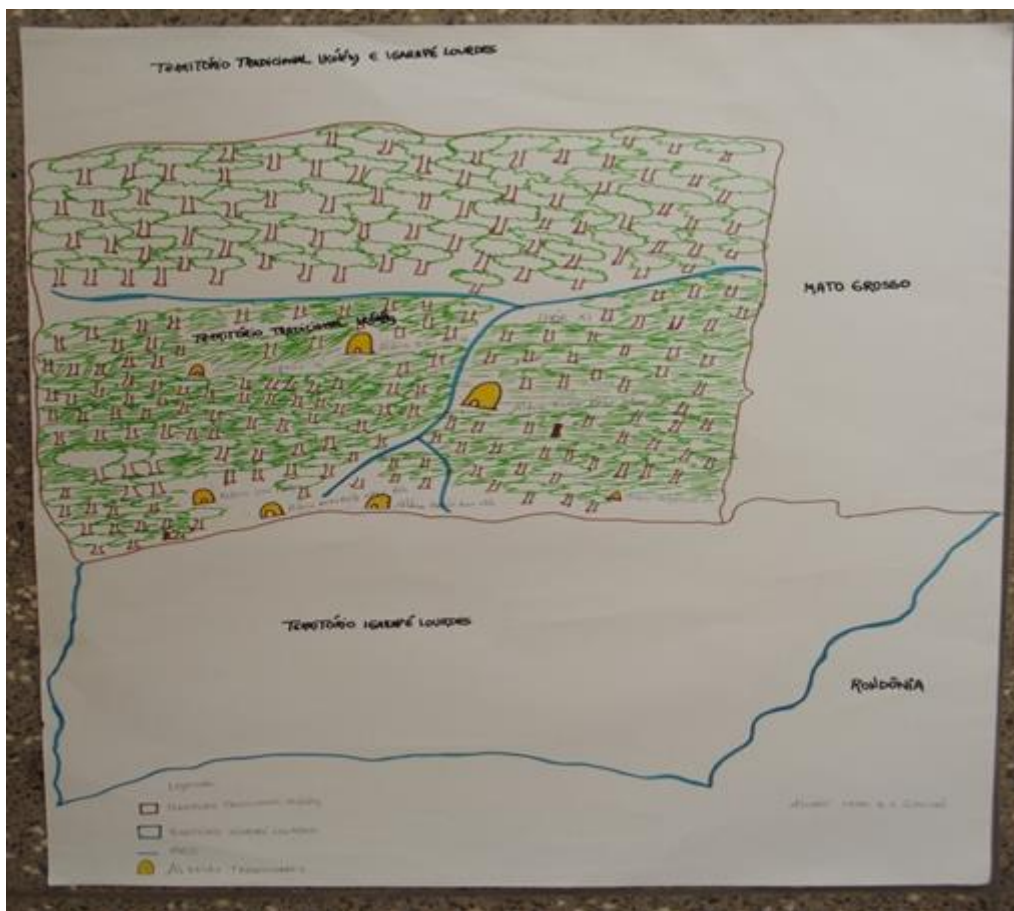
TERRITÓRIO TRADICIONAL IKÓLÓÉHJ – IGARAPÉ LOURDES Desenho de Iran Kav Sona Gavião

O mapa acima ilustra a Terra Indígena Igarapé Lourdes, onde vivem os Ikólóéhj atualmente e o Território tradicional ocupado por eles antes do contato com a sociedade envolvente. Naquela época viviam na região Noroeste do Estado de Mato Grosso, precisamente à margem esquerda do Rio Branco. Segundo os mais velhos relatam, viviam em frequentes conflitos com outros povos rivais. Para evitar novos conflitos, eles abandonavam suas aldeias do território tradicional e abriam novos locais e novas aldeias para viver. Durante esse percurso, eles entraram em contato com o povo Arara, por meio dos quais foram contatados pelos não-índios.