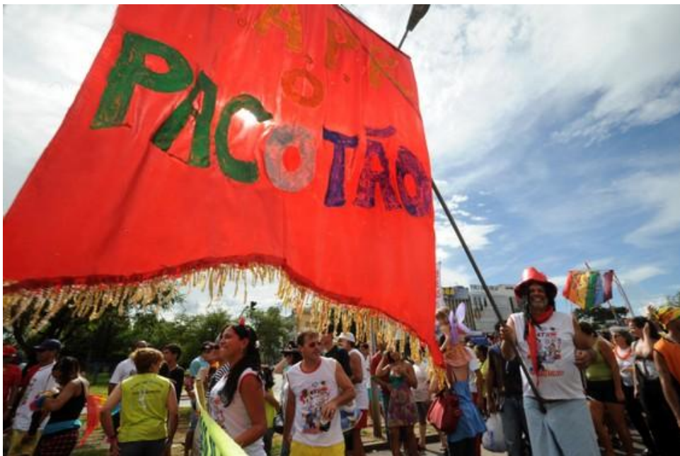
Imagem 21 – Estandarte do bloco.

Analisando as configurações e reconfigurações, rupturas, permanências e alternâncias das experiências carnavalescas vivenciadas em meio à folia do bloco Pacotão, pude entrar em contato com contextos políticos e sociais diversificados. Não somente a cidade, mas o próprio País foi representado pelas lentes bem humoradas de foliões que em meio a disputas, conflitos, harmonias e negociações, forjaram as suas representações, pinçando os aspectos de cada contexto histórico analisado. Procurei seguir não a ordenamentos cronológicos de caráter linear. Sempre que julgava serem instrutivas para o tema abordado, situações sobre a trajetória do bloco eram incorporadas ao texto, não sem que antes, uma articulação com o eixo da pesquisa fosse estabelecida.