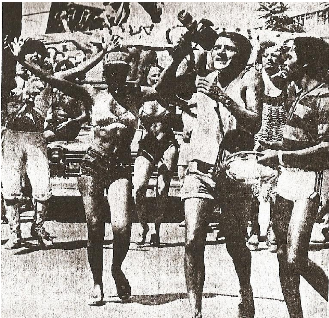
Imagem 6 - Ala dos umbigos profanos, levados pelo suor anárquico da cerveja vertida em cascatas liberais. Correio Braziliense: 02/1979

Para clarificar o entendimento acerca das características, ou do contexto em que é instituído o carnaval praticado pelo Pacotão, retrocederei com a análise em um ano. Em outras palavras, abordarei alguns aspectos do cenário político do ano de 1977 – ano em que foi fundado o Pacotão. A ênfase recairá nos acontecimentos que à época marcavam a cena política nacional. Para iniciar essa incursão, recorro às palavras de Gaspari: