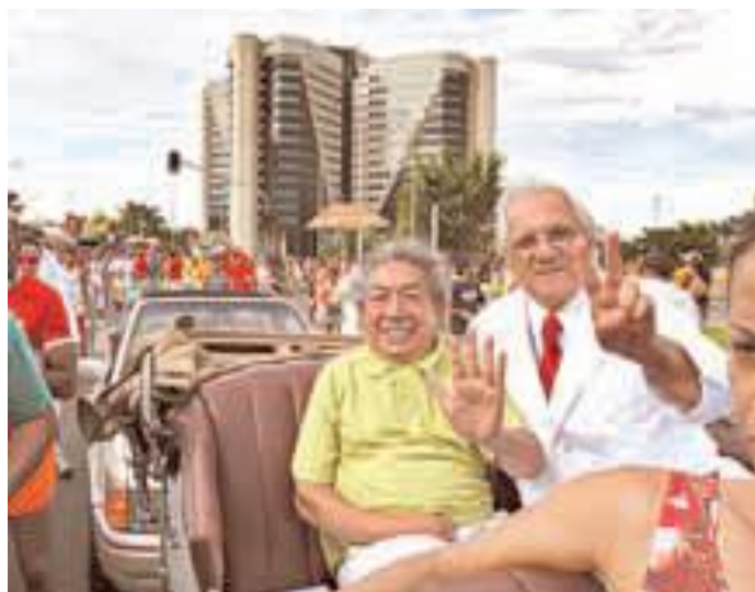
Imagem 1 – O carnavalesco Joãosinho trinta desfila no Pacotão.

No último dia de carnaval em Brasília, o carnavalesco Joãosinho Trinta foi a principal estrela do desfile do Pacotão, o mais tradicional e irreverente bloco de rua de Brasília. 1