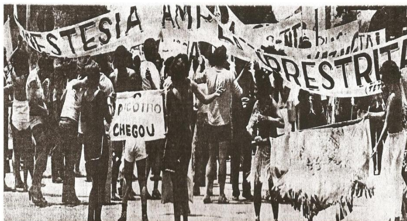
Imagem 8 - Foliões carregando faixas com o pedido de anistia. Correio Braziliense: 02/1979.

Naquele ano, o general João Baptista Figueiredo substituía seu colega de farda, Ernesto Geisel, na Presidência da República.