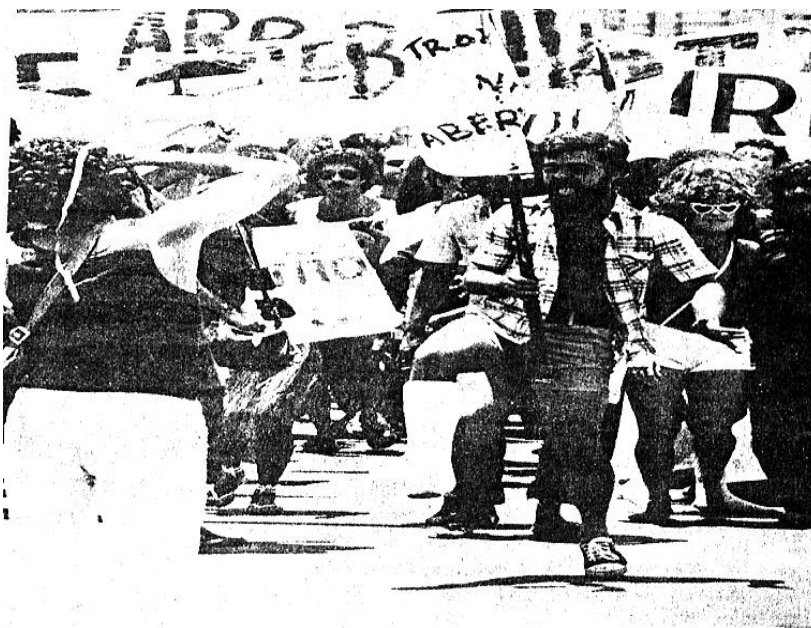
Imagem 10 – Folião e sua fantasia de enfaixado. Correio Braziliense: 02/1979

O folião que aparece na fotografia acima está fantasiado de perna enfaixada , sendo que uma das faixas que ajudava a carregar dizia: Tropecei na Abertura! Alusão ao processo de abertura política, mas que de um modo irônico, e trocando em miúdos, dizia apenas que havia tropeçado na avenida. Outras duas faixas tiveram bastante notoriedade no desfile daquele ano. Uma dizia: abre e arrebenta – cobrança dos foliões ao compromisso feito na época pelo presidente Figueiredo, que prometeu prender e arrebentar aqueles que fossem contrários ao seu projeto de abertura política. A outra oferecia: Aceita um xazim? Na época alguns chegaram a pensar que era maconha. Mas a oferta apenas se referia, por mais uma vez, ao Xá do Irã, derrubado pela revolução dos Aiatolás. Partindo do pressuposto de que os foliões pacoteiros se referiam à revolução iraniana para lembrar, simbolicamente, a necessidade de fazer uma aqui no Brasil - derrubando a ditadura militar, eles não poderiam deixar de presentificar na folia o principal personagem do Irã: o Aiatolá Khomeini que, na foto abaixo, cantava com os demais foliões a canção do Aiatolá .