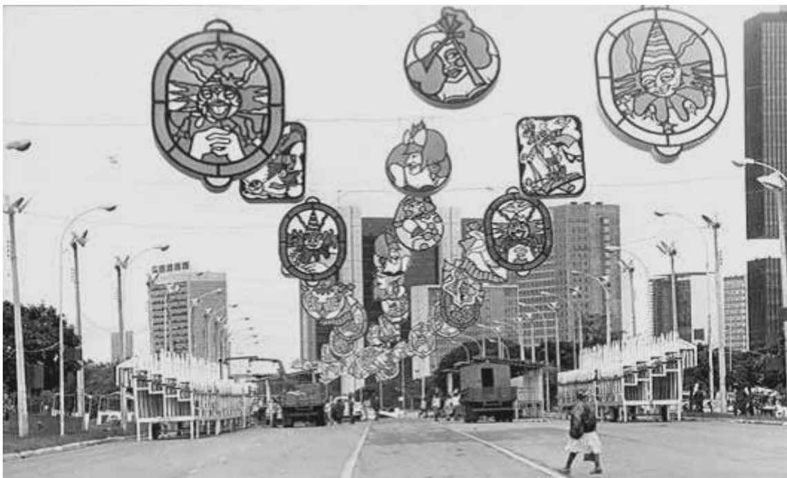
Imagem 13 - Eixão Sul enfeitado para o carnaval de 1983. Correio Braziliense: 02/2007.

que vão desde a sugestão do atual Governo de Brasília para que os blocos tradicionais da cidade desfilassem em direção ao espaço Gran Folia, episódio já comentado, à solicitação dos diretores do Detur – nos anos oitenta – para que o bloco Pacotão desfilasse no Eixão da folia, local para onde foram transferidos os desfiles oficiais do carnaval brasiliense.