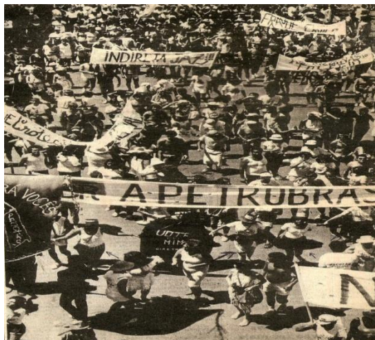
Imagem 14 – pedidos por eleições diretas para presidente compõem a paisagem visual da festa.

Faixas foram erguidas com frases sarcásticas que clamavam: indiretas jáz! O oposto era o desejado.