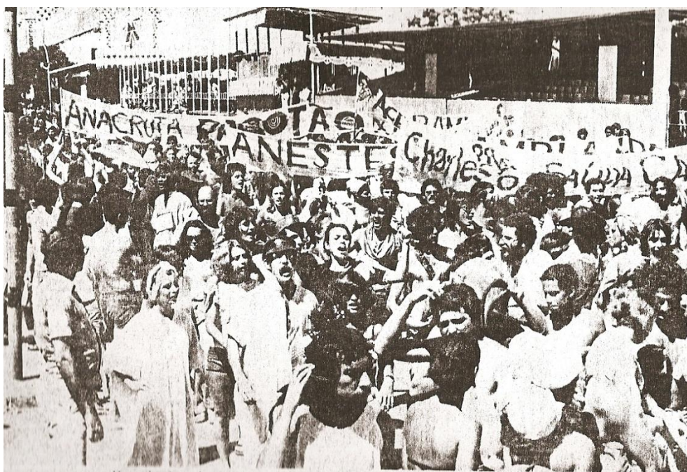
Imagem 9 - Num estilo irônico, os festeiros pediam por anestesia, ampla, geral e irrestrita, referindo-se, é claro, a anistia que no momento era tão desejada. Correio Braziliense: 02/1979.

Os foliões não somente cantavam os versos debochados da marchinha, como também carregavam faixas com pedidos de todas as ordens, sobressaindo, porém, o pedido de anistia irrestrita que contemplasse a todos os perseguidos pelo regime. Embalados pela marcha do Aiatolá, inúmeros festeiros não tardaram em engrossar as fileiras do bloco, formando um coro de vozes, faixas, e fantasias, assemelhavam-se a uma marcha, que embora fosse desfile carnavalesco, também operava como instrumento de crítica.