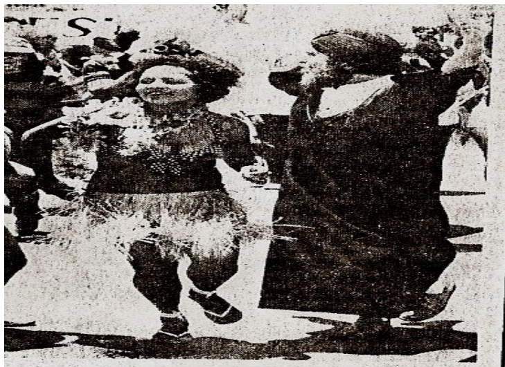
Imagem 11 – Aiatolá comparece ao desfile, pelo menos em fantasia. Correio Braziliense; 02/1979.

Durante o percurso de aproximadamente sete quilômetros, desde o antigo Bar do Chorão na CLN-302 Norte até a W/3 Sul, altura da Quadra 508, a agremiação teve suas fileiras engrossadas por populares que se encontravam nos pontos de ônibus, nas quadras e nos veículos. 46 Os foliões do Pacotão não se intimidaram com os acontecimentos antes mencionados, envolvendo a cobertura do carnaval brasileiro. Cada folião que aderiu a festa trazia sua representação da realidade compartilhada, sendo essa expressa seja por fantasias, seja por faixas, ou, seja ainda, pelo canto, pelo cantalarar da animada canção. Portanto, é importante assinalar que,