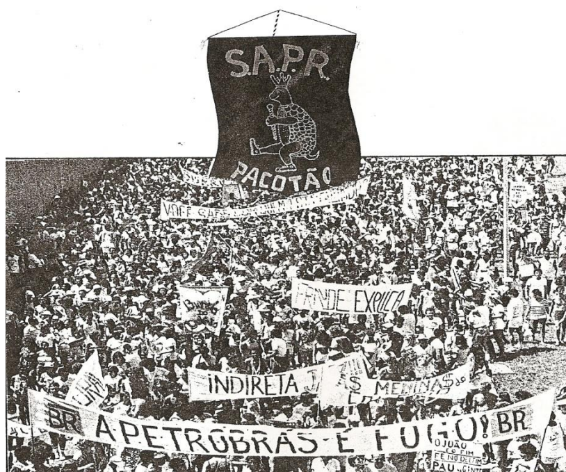
Imagem 15 - Capa do vinil gravado pelo bloco em 1985. Acima o símbolo da agremiação: uma tartaruga. Logo abaixo, foliões e suas faixas expressão suas visões sobre os acontecimentos que marcavam o momento.

Faixas foram erguidas com frases sarcásticas que clamavam: indiretas jáz! O oposto era o desejado.