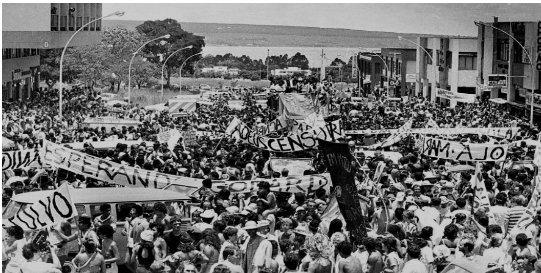
Imagem 17 - Correio Braziliense: fotografia 02/1986. Foliões erguem suas faixas protestando contra a censura.

Sobre esse assunto, chamo atenção para dois aspectos. Primeiro, é necessário salientar que não foi pelo fato de ter o País passado a ser presidido por um civil que práticas autoritárias deixaram de existir. A situação envolvendo a censura do filme Je Vous Salue Marie , acima explicitada, é bastante instrutiva nesse sentido. A segunda refere-se ao significado ou talvez até temor que passou a ter do Pacotão certas pessoas e grupos de poder na capital. Afinal, informações sobre a agremiação haviam se tornado notícias certas na cobertura do carnaval brasiliense. Ser motivo de deboche e escárnio no Pacotão poderia significar desmoralização tanto na mídia local, quanto em rede nacional. Na fala de Joanfi: