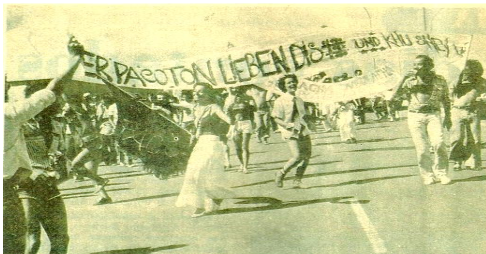
Imagem 5 – Foliões carregam faixa com alusão às origens germânicas de Geisel.

acompanharam à distância o desfile do bloco em fevereiro de 1978. Ao final, não conseguiram desvendar o que talvez pudesse ser alguma espécie de mensagem subversiva codificada. Na verdade, a junção de tais palavras não possuía sentido coeso. Tratava-se apenas de um jogo de palavras que fazia referência às origens germânicas do general Geisel. 37