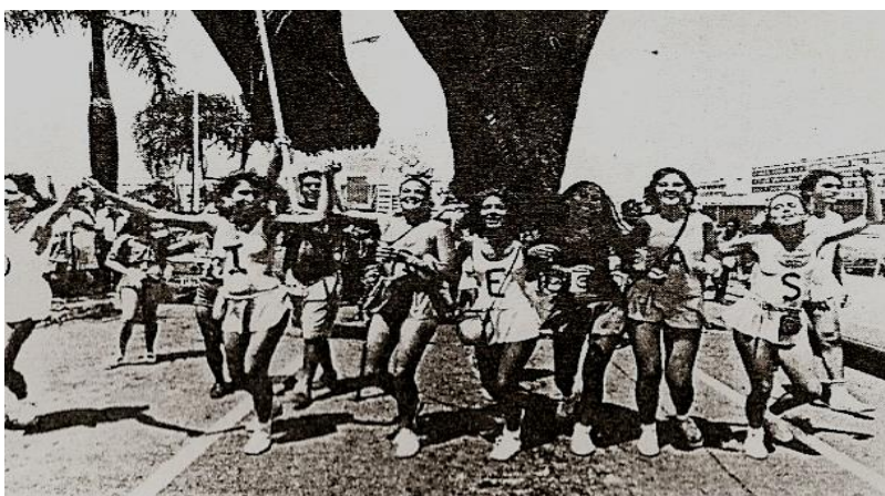
Imagem 16 - Encarte do vinil gravado em 1985. As letras DIRETAS formam a fantasia dos festeiros.

Mais que nunca, havia se tornado o Pacotão um ponto de convergência das críticas políticas proferidas pelos moradores da cidade. Esses, ao participarem de seus desfiles, davam-lhes os traços de suas convicções políticas e experiências diárias com e na Capital.