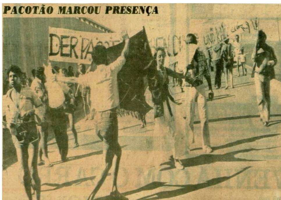
Imagem 4 – Foliões cruzam complexos de viadutos com direção a Asa Sul. Correio Braziliense; 02/1978

O carnaval, conforme observa esse antropólogo, surge como uma imensa tela social, onde múltiplas visões da realidade são simultaneamente projetadas (DAMATTA, 1981: 122) No carnaval do Pacotão, um dos fortes exemplos dessa incorporação de visões em seu desfile são as faixas que expressam, geralmente, indagações de protesto. Essas são carregadas pelos foliões durante a realização dos desfiles. Não podendo deixar de informar que desde o primeiro ano em que o Pacotão saiu às ruas da cidade, essa foi uma prática característica da brincadeira apresentada.