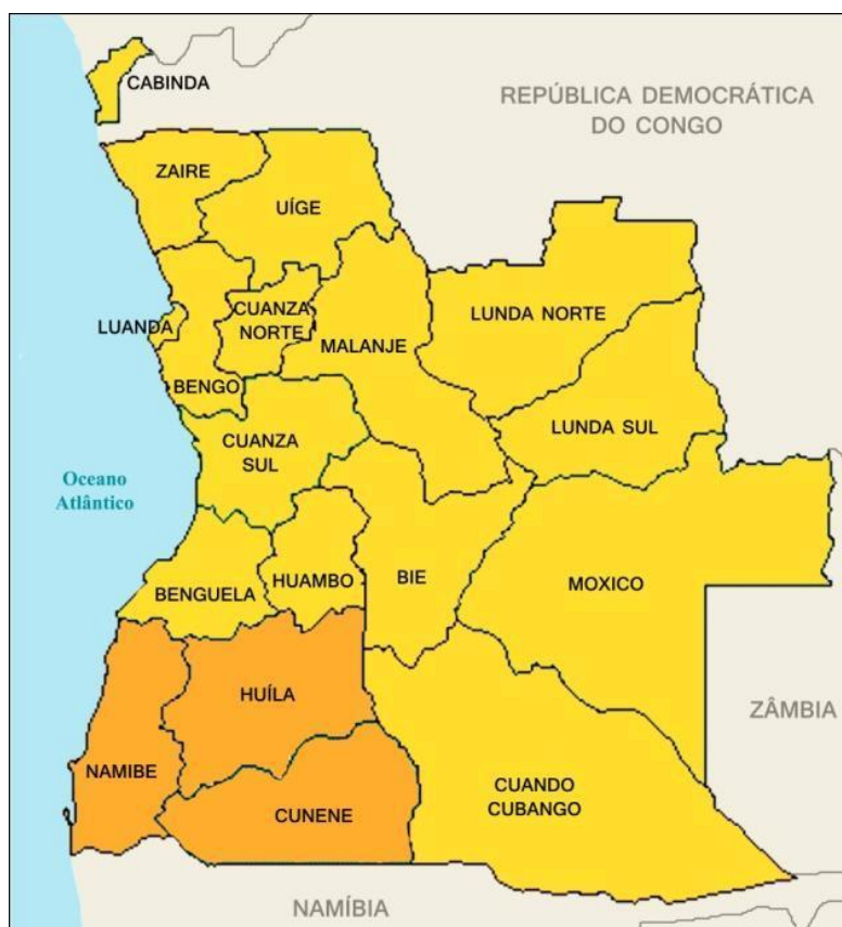
Figura 1: Mapa da república de Angola, por províncias.

É um país independente há 43 anos, portanto, Estado - nação, recentemente saído do colonialismo português, que deixou um legado de pobreza e miséria, em todos os sectores. O país viveu longo período de guerra, no período antes e depois da independência proclamada no dia 11 de novembro de 1975, e que se arrastou por 30 anos. O território angolano está ordenado em províncias (vide Figura 1), consideradas as células de base para planificação e dotação orçamentária, e em cada província há municípios subdivididos em distritos urbanos, que são as menores unidades político-administrativas (20,23) .