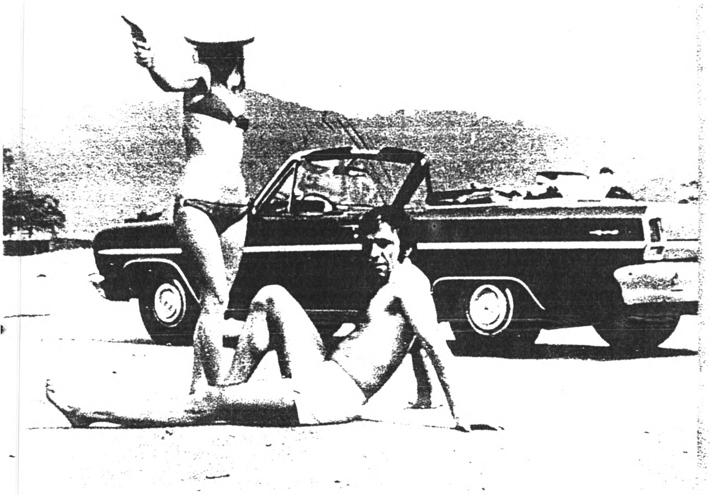
Esta foto faz parte do material de divulgação do filme. Vemos Janet Jane empunhando uma arma enquanto o bandido descansa, ambos na Praia de Santos.