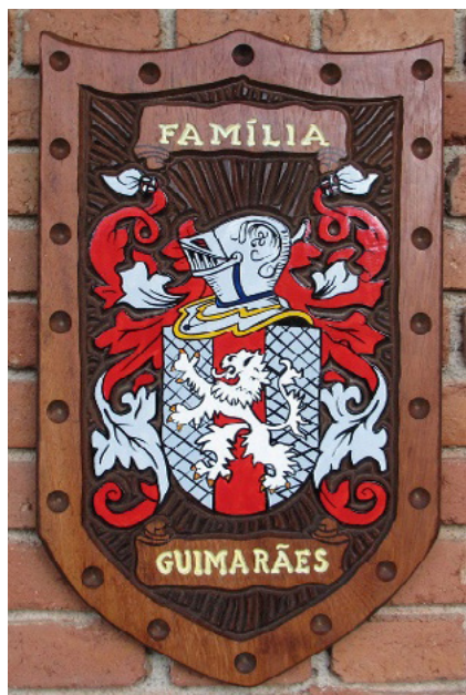
Imagem 2 – Brasão da Família Guimarães em entalhado em madeira

da família "Costa Guimarães" tenham se casado entre si, alimentando a expressão popular que diz que "todo mineiro é primo".