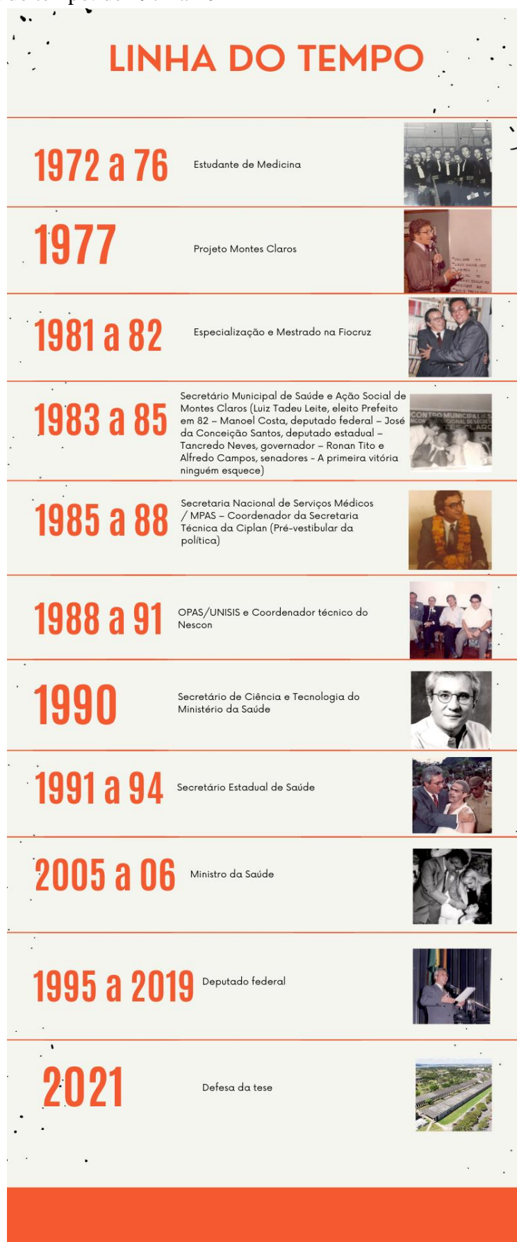
Figura 36. Linha do tempo: de 1972 a 2021