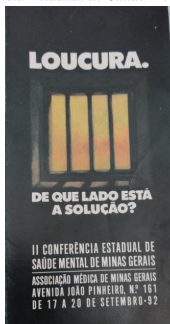
Figura 29. Cartaz da II Conferência Estadual de Saúde Mental , 17 a 20 de setembro de 1992