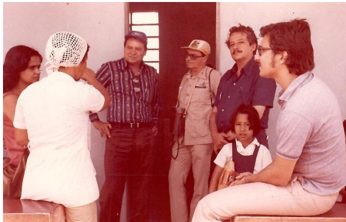
Figura 11. Reunião em posto de saúde no Norte de Minas Gerais, 1977