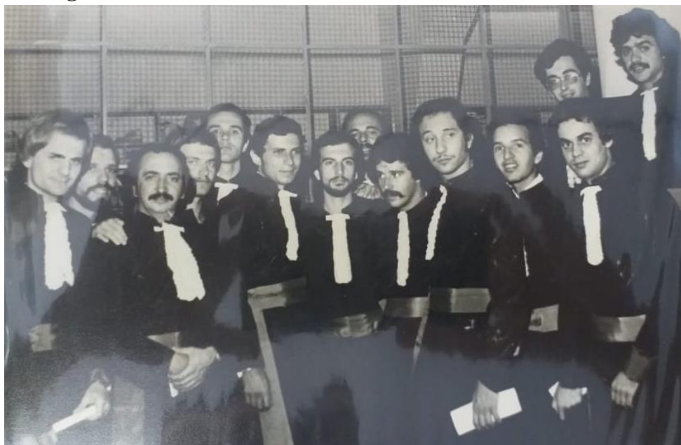
Figura 12. Dia da formatura em Medicina/UFMG, em 08/12/1976