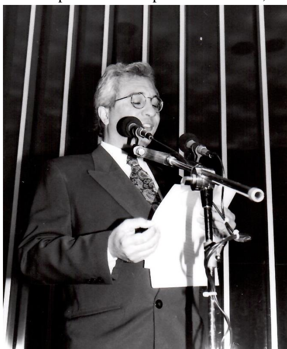
Figura 31. Como deputado federal por Minas Gerais, de 1995 a 2019

Deixei a secretaria no último dia de março de 1994 para disputar o primeiro mandato como deputado federal. No pleito de outubro daquele ano, mercê do povo do Norte de Minas e de outras regiões do Estado, fui o quinto colocado entre os 53 nomes eleitos para a representação estadual. Empenhei-me muito pela aprovação da Lei nº 10.216 (BRASIL, 2001), que “Dispõe sobre a proteção e os direitos das pessoas portadoras de transtornos mentais e redireciona o modelo assistencial em saúde mental”. Sabia muito bem o porquê.