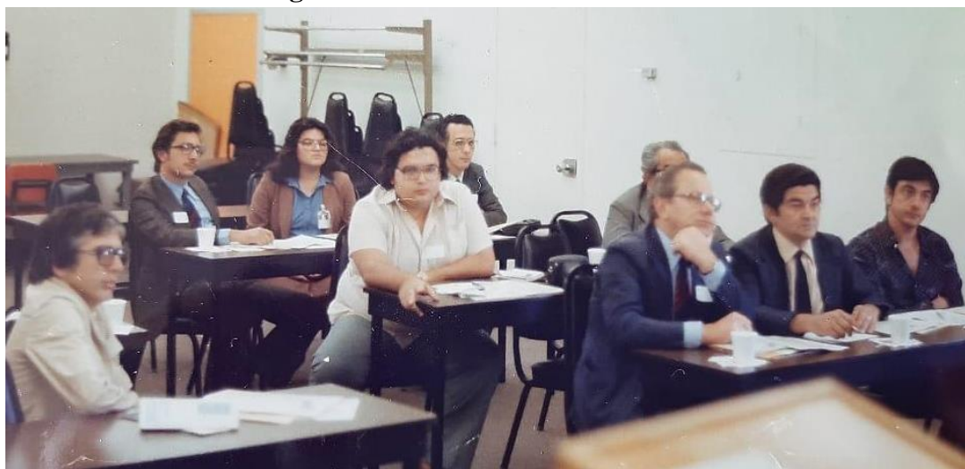
Figura 17. O “time” do Internato Rural