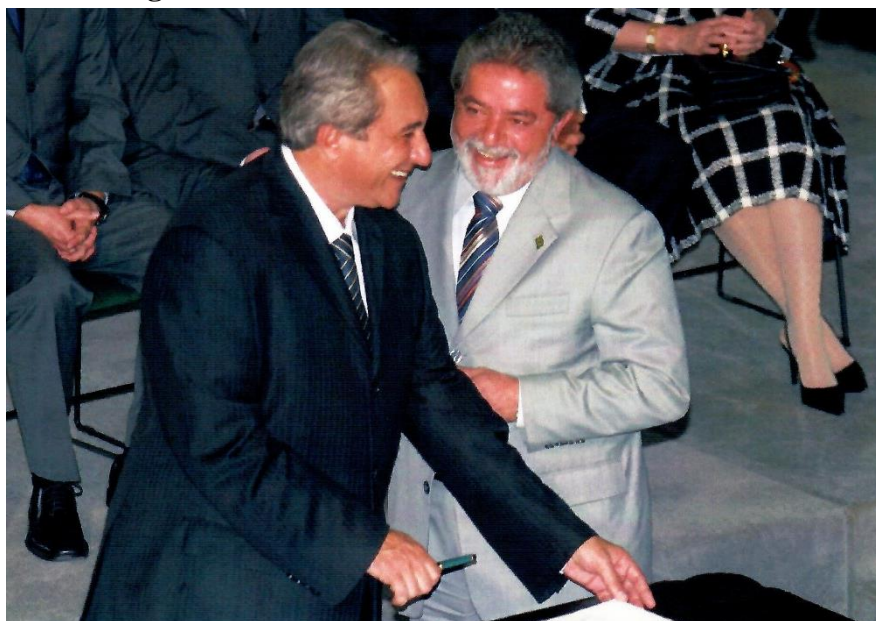
Figura 32. Posse como ministro da Saúde em 2005

O presidente pediu-me que lhe enviasse algumas cópias do meu currículo através da ministra da Casa Civil, Dilma Rousseff. Chegou a comentar que “ tinha atirado no que viu e acertado no que não viu ”, ou seja, escolhido o deputado e acertado no sanitarista, com bom trânsito e reconhecimento no meio da saúde pública.