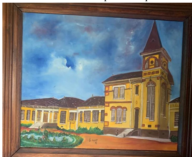
Figura 28. Tela da entrada do Centro Hospitalar Psiquiátrico de Barbacena, 1992

Legenda: Pintura fiel da entrada do Centro Hospitalar Psiquiátrico de Barbacena (CHPB). Quadro comprado de um interno de Barbacena, em 1992. Está assinado L. Soares, 1987. A pintura, os traços, as cores lembram Van Gogh. O céu, digo no texto, parece prestes a desabar sobre nossas cabeças. É a tradução da sua opressão, angústia.