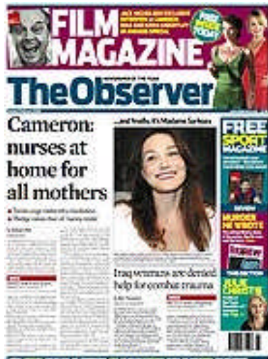
A capa do Observer em 3 de fevereiro de 2008, mês da mudança.

Em fevereiro de 2008, o Observer , um dos principais jornais ingleses alterou dramaticamente o seu visual. Conhecido por ser um jornal semanal analítico, com textos profundos, o Observer ganhou títulos grandes, “olhos” (destaques que aparecem entre as reportagens como “caixas de frases” para chamar a atenção do leitor), fotos, cores fortes e um recurso considerado como uma das últimas tendências neste campo – o uso da “cabeça” (espaço onde se localiza o título do jornal) para destacar chamadas importantes da edição. O objetivo, segundo o designer Ary Moraes foi “favorecer a leitura de grandes blocos de texto sem torná-la massacrante”. 530 Ou seja, um jornal que tradicionalmente se destacou pelo texto mudou para, ao destacar o visual, reforçar junto a novos leitores que o seu texto é aprazível para leitura.