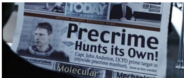
Porém, a manchete é alterada instantaneamente promovendo, assim, a atualização imediata de notícias aos leitores. 563

É difícil prever quais os caminhos a serem adotados pelos jornais. Vimos que a Internet revigora constantemente os fenômenos de adaptação no jornalismo, atingindo