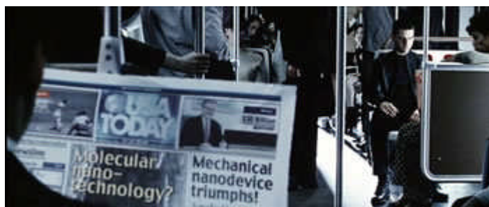
A edição do USA Today lida no metrô, na ficção de 2054. O jornal é em papel, como hoje.

Essa necessidade de realizar contínuas adaptações tornou-se intrínseca a veículos de diferentes meios de comunicação. De modo que a fisionomia do jornal impresso deve ser alterada neste constante processo de mudanças. No filme “Minority Report”, vemos um jornal impresso que atualiza as notícias imediatamente através de células tecnológicas.