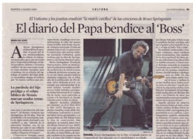
Reportagem do jornal espanhol La Vanguardia sobre a cobertura do L'Osservatore ao show de Bruce Springsteen.

Há diversos casos de jornais que alteraram as suas práticas de atuação e essa discussão tem sido constante nos últimos anos por causa da competição com a Internet. Um dos que mais me chamou a atenção foi o caso do L'Osservatore Romano , o tradicionalíssimo jornal do Vaticano. Editado pela Igreja, desde 1861, é uma espécie de Pravda (ou “jornal de governo”) do Estado do Vaticano. Pois o L'Osservatore decidiu que deveria mudar a sua linguagem para se tornar “um pouco mais sexy”. A cobertura das religiões foi ampliada para abranger outras, além da católica. O jornal passou a contar com a colaboração de agnósticos e de não católicos. Judeus, muçulmanos e pastores protestantes ganharam espaço nas páginas do jornal da Santa Sé. Além disso, ficou mais arejado, com mais fotos e colunas de opinião. Um concerto de rock de Bruce Springsteen obteve crítica elogiável. Houve ainda um esforço para tornar a leitura mais agradável.