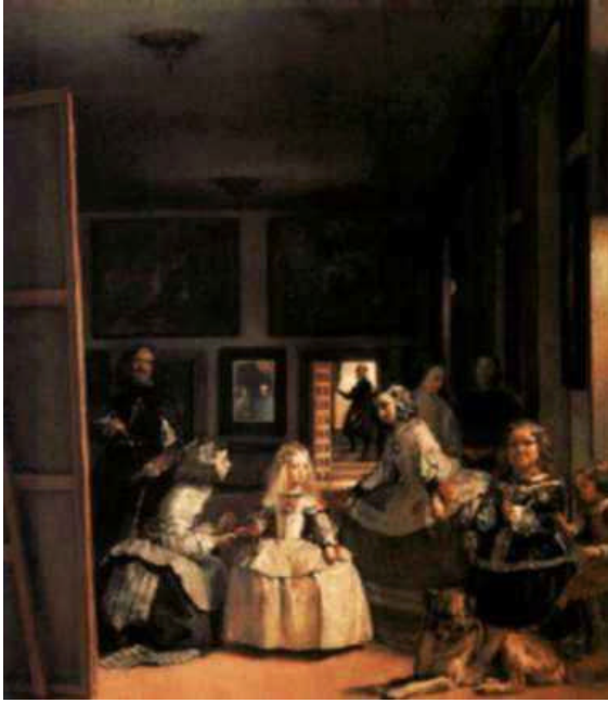
O quadro de Velázquez, no Museu do Prado, em Madri, é um exemplo de interatividade através da pintura, segundo o cineasta Peter Greenaway. 70

O cineasta Win Wenders comparou os DVDs ao significado que os livros possuíam antigamente. “Gosto dos DVDs. Com eles, posso tratar os filmes e tê-los como tenho livros. Posso ir para o capítulo que gosto ou ouvir os comentários do diretor. São experiências completamente diferentes”, disse Wenders, comparando a experiência de assistir a um filme no DVD ou na sala de cinema. A experiência da sala de cinema não se perdeu, concluiu Wenders. “Mesmo gente jovem gosta de sala escura.” O que se ganhou foi uma nova possibilidade de se conviver com a produção cinematográfica, de levá-la para casa e vê-la da forma que lhe melhor convém.