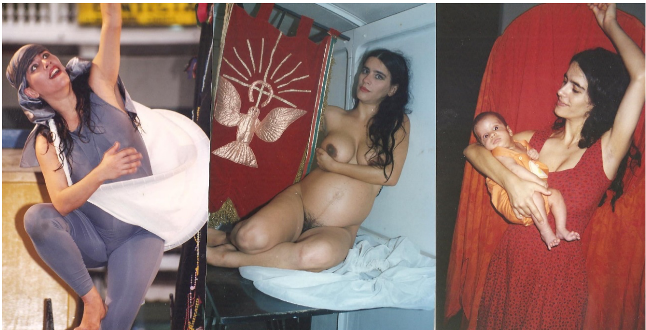
Figura 1, 2, 3 e 4 - Duosolo grávida, espetáculo Profetas em Movimento (1995/6 dançando dentro e fora da barriga.

confortável, partindo da observação/tradução do movimento de esculturas, pinturas, elementos da natureza, no meio de métodos clássicos nada confortáveis. Então, a metáfora de uma musa da arte da Dança, uma Terpsícore também grávida (assim como sua mãe Memo), de filhos híbridos negociadores, para evocar a Cosmodança me pareceu interessante.