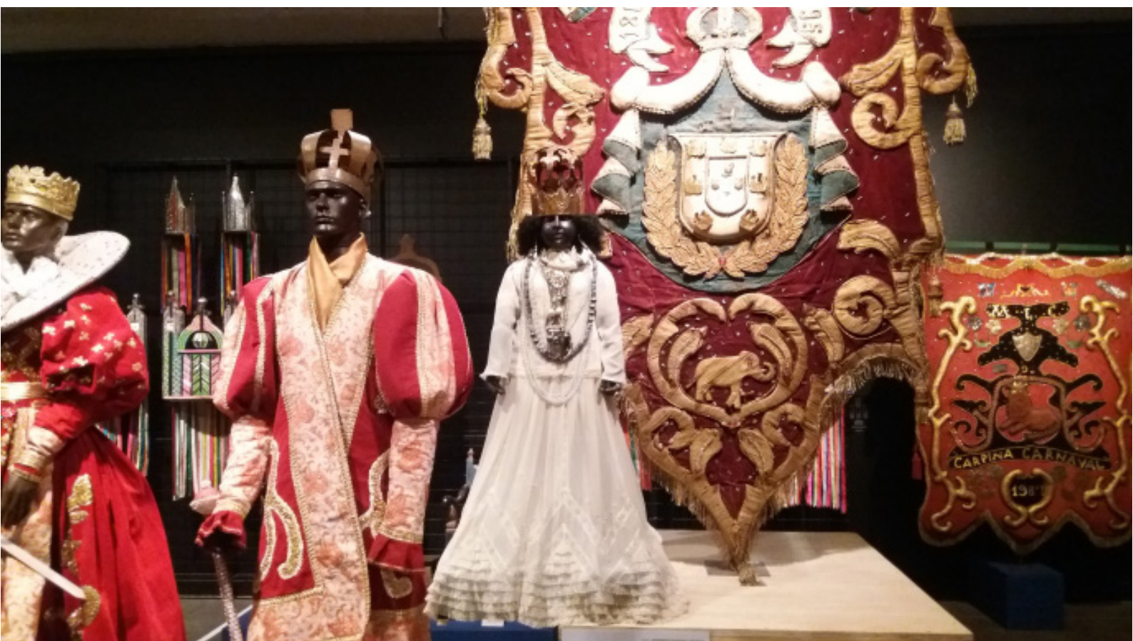
FIG. 1. Vista da exposição Barroco Ardente e Sincretico – Luso-Afro-Brasileiro , Museu Afro Brasil, 2017.

um conjunto de práticas que buscam estender seu efeito para além do tempo localizado da mostra: “as exposições, graças ao desenvolvimento do arquivo, que a desmaterialização torna ainda mais acessível, transformaram-se em discursos reproduzíveis e em memórias mutantes de tudo aquilo que elas estimulam como experiências humanas e valores culturais” (Poinsot, 2016: 11). Assim, críticas especializadas, resenhas, produtos de comunicação como o material gráfico 2 , entrevistas, postagens em mídias sociais etc. compõem, num tempo particular e ampliado, a condição expositiva que buscamos investigar.