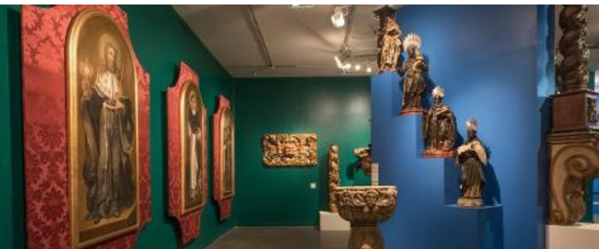
FIG. 2. Vista da exposição Barroco Ardente e Sincretico – Luso-Afro-Brasileiro , Museu Afro Brasil, 2017.

da produção “tropical”, singularizando-a e selecionando seus aspectos particulares. Contudo, ao contrário da mostra de 1998, Araújo mirou na tese da circulação de modelos no Atlântico, por meio de suas emulações, adaptações e inovações que fortalecem o conceito de sincretismo; conceito que ele subverte para compor uma exposição constituída pela hifenização, um barroco único e coligado pelo trinômio luso-afro-brasileiro 8 .