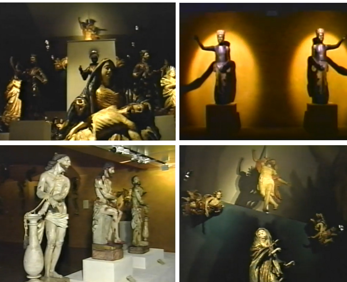
FIGS. 4(A-D). Frames do filme O Universo Mágico do Barroco Brasileiro , direção de Celso Renato Maldos (Imagemakers).

pelas narrativas de “brasilidade” 13 que conformaram a Bienal de São Paulo daquele ano ( Bienal da Antropofagia ) e preparavam o terreno para exposições laudatórias ou mostras-síntese como a do Redescobrimento dois anos depois. Já na exposição do Museu Afro Brasil, as marcações discursivas e a seleção de peças operavam pelo elogio ao transnacional, tomado pela sua face mais aprazível, o transcultural.