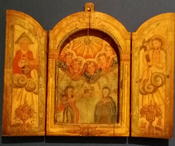
FIG. 6. Exposição Barroco Ardente e Sincrético. Luso-Afro-Brasileiro, 2017, Museu Afro Brasil, São Paulo. Texto de parede de Eduardo Lourenço 25.