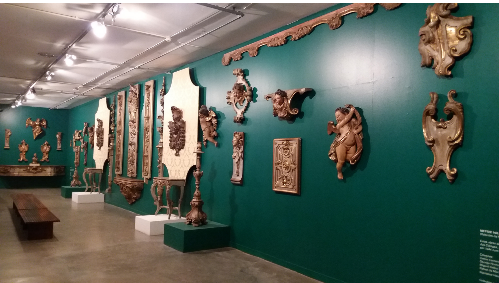
FIG. 3. Parede dedicada às obras de Mestre Valentim pertencentes a Igreja São Pedro dos Clérigos (1733), demolida em 1944, na cidade do Rio de Janeiro; exposição Barroco Ardente e Sincretico. Luso-Afro-Brasileiro, 2017, Museu Afro Brasil, São Paulo.