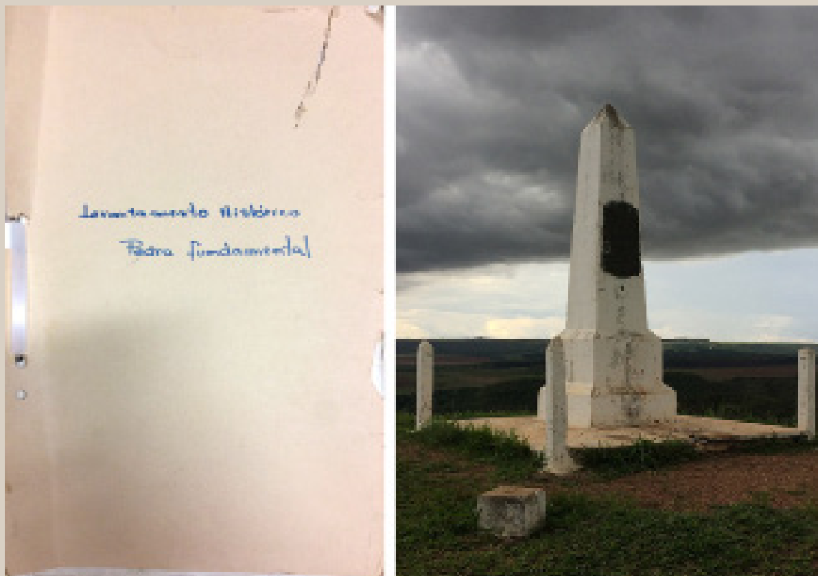
Imagem 2 – Processo de tombamento da Pedra Fundamental de Planaltina (esq.) e Pedra Fundamental de Planaltina (dir.), 2018.