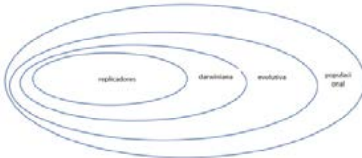
Figura 1: Tipos de descrição populacional 5