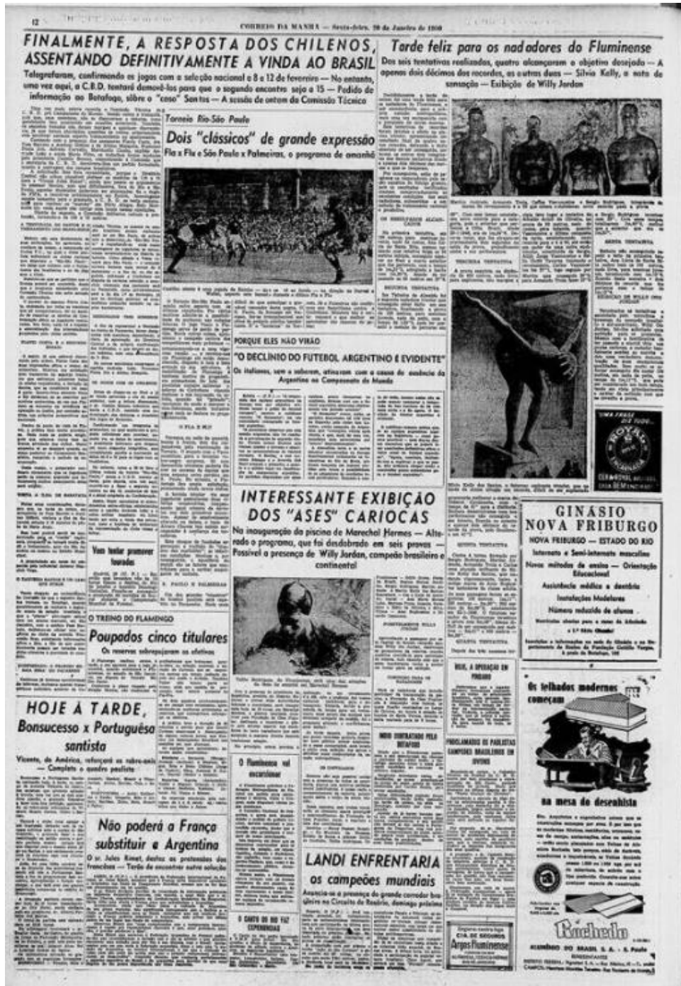
Figura 8: Correio da Manhã, folha 1 da edição de 20.01.1950. (1950)

Fonte: Correio da Manhã, 20.01.1950. Disponível em: < http://memoria.bn.br/DocReader/DocReader.aspx?bib=089842_06&Pesq=argentina&pagfis=362 >. Acesso em 16.08.2022.