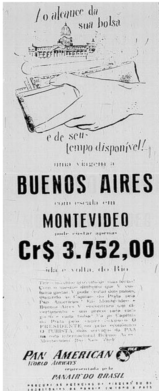
Figura 5: Anúncio de passagens para Buenos Aires. (1950)