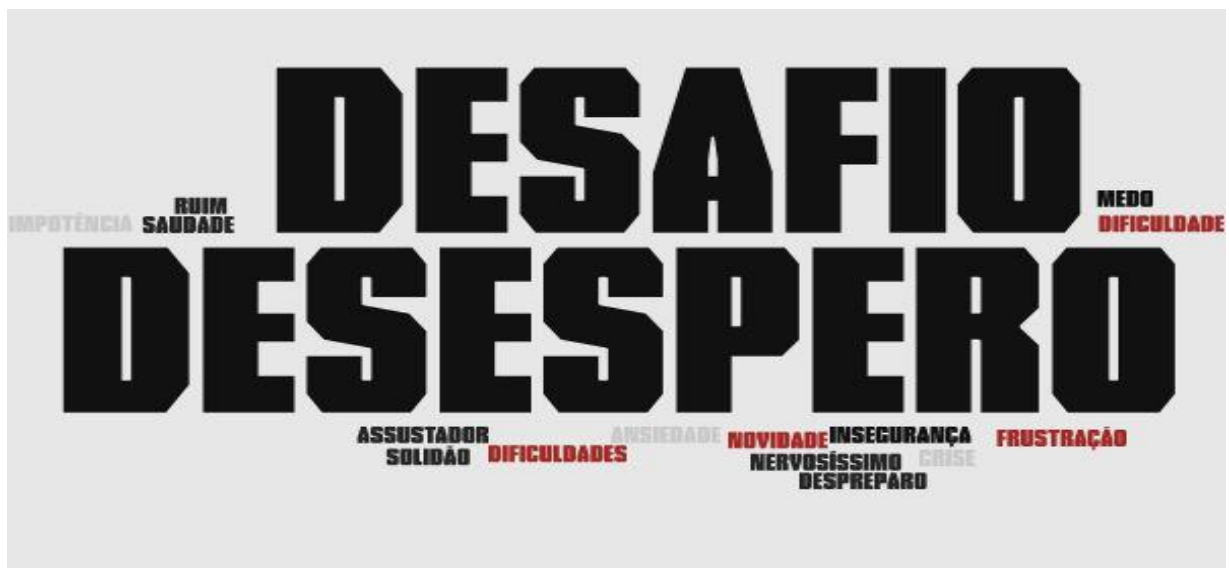
Figura 1 – Nuvem de palavras

Os participantes, inicialmente, responderam com uma palavra ou uma frase curta, totalizando quatorze palavras, sendo que algumas palavras foram citadas mais de uma vez. Retratamos, a seguir, por meio de uma nuvem de palavras, as primeiras impressões e os sentimentos descritos por professores, pais e estudantes.