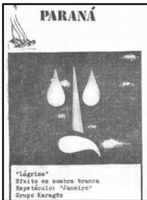
Figura 3: Lágrima – Grupo Karagöz – Curitiba – Boletim APTB.

Em divulgação no boletim de 1986/1987, no qual a Grupo Karagözwk participaria do Congresso da ABTB com o espetáculo Janeiro , consta um pequeno texto sobre ele dizendo que consistia na técnica de teatro de sombras e que a linguagem era basicamente visual com acompanhamento de trilha sonora. O espetáculo ganhou prêmio de melhor pesquisa no Festival Catarinense de Teatro de 1986. Um detalhe singular é a foto da cena do espetáculo que ilustrava a divulgação: Lágrima – efeito em sombra branca (Figura 3). Percebe-se que é uma “sombra de luz” ou “negativo da sombra”, expressões utilizadas atualmente para tal efeito, pois ali é o local onde os