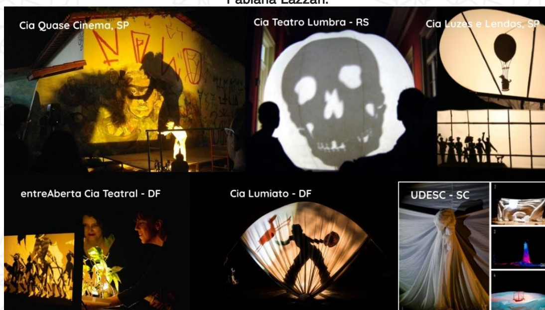
Figura 5: Algumas superfícies de projeção e/ou anteparos de diferentes tamanhos e formas utilizadas por nossos grupos teatrais brasileiros – montagem de fotos acervo Fabiana Lazzari.

As fontes luminosas ou focos de luz 11 tiveram mudanças significativas, tendo uma variedade enorme de formas e diversidades de lâmpadas que nos propiciaram movimentá-los em cena, isto é, usá-los de forma móvel, e conseqüentemente a atuação/animação com as figuras de sombras (silhuetas) também se modificou. Hoje é possível atuar com a fonte luminosa e com as figuras na mão, editando as sombras ao vivo. Pode-se fazer fade-in, fade-out, closes, panorâmicas, fusão de imagens, devido ao acréscimo do dímer. 12 no próprio foco de luz. A maioria dos focos de luz são construídas