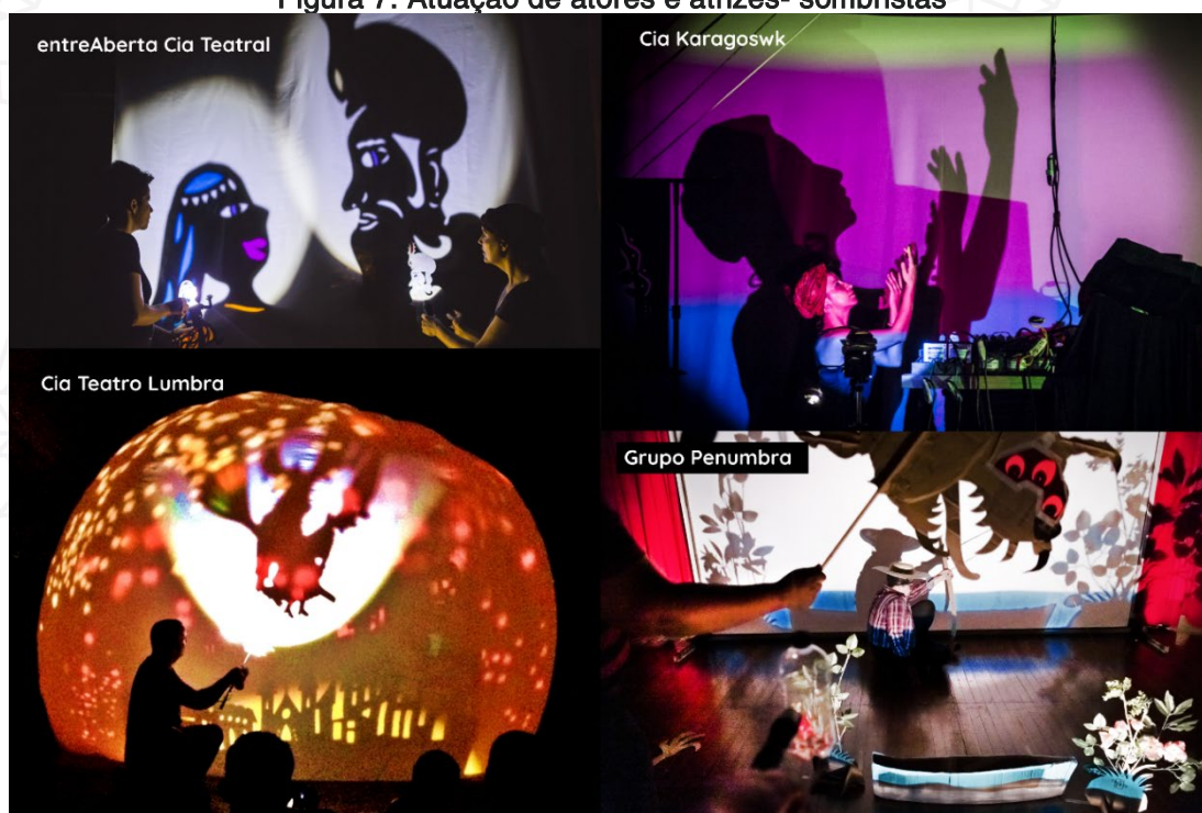
Figura 7: Atuação de atores e atrizes- sombristas

Fotos acervo Companhias de Teatro de Sombras.