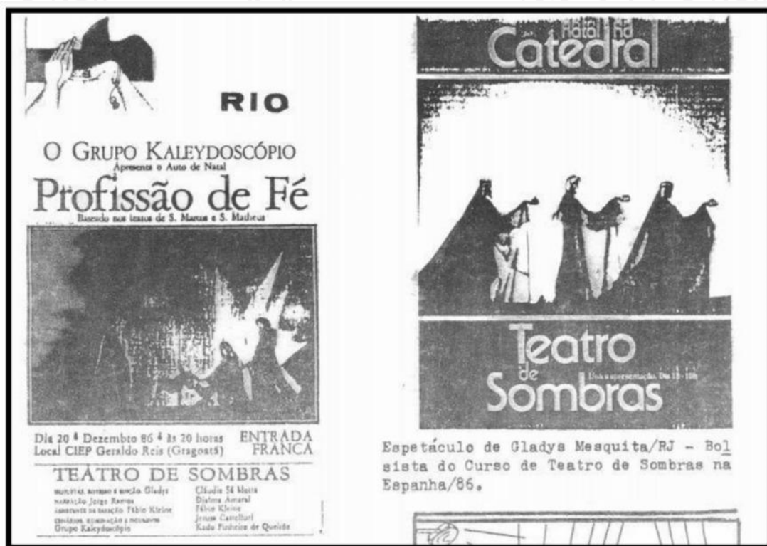
Figura 4: Divulgação espetáculo Profissão de Fé (1987), Grupo Kaleydoskópio, Rio de Janeiro.