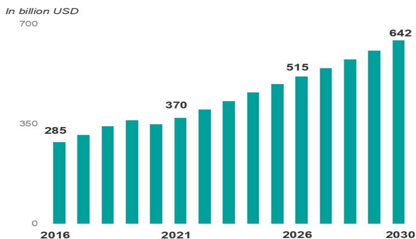
Figura 2 – Evolução da economia espacial 2016 - 2030 Evolution of the space economy 2016-2030

O relatório da Euroconsult, de 2021 apresenta gráfico com os gastos do setor separados por ano e perspectivas desses até 2030, que acabam por corroborar a expectativa de crescimento trilionária do setor, como pode-se observar pela figura a seguir: