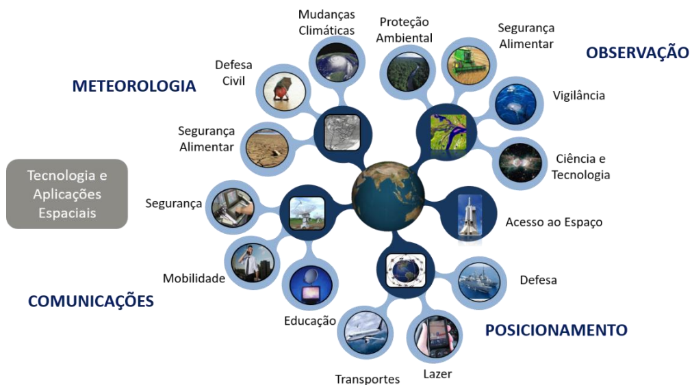
Figura 1: Atividades socioeconômicas das diferentes aplicações espaciais na sociedade.