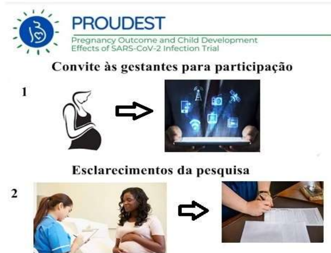
Figura 1 – Fluxograma da coleta de dados