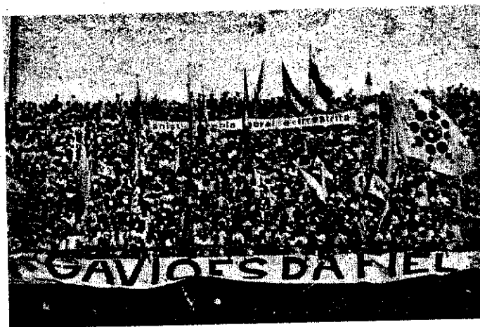
Figura 3a – Torcida de futebol

origens, a distinção entre o contexto de produção e o conteúdo informativo do documento revela-se mais importante. Vejamos o exemplo adiante: 12