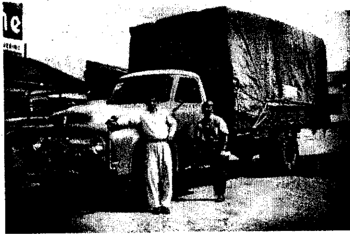
Figura 2 – Fotografia do acervo da Família Hengstmann 11

No entanto, seu sentido familiar, apenas existente no conjunto documental ligado ao seu titular não pode ser esvaziado. Este vínculo evidencia-se na área das notas do banco de dados, elaborado para a organização desta coleção, com a seguinte observação: