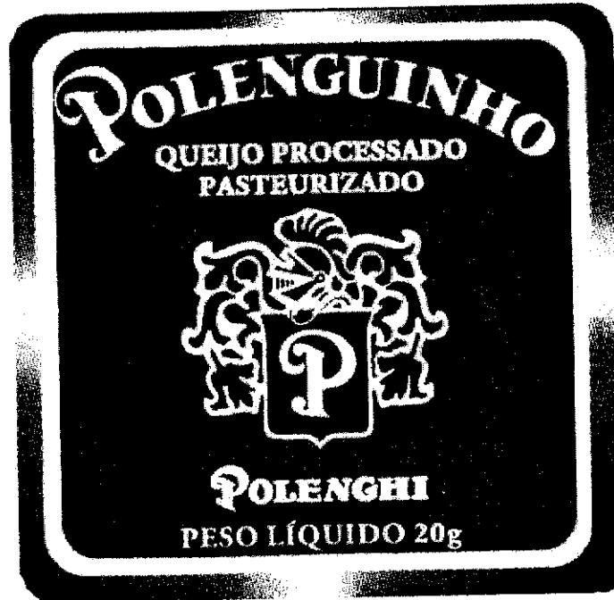
Figura 1 - Rótulo de Polenguinho 2

O rótulo, enquanto documento, explicita o tipo de produto, o conteúdo, o fabricante etc. Traz também indicações sobre o ambiente social onde foi produzida, por exemplo, uma sociedade letrada, onde existem produtos alimentícios industrializados, o que pressupõe redes de distribuição/ circulação dentro de uma economia monetária etc. A partir da embalagem podemos verificar uma série de informações, até certo ponto objetivas. Na face encontramos um rótulo identificando o produto. Nossa experiência nos faz reconhecê-lo como um queijo do tipo fundido. Além disso, observam-se no rótulo os dados do fabricante, o nome-fantasia, o método de fabrico e o tamanho da unidade, deduzível pelo tamanho da embalagem e pelo peso líquido informado. Ainda seria possível seguir, dentro dos mesmos princípios, uma outra linha de raciocínio, procurando obter informações em função daquilo que não está presente na embalagem. Por exemplo, a ausência de dados sobre os ingredientes, a composição do produto, os produtos químicos adicionados, o modo de conservação e outras exigências do Código Brasileiro de Defesa do Consumidor, nos permitem supor que esse produto não é vendido sozinho, porém agregado a outras unidades em uma embalagem maior, onde deverão aparecer tais informações técnicas.