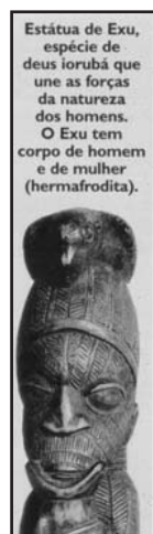
Estátua de Exu, espécie de deus iorubá que une as forças da natureza dos homens. O Exu tem corpo de homem e de mulher (hermafrodita). (Schmidt, 1999: 183)

Uma parte importante dos africanos acreditava num único Deus: eles se tornaram muçulmanos. ( ibidem : 183)