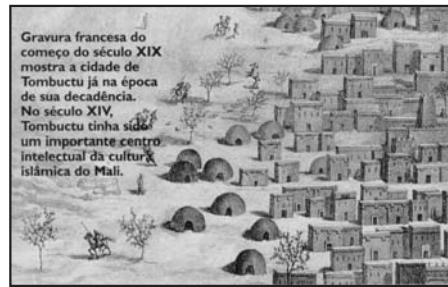
A cidade de Tombuctu ( idem )