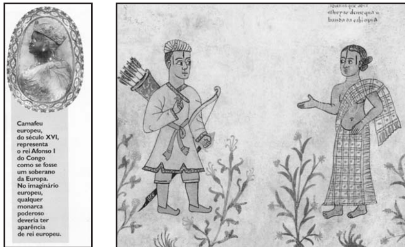
( idem )

cas, das religiosidades, artes e filosofias africanas. Da mesma forma, o autor inova traçando uma linha do tempo com os principais momentos da História do Continente.