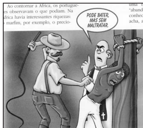
(Schmidt, 1999: 102)

Alertar para as representações feitas de europeus pelos diversos grupos africanos é um exercício fecundo para que os alunos passem a reconhecer a diversidade cultural e a autonomia dos grupos humanos da África. Normal-