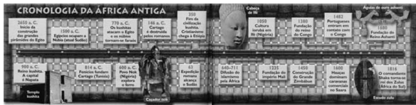
( idem )