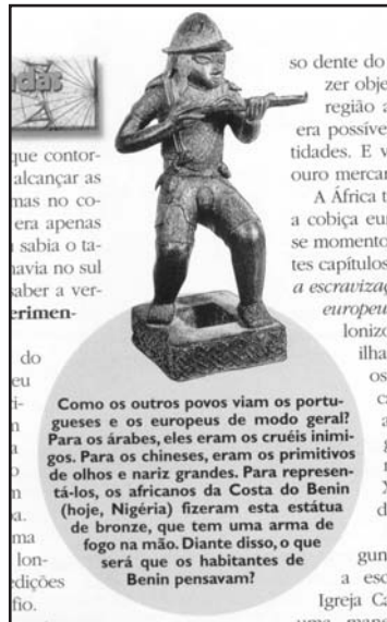
(Schmidt, 1999: 102)

desacertos. Quando trata das relações da África com o mercantilismo europeu e a sua integração ao Mundo Atlântico o autor utiliza corretamente uma imagem feita por um grupo étnico que habitava o Benin, representando os europeus que chegavam ao Continente. A postura mercantil-bélica fica evidente na pequena estatueta.