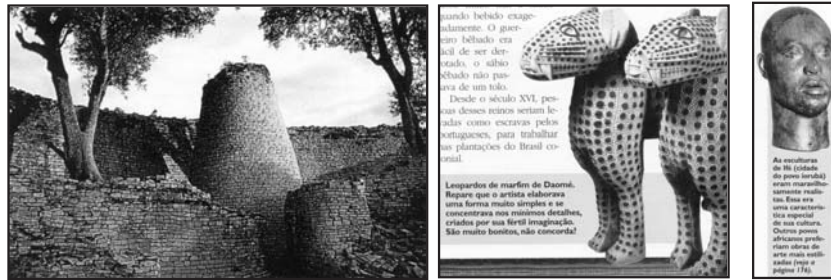
O Grande Zimbabwe (Schmidt, 1999: 182) As artes do Benin e ioruba ( ibidem : 180 e 181)