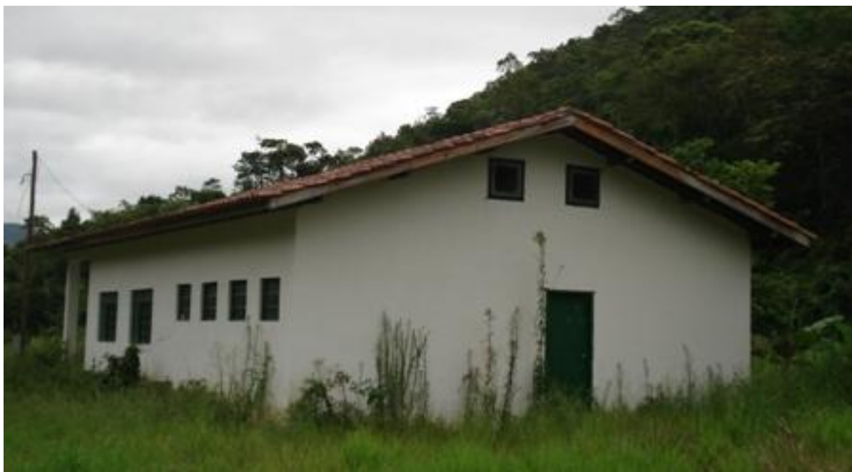
Edificação construída no âmbito do projeto, para processamento de plantas medicinais.