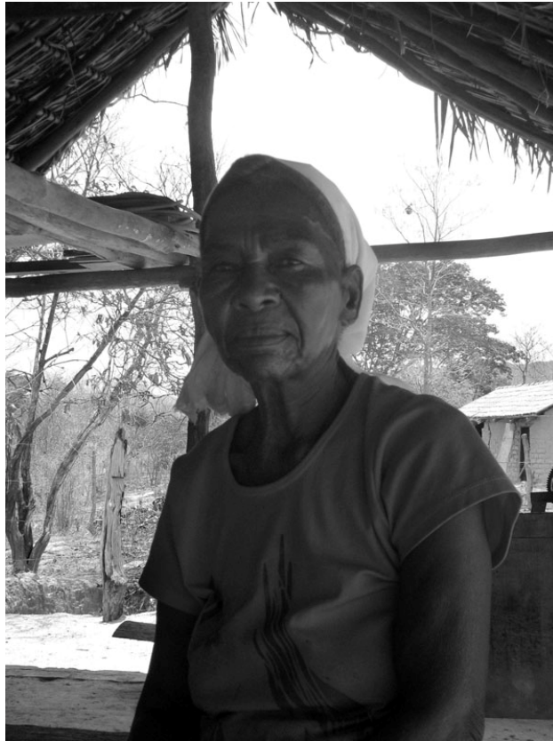
Figura 1: Idosa Kalunga.