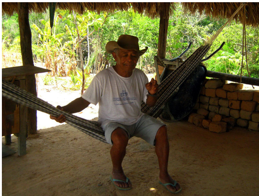
Figura 2: Idoso Kalunga em seu ambiente.

Os sujeitos Kalungas ou Quilombolas, participantes desta pesquisa residem em comunidades isoladas nos municípios de Cavalcante e Teresina de Goiás, que ficam situados na Chapada dos Veadeiros, num dos pontos mais altos do planalto central. A Nação Kalunga, assim considerada por possuir uma raça unificada e um sistema sócio-econômico e político com características próprias, possui uma população em torno de 3.500 habitantes distribuídos por cinco núcleos de maior importância: Vão do Moleque, Ribeirão dos Bois, Vão das Almas, Contenda e Kalunga, e por uma centena de pequenas outras localidades. “Os Kalungas praticam a agricultura como atividade de subsistência e participam do mercado regional. Eventualmente como empregados, ou vendendo e trocando produtos agrícolas. A organização social sem classe e a posse da terra se baseiam nos grupos familiares”, (Revista Ciência Hoje v. 13 nº 75/julho 91).