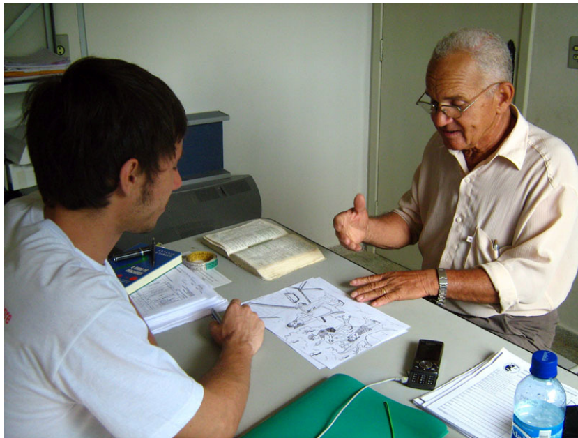
Figura 5: Idoso da pequena cidade de Teresina de Goiás, no momento da avaliação.

Quanto ao Perfil de Eficiência Comunicativa, foi solicitado ao sujeito que descrevesse oralmente a prancha Roubo do Biscoito, do Boston Diagnostic Aphasia Examination 2ª edição da versão espanhola. Todo o discurso foi gravado para posterior análise, a gravação era encerrada quando o sujeito dizia não ter mais nada a falar ou fazia uma pausa igual ou maior a 15 segundos, conforme o estudo realizado em São Paulo, Mansur (2005). Ainda, para os sujeitos da cidade do interior e Kalungas, foi também aplicada uma prancha adaptada à realidade rural, porém contendo os mesmos personagens, ações e desordens da figura original.