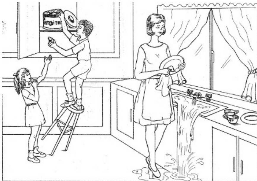
Figura 3 Prancha Roubo do Biscoito

A eficiência na comunicação é determinada por meio de dois índices: Índice de Eficiência Lexical (IEL), que é o número de palavras de informação em comparação com o total de palavras produzidas e o Índice de Suporte Gramatical (ISG), que trata das frases e uso de morfemas, tempos verbais, plural, etc.