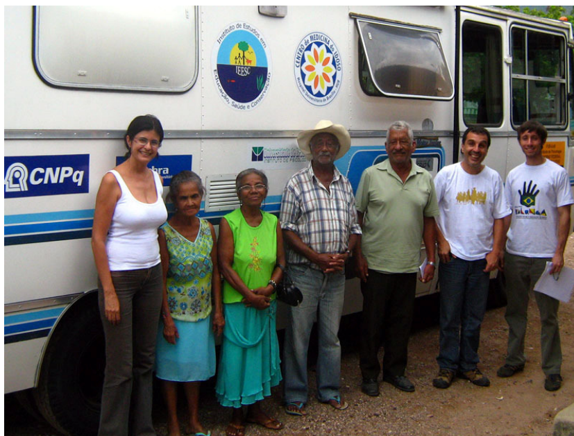
Figura 4: Parte da Equipe do Projeto Viver Kalunga e idosos de Teresina de Goiás.

Este trabalho de pesquisa está inserido no projeto maior Viver Kalunga, Da Silva (2006), o grupo controle é de idosos negros quilombolas, moradores de comunidades isoladas. Os dados deste grupo foram comparados com dados de um grupo de idosos moradores de uma pequena cidade interiorana, dados de um grupo de portadores de Doença de Alzheimer (moradores de metrópole) e de um grupo de idosos sem queixas, também moradores de metrópole, sendo que estes últimos vieram do interior para morar na capital de Goiás, tendo uma média de 35 anos que vivem na capital.