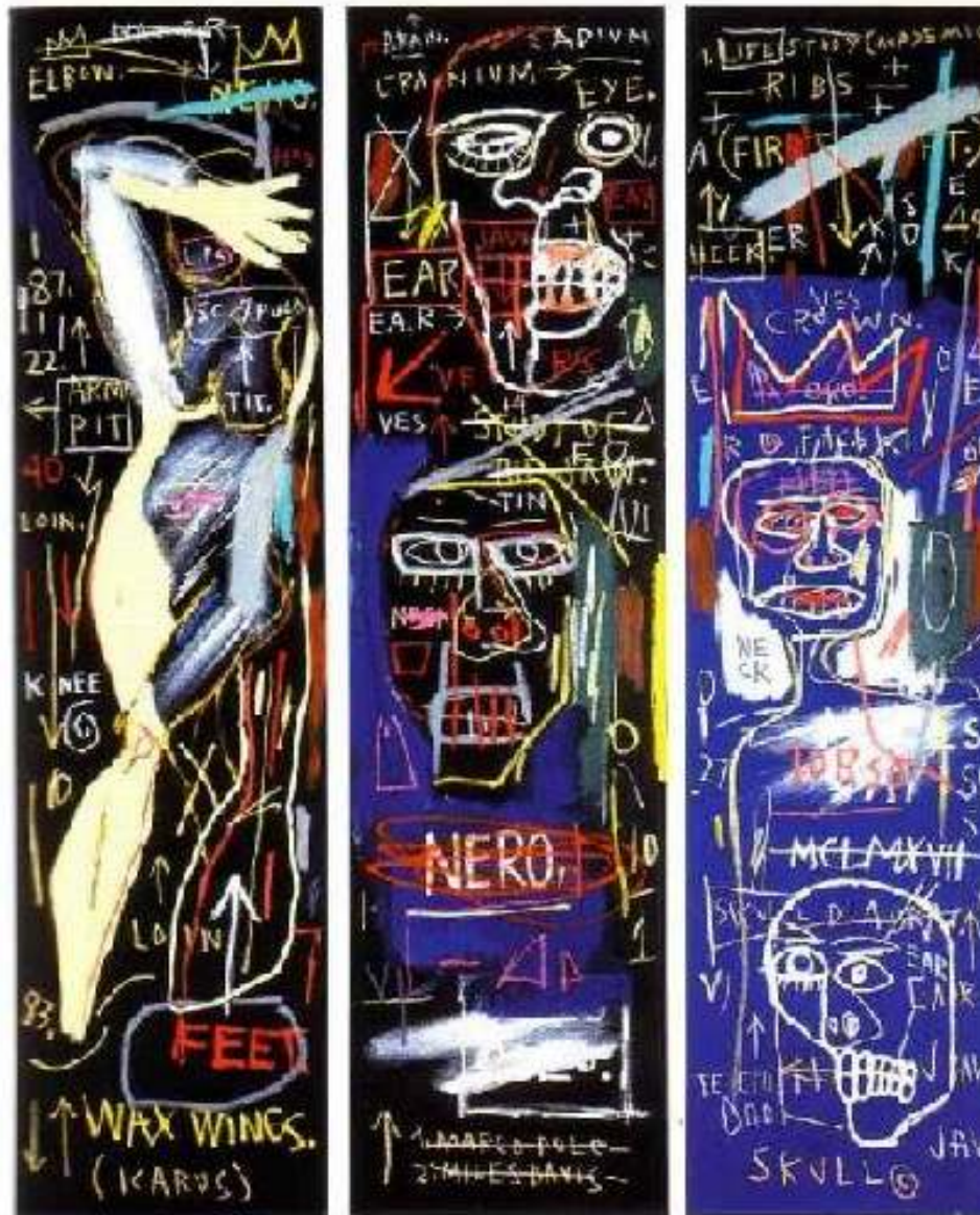
Basquiat, 1982, sem título