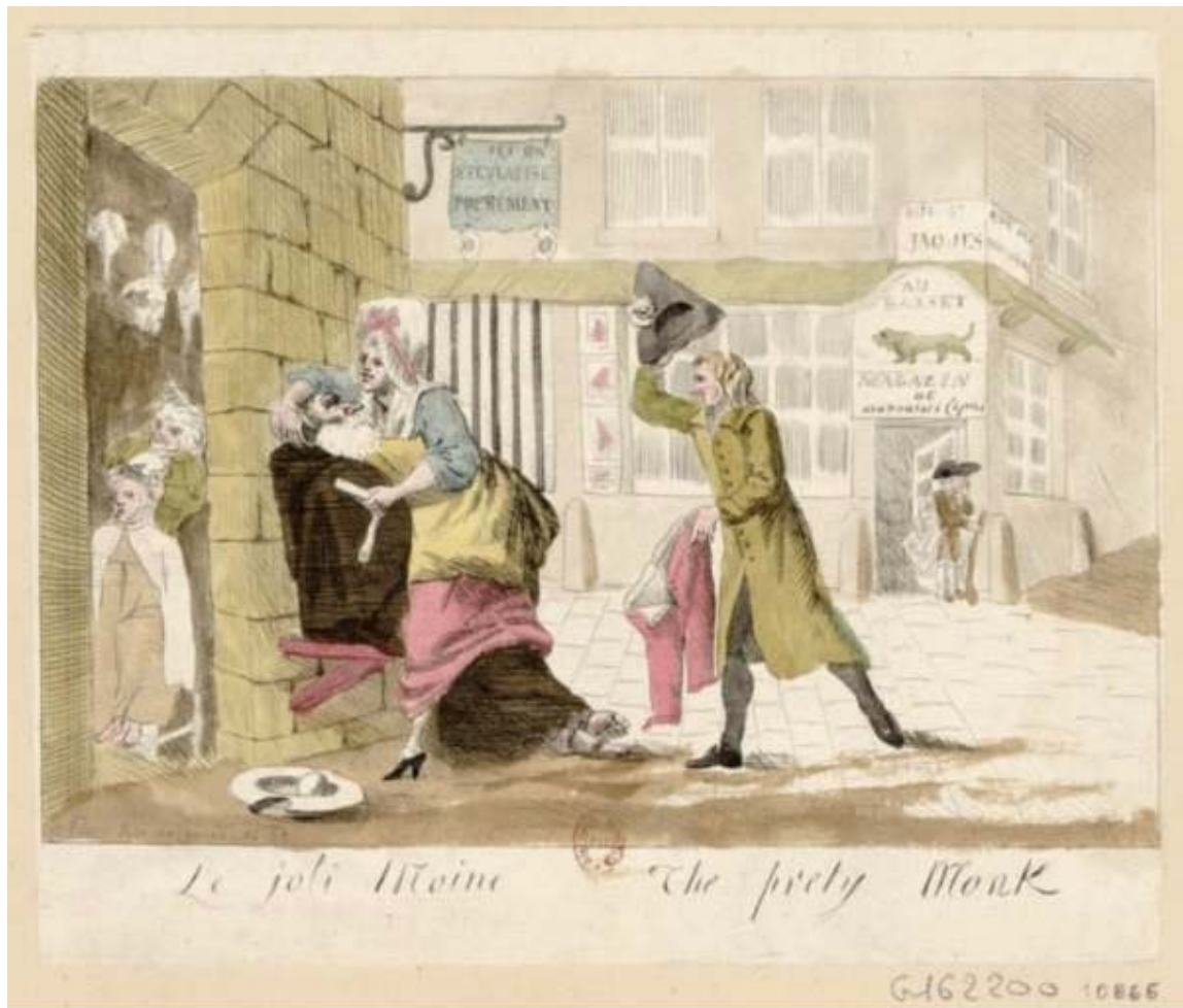
Figura 4 — O monge bonito