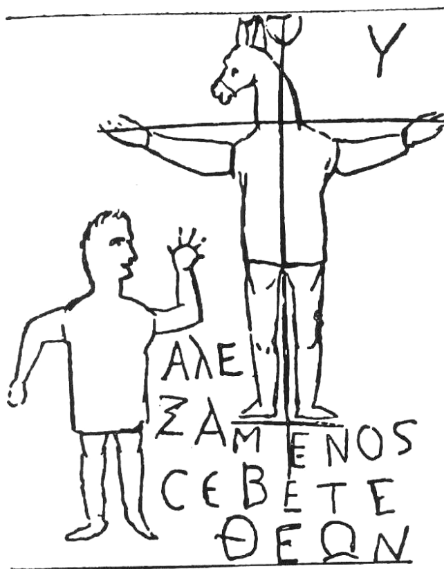
Figura 1 — O Deus Asno

Fonte: Αλεξάμενος σεβετε θεον (Alexâmenos adora a deus). Século III. Grafite no Monte Palatino, Roma. Século III.