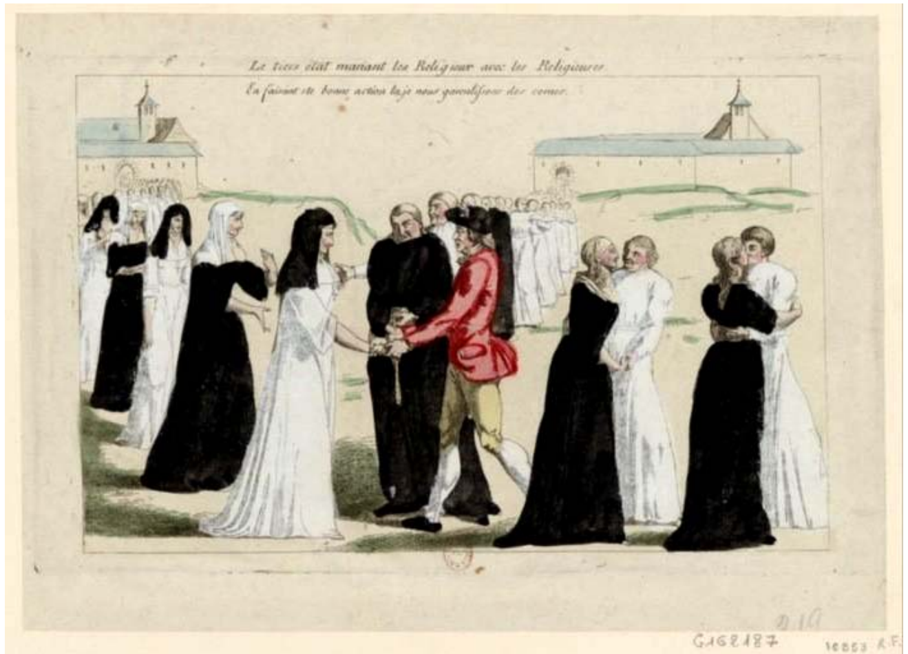
Figura 3 — O casamento dos religiosos