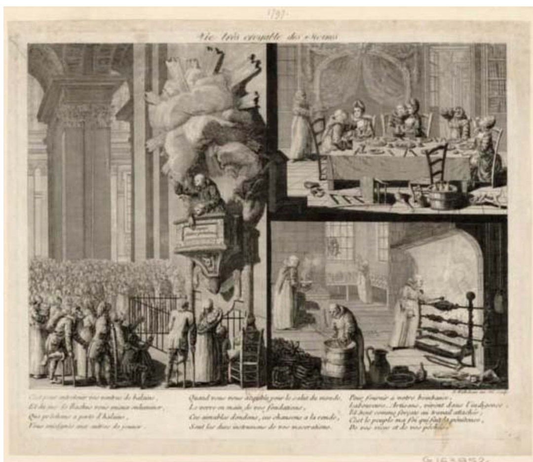
Figura 9 — Monges Penitentes e Devassos

Fonte: VIE très croyable des moines (Vida muito crível dos monges). [Paris: s.n., 1770-1775]. 1 gravura, p&b, 20,5 x 28,5 cm. Coleção da Biblioteca Nacional da França.