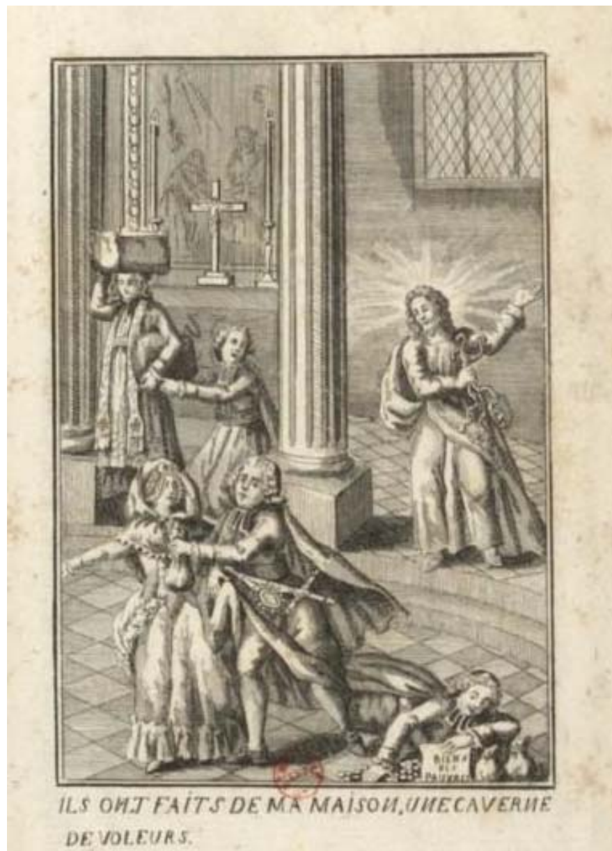
Figura 6 — Os clérigos vendilhões

Fonte: ILS ONT faits de ma maison une caverne de voleurs (Fizeram da minha casa um covil de ladrões). [Paris: s.n.], 1791. 1 gravura, água forte, 12,5 x 8,5 cm. Coleção da Biblioteca Nacional da França.