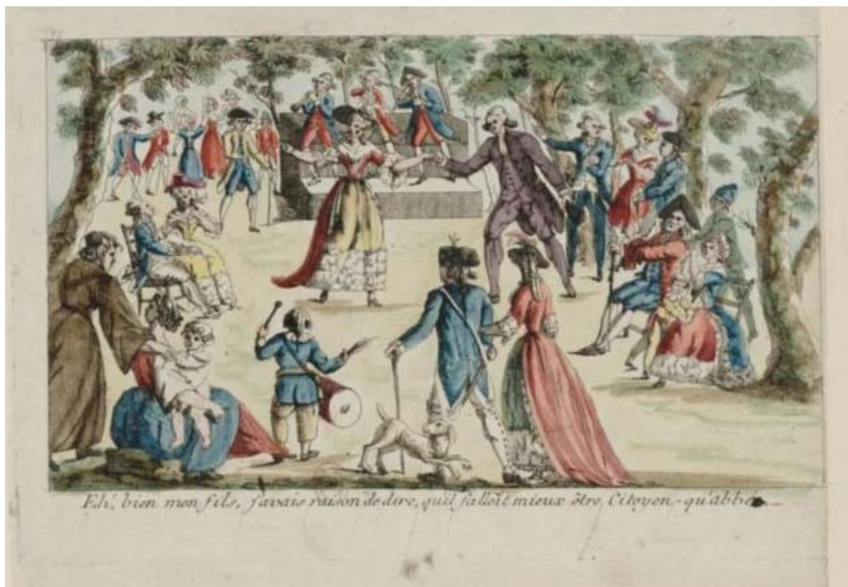
Figura 5 — O padre agora cidadão

Fonte: EH! bien mon fils, j'avais raison de dire, qu'il falloît mieux être citoyen - qu'abbé (É, meu filho, eu tinha razão em dizer que é melhor ser cidadão que padre). [Paris: s.n.], 1790. 1 gravura, color., 16,5 x 24,5 cm. Coleção da Biblioteca Nacional da França.