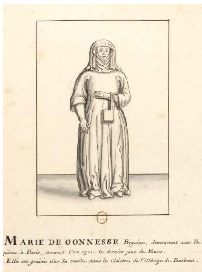
Figura 7 — Uma beguina

Fonte: MARIE de Gonesse: beguine, demeurant aux beguines à Paris, mourut l’an 1321, le dernier jour de mars. Elle est gravée sur sa tombe, dans le cloître de l’Abbaye de Barbeau (Maria de Gonesse: beguina, vivendo com as beguinas em Paris, morreu no último dia de março de 1321. Figura gravada sobre sua tumba, no claustro da Abadia de Barbeau). [S.l.: s.n., 1321?]. 1 desenho lavado. Coleção da Biblioteca Nacional da França.