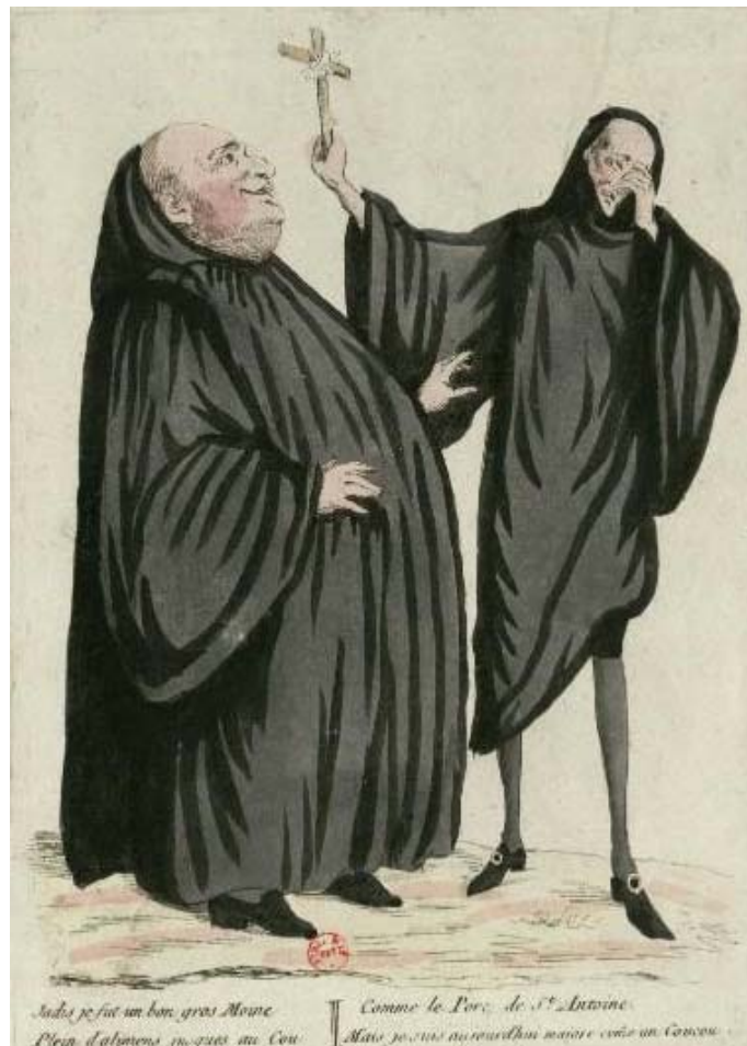
Figura 2 — Um monge magro

Fonte: JADIS je fut un bon gros moine plein d'alimens jusques au cou. Comme le porc de St Antoine: mais je suis aujourd'hui. (Outrora, fui um belo monge gordo, cheio de comida até o pescoço, como o porco de Santo Antônio. Mas, hoje, eu sou...). Paris: [s.n.], 1790. 1 gravura, água forte, color., 22 x 16 cm. Coleção da Biblioteca Nacional da França.