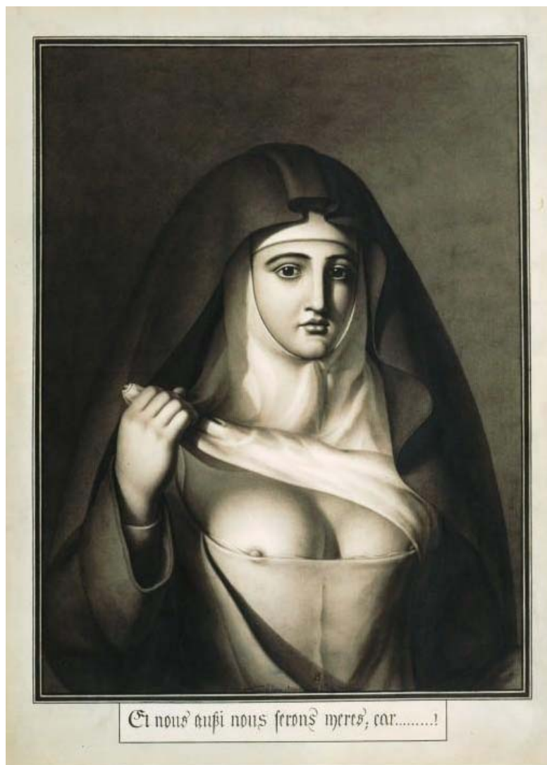
Figura 10 — A monja desnuda

Fonte: LEQUEL, Jean-Jacques. Et nous aussi nous serons meres; car... (E nós também seremos mãe, porque...). 1794. 1 desenho a caneta, 50 x 36,4 cm. Coleção da Biblioteca Nacional da França.