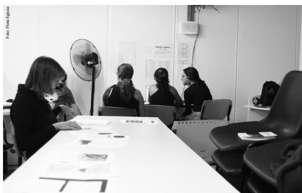
Figura 4 - Equipe em processo de revisão da edição 4.

Na primeira semana de maio de 2009, fechamos as equipes de reportagem, edição e diagramação para cada uma das matérias da edição 4. Também ficou definido o prazo final para entrega dos textos, 8 de junho, e o período voltado aos ajustes, até 15 de junho, bem como a data de lançamento: 29 de junho, antes, portanto, do encerramento do semestre.