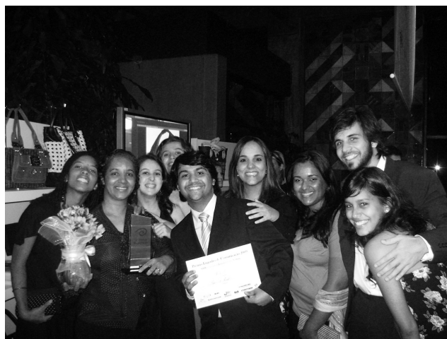
Figura 5 - Integrantes da equipe, edição 4, na entrega do Prêmio Engenho de Comunicação 2009.

primeira capa qualquer personagem ou história que possamos apresentar sob uma narrativa enriquecedora para os leitores desta jovem publicação. O fim da trilha? Desejamos que esteja distante, pois há muito campo para experimentação neste processo de ensino-aprendizagem.