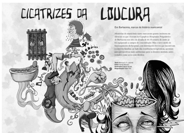
Figura 1 - Páginas iniciais matéria sobre residências terapêuticas em Barbacena, MG, edição 4, Campus Repórter.